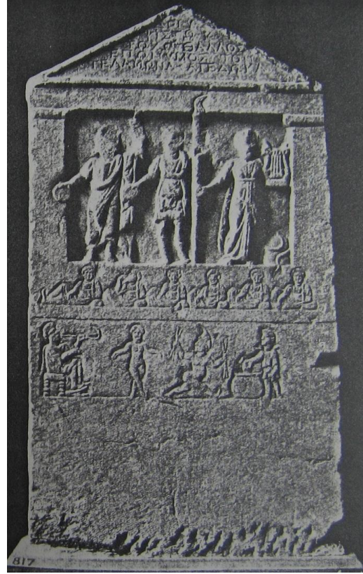
Resim 2: Zeus Hypsistos British Museum, Kat. No: 1890, 0730.1