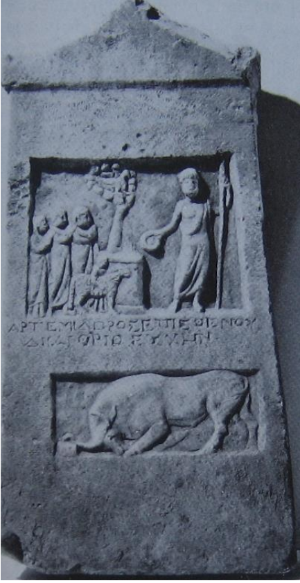
Resim 1: Zeus Aithrios Robert, 1983: 547, Fig. 1.