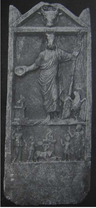
Resim 3: Zeus Olbios Bey, 1908: 523, Lev. 5.