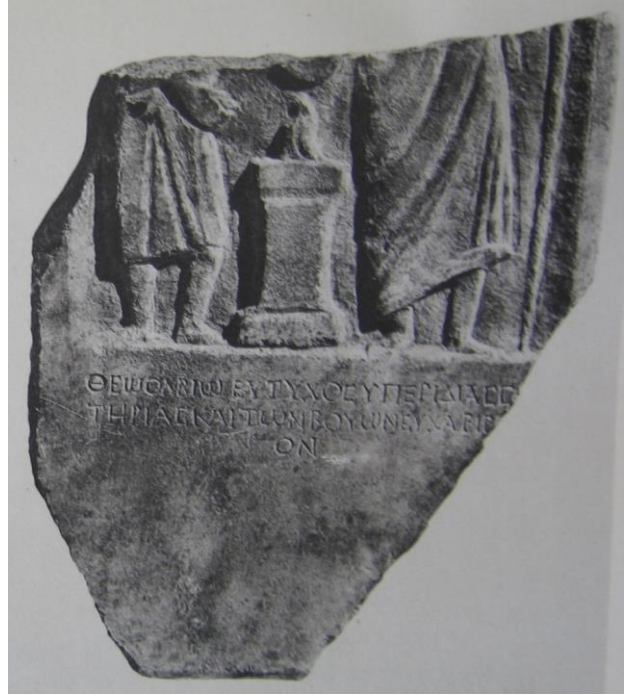
Resim 4: Zeus Olbios Robert, 1936: 58, Lev. 21.