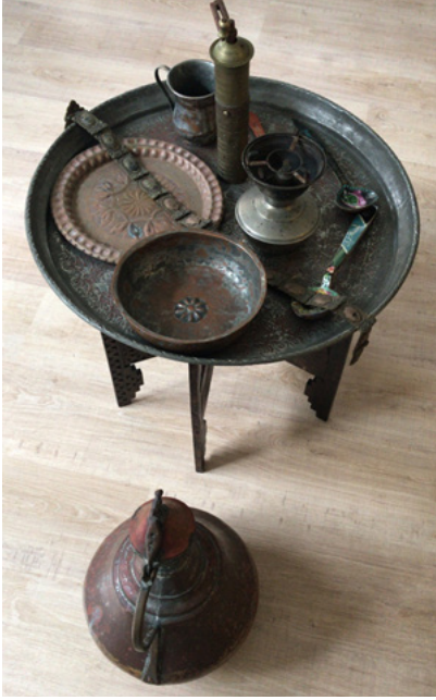
Fig 4. Derneğe bağış yoluyla gelen bakırlardan birkaç örnek.

evi içinde, kırsal bölgelerde lepra ile mücadelenin sembolize edileceği bir köy odasının oluşturulacağını duyan Cüzzamla Savaş Derneği üyeleri, bu odada sergilenmek üzere değerlendirilmesi için bakır objeler göndermişlerdir. Bu objelerin de envanter fişleri oluşturulmuş ve envanter numaraları verilmiştir. Dergi, kitap, tez ve çalışma raporları için de fişler oluşturulmuş, numaraları basılmış ve ön yüzleri taranarak dijitalle aktarılmıştır. Hazırlanan envanter fişleri ve numaralarının ardından, envanter defteri de oluşturulmuştur.