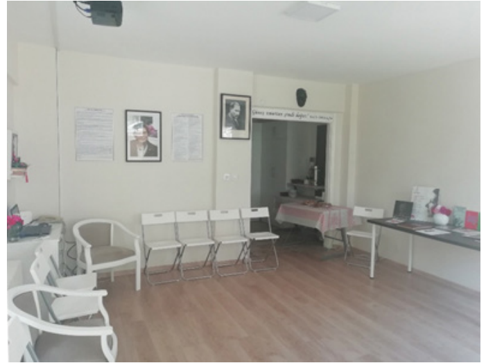
Fig 14. Çok Amaçlı Salon.

Aynı zamanda "Çok Amaçlı Salon" olarak kullanılan giriş bölümü karşılama, ziyaretçi ağırlama ve sunum faaliyetleri için düzenlenmiştir. Açılır kapanır sandalyeler aracılığıyla kısıtlı alanın daha fonksiyonel kullanılması sağlanmıştır.