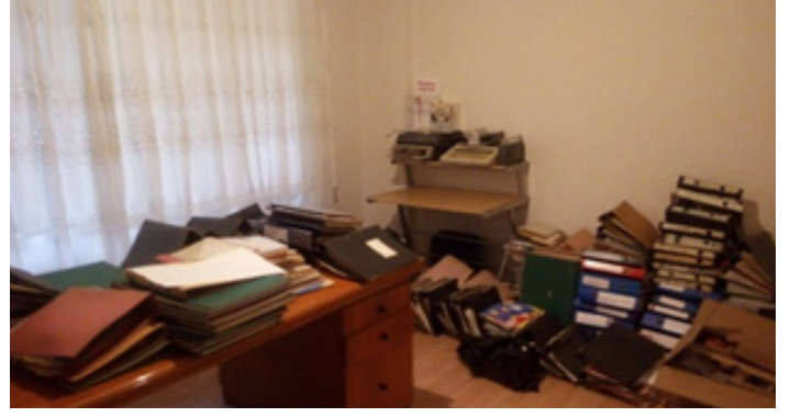
Fig 2. Yazılı evrakların sınıflandırma işlemi.

Proje başlangıcında, anı evinin oluşturulacağı yer olarak planlanan derneğin bulunduğu dairenin fiziksel yapısının iyi olmaması ve mevcut materyallerin belirli bir düzende bulunmaması, yazılı materyallerin ağırlıkta olduğu koleksiyonun hızlıca ayrıştırılıp, sınıflandırılmasını gerektirmiştir.