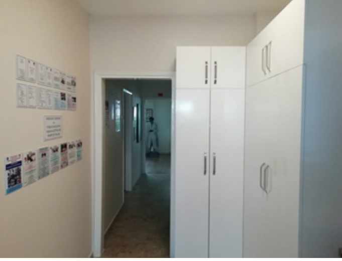
Fig 15. Antre ve hol.

Uz, Seden. "Müze Evler." 2015. http://www.ayk.gov.tr/wp-content/uploads/2015/01/UZ-Seden-M%C3%9C-ZE-EVLER.pdf Erişim Tarihi: 11.05.2019