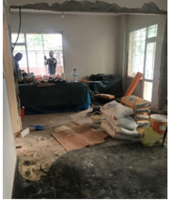
Fig 6. Tadilat süreçlerini gösteren fotoğraf (Sergi Salonu).