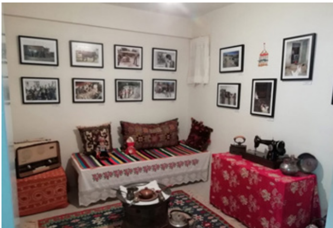
Fig 13. Köy Odası. (Türkan Saylan – Lepra Anı Evi Arşivi).

Bir diğer uygulama ise Köy Odası konseptli gösteri odasıdır. 2000 yılına varmadan Anadolu'nun bütün illeri yoğunlukla da Doğu illerinin taramasını kapsayan alan çalışmasına (cüzzam taraması) ait fotoğraflar, cüzzamla ilgili alan çalışmalarının yanında birçok sosyal projenin (cüzzamdan