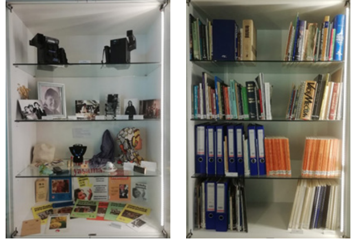
Fig 8 - Fig 9. Sergi Salonu'nda bulunan camlı vitrin uygulamaları.