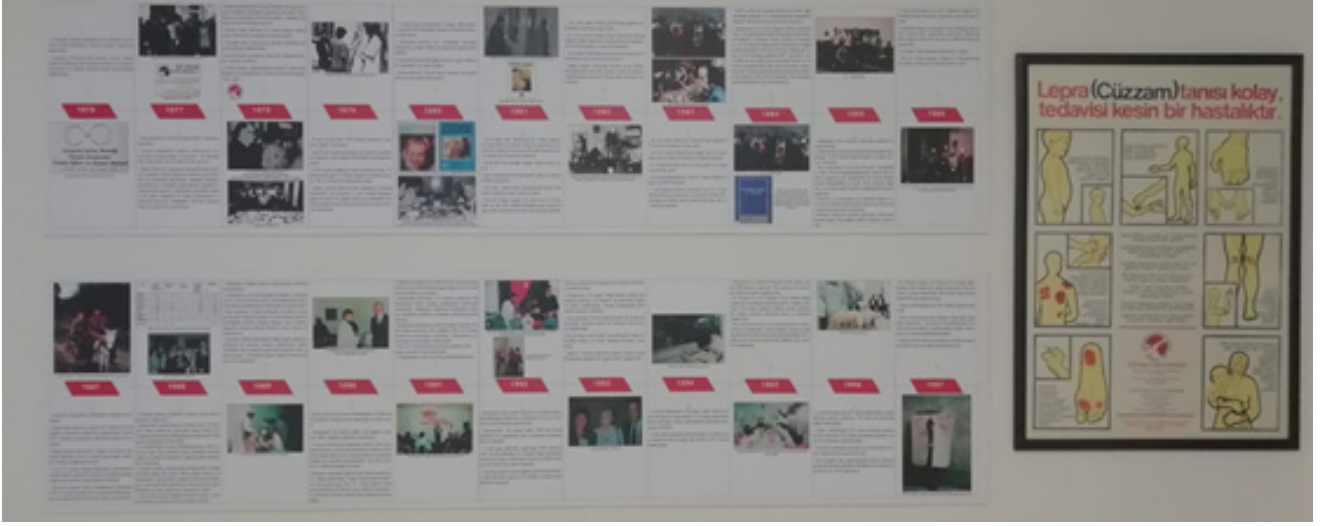
Fig 11. Sergi Salonu'nda bulunan Cüzzamla Savaş Derneği'nin faaliyetlerini anlatan zaman çizelgesi (Türkan Saylan – Lepra Anı Evi Arşivi).