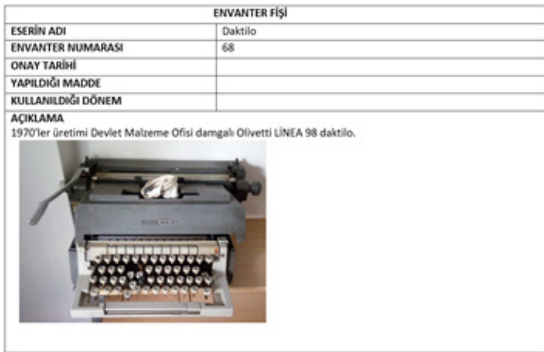
Fig 5. Türkan Saylan – Lepra Anı Evi için hazırlanan envanter fişi örneği.

Sınıflandırma, tarama ve envanter fişlerinin hazırlanmasından sonra tüm eserler dikkatlice paketlenerek tadilat süreci öncesinde depoya kaldırılmıştır.