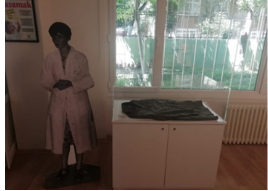
Fig 10. Sergi Salonu'nda bulunan masa tipi vitrin ve stand.

Prof. Dr. Türkan Saylan'a ait pardüse masa tipi vitrinde sergilenmektedir. Yanında Prof. Dr. Türkan Saylan'a ait stand bulunmaktadır.