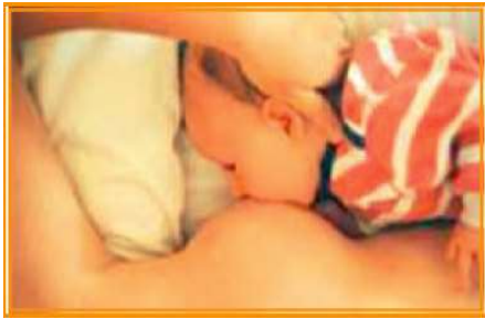
Şekil 6/15-6: Yatar pozisyon ile emzirme