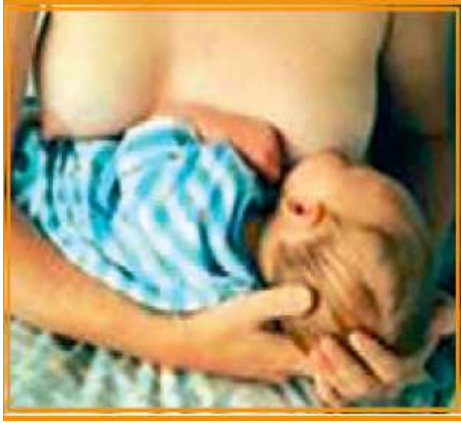
Şekil 6/15-4: Çapraz Beşik Pozisyonu