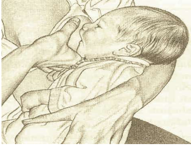
Şekil 6/15-1: Doğru Emzirme Tekniği