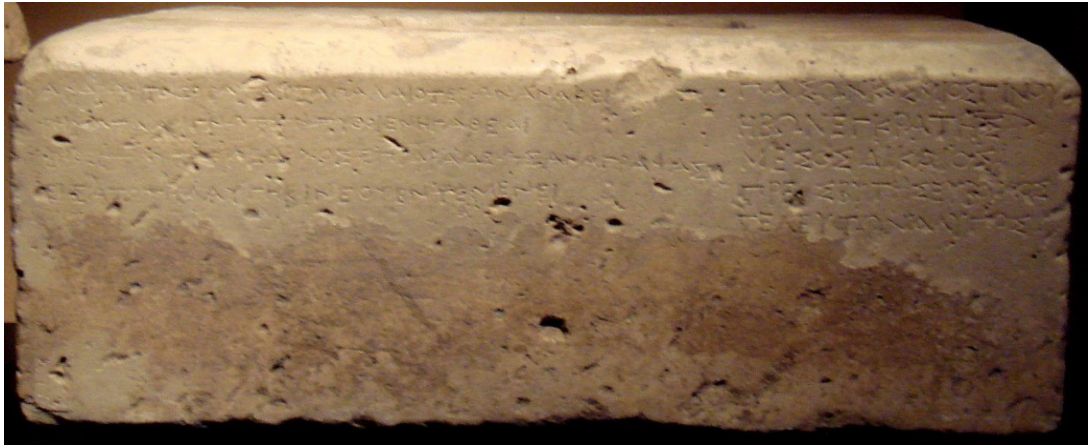
Resim 10. Kineas temenosu

Kentte yer alan bir diğer önemli dini yapı Kineas Temenosu'dur. Aşağı Şehir'e inşaa edilen yapının tanımlanması Clearchus tarafından yazılan bir yazıt sayesinde. Yazıt ikiyüzlüdür ve yapının Kineas'a adanmış bir tapınım alanı olduğunu belirtir. Yapı üzerinde ayrıca bir stelinde yer alması yapının aynı zamanda bir mezar olduğunu gösterir (Martinez-Seve, 2014, s. 265-281; Mairs, 2013, s. 105-106) (Bk. Resim 10).