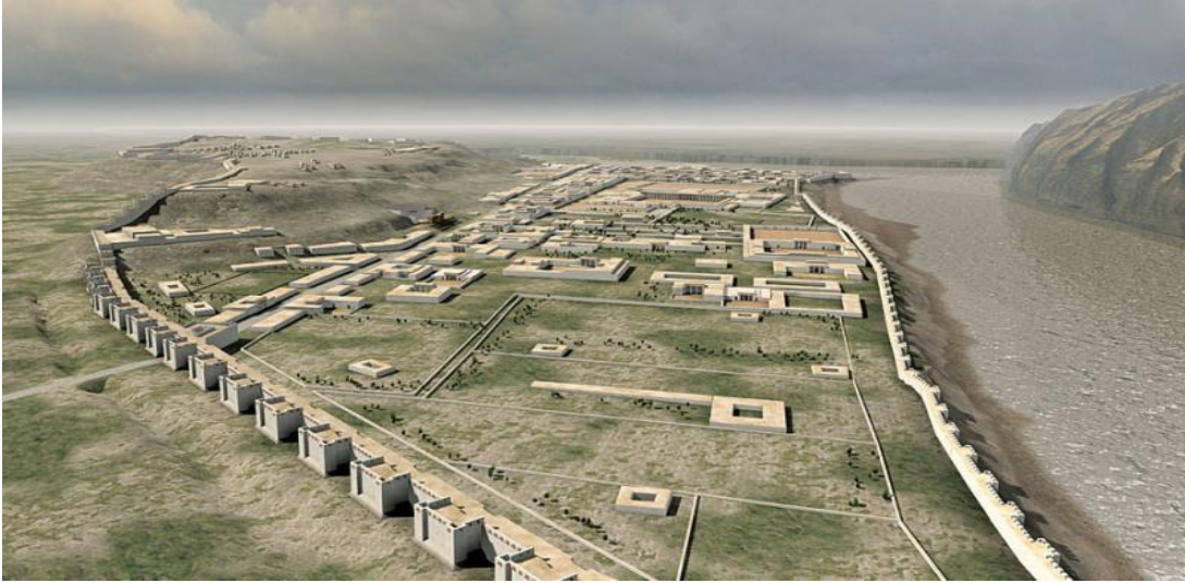
Resim 1. Ai Khanoum kenti rekonstrüksiyon (Mairs, 2014).

Ai Khanoum kentinin batısında Amu Darya nehri güneyinde ise Kokcha nehri yer alır. Kent, doğal bir savunma hattı içerisinde 1,8 km uzunluğunda ve 1,6 km genişliğinde üçgen bir alanı kapsar (Bernand, 1978a, s. 49-51; Rapin, 1992, s. 331). Kentin doğusunda, kuzeye kadar uzanan, kuzeyden ise güney ve batı nehrin terasına kadar inen bir sur sistemi yer almaktaydı. Askeri işlev amacıyla kullanılan dikdörtgen kaleler ve cephanelikler sur sistemine dayanıyordu (Rapin, 1992, s. 331-333). Kentin, güneydoğu tarafında ise 60 m yüksekliğinde yassı bir tepe bulunmaktadır (Bk. Resim 1).