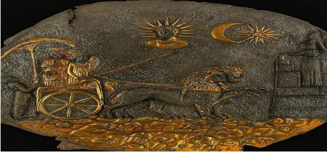
Resim 9. Kybele imgeli madalyon

Tapınak yapısındaki birçok materyal daha sonraki yerleşimciler tarafından çok fazla tahrip edilmiştir. Tapınaktan elde edilmiş buluntuların bazıları Pers sanatı motifleriyle ilişkilendirebileceğimiz zanaatçılık içerir. Tapınağın en dikkat çekici buluntusu ise Kybele imgeli yaldızlı gümüş madalyondur (Bernard, 1970, s. 339-341) (Bk. Resim 9).