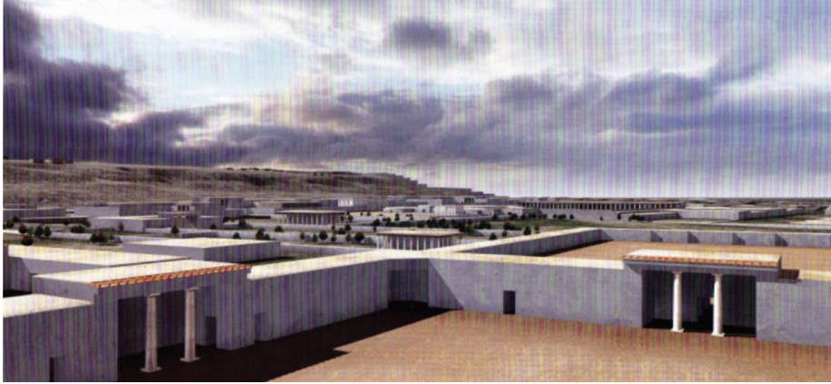
Resim 6. Gymnasium rekonstrüksiyon (TAISEI).

Ai Khanoum'daki Gymnasium ise sarayın kuzeyinde yer almaktadır. MÖ 2. yüzyılın başına tarihlenen yapı planı itibariyle hem Grek hem de Greco-Bactrian gelenekleriyle benzerlik gösterir. Yapının planı simetrikdir. Yapı, 100 x 100 m. uzunluğundaki odalardan oluşan merkezi bir avlu etrafında hizalanmış sütunlu exedraları olan kare plan görünümündedir. Yapının güneye uzanan bölümünde ise bir havuz yer almaktadır (Rapin, 1992, s. 329-324; Bernard, 1974, s. 93-189)(Bk. Resim 6).