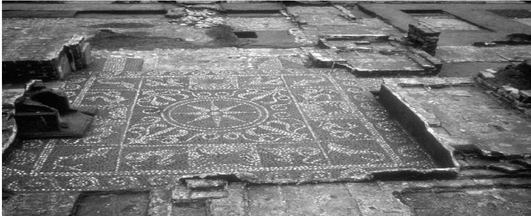
Resim 3. Taban mozaikleri (Bernard, 1975).

Saray'ın güney cephesinde yer alan yaşam alanları ise ön avluya açılmaktadır. Yaşam alanları içerisinde ocakların yanı sıra Grek tarzında banyolar da bulunmaktadır. Odaların tabanları ise kireçtaşı levhalar veya çakıl mozaiklerle döşenmiştir. Saray'ın idari işlerinin yürütüldüğü odaların tabanlarındaki çiçek figürleri ve deniz yaratıkları betimlemeleri ise Yunanistan'da M.Ö 4. ve 3. yüzyıllarda popüler olan bir tekniğin devamı niteliğindedir (Rapin, 1992, s. 329-342) (Bk. Resim 3).