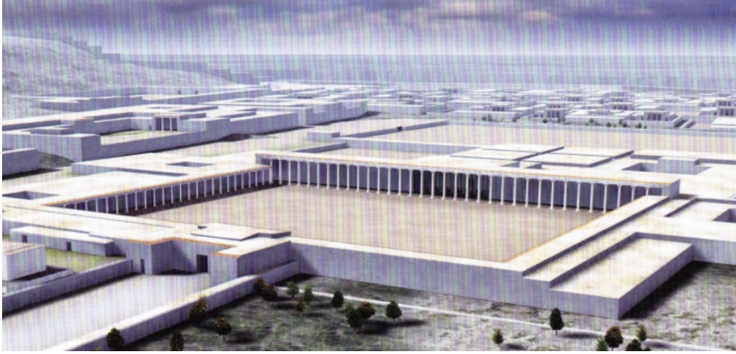
Resim 2. Saray rekonstrüksiyon (TAISEI).

Saray avlusu 137 x 108 m. ölçülerinde geniş bir dikdörtgen alandan oluşur. Avlu, korinth stünlarıyla çevrilidir ve peristyle planlıdır. Avludan odalara geçiş ise üç sıra halinde dizilmiş dorik sütunlardan oluşan sundurmalarla sağlanır. Bu sundurmalar plan itibariyle hypostyle stildedir. Bu dorik geçiş sisteminin ardında ise farklı odalara erişim sağlayan bir koridor sistemi ve oda kümeleri yer almaktadır (Martinez-Seve, 2014, s. 279-280; Hoo, 2015, s. 34). Saray'ın güneybatı tarafında yer alan iki bitişik yerleşim yeri ise Greco-Bactrian evlerinin plan özelliklerini taşır.