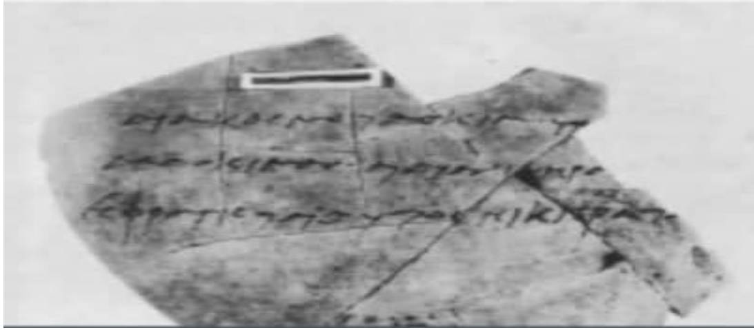
Resim 4. Amphora (Rapin, 1987).

Hazinelerde saklanacak olan her materyal bir amphora'nın içine yerleştirilirdi ve her bir kabın içeriği omzuna yazılırdı. Grekçe ile yazılmış bu yazıtlar, Seleukoslar döneminden miras kalan oldukça gelişmiş bir finansal örgütlenme sistemine tanıklık eder. Ai Khanoum'daki saray hazinelerinde görülen Grek kökenli bu sistem Delos Apollon Tapınağı'nın hazinesiyle büyük benzerlik gösterir. Öte yandan şarabın dağıtımıyla ilgili olarak da kentin ana tapınağı olan Girintili Nişli Tapınak'da Aramice yazılmış ostrakonlar 1 bulunmuştur. Bu durum yerel bir ekonomik yapının varlığını da gösterir (Bk. Resim 4).