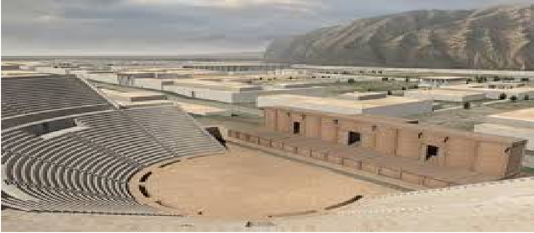
Resim 5. Tiyatro rekonstrüksiyon (TAISEI).

Ai Khanoum'daki Gymnasium ise sarayın kuzeyinde yer almaktadır. MÖ 2. yüzyılın başına tarihlenen yapı planı itibariyle hem Grek hem de Greco-Bactrian gelenekleriyle benzerlik gösterir. Yapının planı simetrikdir. Yapı, 100 x 100 m. uzunluğundaki odalardan oluşan merkezi bir avlu etrafında hizalanmış sütunlu exedraları olan kare plan görünümündedir. Yapının güneye uzanan bölümünde ise bir havuz yer almaktadır (Rapin, 1992, s. 329-324; Bernard, 1974, s. 93-189)(Bk. Resim 6).