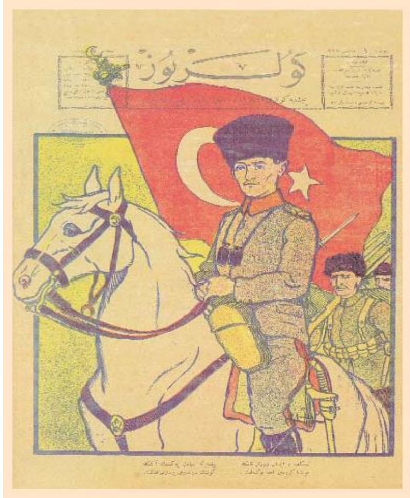
Resim 1: Güleryüz Dergisi, 5 Mayıs 1921, Sayı:1

1 Nisan’da kazanılan II. İnönü Savaşı’nın etkisiyle çizilen Güleryüz’ün ilk sayısının kapağındaki karikatürde beyaz atın üzerinde oturan ve arkasında Türk bayrağı bulunan Mustafa Kemal Paşa’ya yer verilerek derginin Milli Mücadele’de durduğu taraf açıkça ifade edilmiştir (Demirkol, 2015: 141). Haftalık olarak perşembe günleri yayınlanan Güleryüz, 22 Haziran 1922 tarihinde 60. sayısından itibaren pazartesi ve perşembe günleri olmak üzere haftada iki gün yayınlanmaya başlamıştır. Güleryüz yayın periyodunun değişmesiyle tasarımı da değiştirmiştir. Her sayının kapağında artık tek bir karikatür değil, diğer gazeteler gibi çoklu kısımlardan oluşan mizanpaj uygulanmaya başlamıştır. 6 sayı haftada iki kez yayınlanan Güleryüz 66. sayıyla birlikte tekrar perşembe günleri olmak üzere haftada bir yayınlanmaya