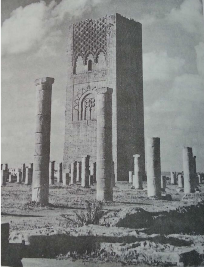
Resim-3 Rabat'taki Hasan Camii (İbn Sahibusalât'tan)

Bu dönem, Hıristiyanlar ile şiddetli çatışmaların yaşandığı bir süreçtir. Elde edilen zaferler sonucu askerler hem moral kazanmış hem de dağıtılan ganimetler ile memnun olmuşlardır. 49 Kazanılan en büyük zaferlerden biri olan Arak/Erek savaşı sonrası dengeler değişmiş, Hıristiyanlar arasında kargaşa başgöstermiş, 50 bunun üzerine VIII. Alfonso barış istemek zorunda kalmış ve taraflar arasında beş yıl süreli yeni bir antlaşma imzalanmıştır. 51