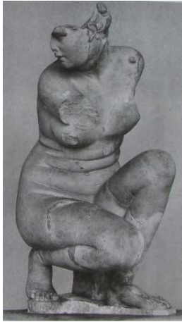
Şekil 5. Çömelen Aphrodite. Çıplak heykel MÖ 3. yüzyılda yapılmış eserin kopyasıdır (Smith, 2002: 97, res. 102).