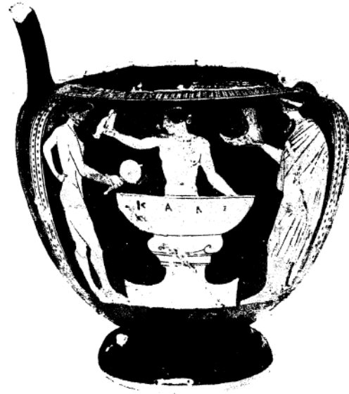
Şekil 11. Krater üzerinde temizlenen kadınlar çıplak tasvir edilmiştir (MÖ 440 civarı) (Duby ve Perrot, 2005: 215, res. 41).

Blanck, H. (1999). Eski Yunan ve Roma'da Yaşam (Çev. İ. Tanrıkkurt). İstanbul: Arion.