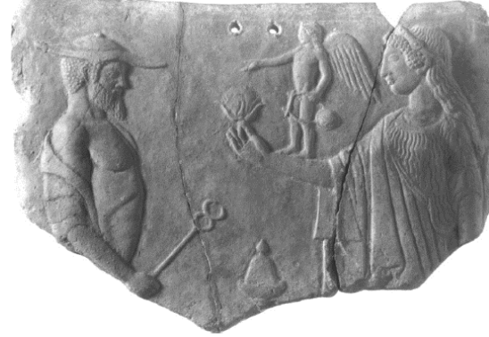
Şekil 2. Aphrodite'in terrakota kabartma üzerinde Eros ve Hermes'le birlikte tasvir edildiği sahne (MÖ 460) (Breitenberger, 2007: 93, pl. 7).