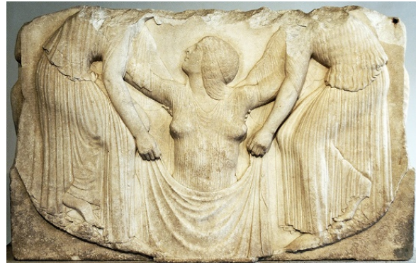
Şekil 3. Aphrodite'in doğuşu. Üzerindeki ince kumaşlı elbisesi hatlarını belli etmektedir (MÖ 470-460) (Richter, 1979: 81, res. 124)