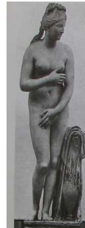
Şekil 9. Capitolini Aphrodites'si. Orijinali MÖ 3-2. yüzyıl (Smith, 2002: 96, res. 99).