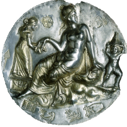
Şekil 4. Madalyon üzerinde Aphrodite yarı çıplak betimlenmiştir (MÖ 300-200) ( https://www.bmimages.com/preview.asp?image=00034561001&itemw=4&itemf=0001&itemstep=1&itemx=6 ).