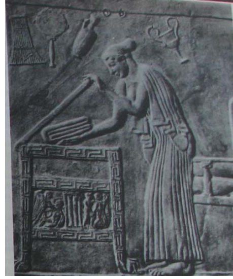
Şekil 10. Locri'den pişmiş toprak kabartma üzerinde sandığa giysilerini yerleştiren bir kadın betimlenmiştir (MÖ 400) (Richter, 1979: 317, res. 505).

Bilgin, N. (2004). Felsefeden Ekonomiye Antik Yunan Dünyası . İstanbul: Arkeoloji ve Sanat.