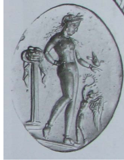
Şekil 8. Altın yüzük üzerinde, Aphrodite elinin üzerinde güvercinle çıplak olarak betimlenmiştir (MÖ 4. yüzyıl) (Carpenter, 2002: 59, res. 68).