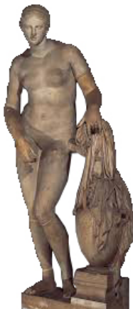
Şekil 6. Knidos Aphrodite'si, orijinalin kopyası (Sönmez, 2006: 407).