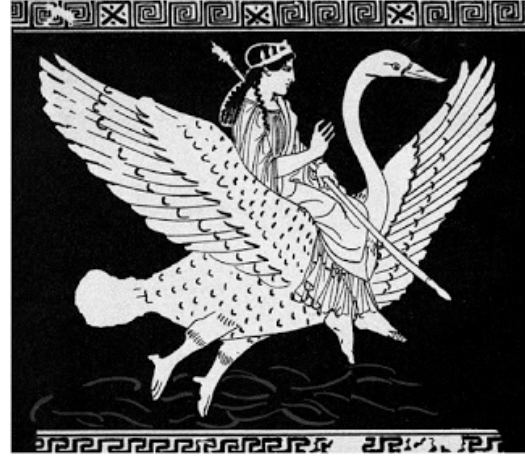
Şekil 7. Elinde asa tutan Aphrodite bir kuğunun sırtındadır (MÖ 440 civarı) (Carpenter, 2002: 59, res. 67).