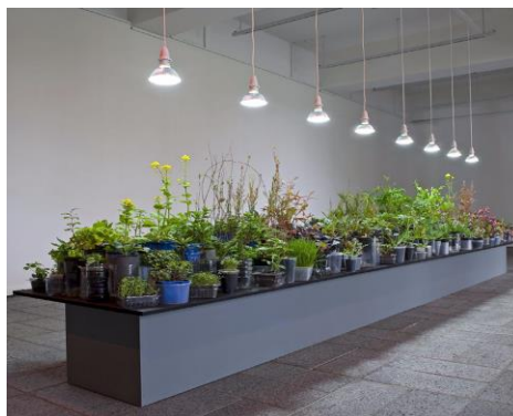
Görsel 8. Laurent Berkowitz, Manna/Manna, 2009 (URL 9) (Visual 8. Laurent Berkowitz, Manna/Manna, 2009)

Çalışmalarında dünyanın tahribatına neden olan sanayisel atıkların organik doğa üzerinde yarattığı olumsuz etkilerin doğal çevre habitatlarında meydana getirdiği kirliliğe dikkat çeken Lauren Berkowitz ise zamanın akışkan döngüsünün mekânsal bazda girdiği etkileşimi doğada yok olmayan endüstriyel atıklarla ifade etmektedir (Görsel 8). Özellikle plastik hammadde ürünlerin doğaya zararları üzerine eleştirel söylemler geliştiren sanatçı, "beşeri faaliyetler sonucunda doğal çevrenin bozulmasına dikkat çekmek için aralarında günlük kullanımın ardından ortaya çıkan ve atılan çok sayıda miktarda plastik şişe, saksı ve ambalajın da olduğu bulunmuş ve geri dönüştürülmüş nesnelere de sıkça yararlanmaktadır. Ona göre, insan eliyle ortaya çıkan bu aşırı miktardaki atık, bizi doğayla bağımızı yitirme ve artık yiyeceklerimizin nerede ve nasıl üretildiği hakkında hiçbir fikrimiz olmaması noktasına getiren sürecin bir parçasıdır" (Brown, 2014:239).