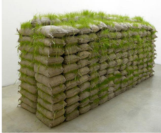
Görsel 5. Mona Hatoum, Hanging Garden/Asmabahçe, Çuvallar, toprak ve çimen, 2008 (URL 6) (Visual 5. Mona Hatoum, Hanging Garden, Sacks of soil and grass, 2008)

Sanatçının diğer bir çalışması olan Hanging Garden (Asmabahçe) da Hatoum, savaş süresince cephelerde ateş esnasında barikat ve güvenlik unsuru olarak kullanılan materyaller ile yaptığı enstalasyonu "çatışmayla dolu topraklarda üst üste yığılı kum torbaları, sınırlar ve kontrol noktalarından oluşan manzaranın bir parçasıdır..." Bu çalışmayla "Kontrol noktalarıyla silahlı askerlerin artık görülmediği, unutulmuş kum torbalarının adeta Smithsonvari entropik yıkıntılar halini alabildiği, organik, yaşayan heykellere dönüştüğü bir yer - savaşın açtığı çatlaklar arasından fışkıran otlarla serpilmiş bir ekosistem" betimlenmeye çalışılmıştır" (Bell, 2012:97).