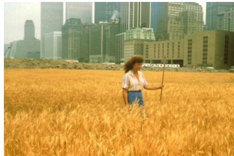
Görsel 1. Agnes Denes, Wheatfield - A Confrontation: Battery Park Landfill/ Wheatfield

(Visual 1. Agnes Denes, Wheatfield - A Confrontation: Battery Park Landfill/ Wheatfield)