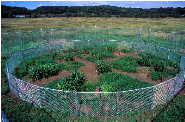
Görsel 2. Mel Chin, Revival Field7Canlanma alanı, 1990 (URL 3) (Visual 2. Mel Chin, Revival Field7Canlanma area)

Çalışmalarının büyük çoğunluğunu sürdürülebilir ekoloji üzerine geliştiren Mel Chin ise sanatın farklı paradigmasını kullanarak multidisipliner çalışmalar üretmektedir. 21. yüzyıl sanatında öncü bir konuma sahip olan sanatçı ekolojik bozulma, politik ekoloji, haritalama (sınırlar), sürreal olaylar ve bunlara bağlı olarak gelişen ezoterik bileşenlerin yanı sıra araştırmalarını bilimsel verilerin realist durumları üzerine iyileştirici, analitik ve lirik söylemler geliştirmesiyle ünlüdür. Sanatçı 1990 yılında yaptığı 'Revival Field/Canlanma Alanı' adlı enstalasyonunda belirlediği ve çevrelediği bir alanda "toksik madenlerin karıştığı toprağın, topraktaki madeni emen 'hiper-bitkiler' ekerek temizlenebileceği fikrini geliştirmiştir. Bu yöntem sayesinde toprağın temizlenmesinin yanı sıra, madenlerin toplanıp yeniden dönüşüm yoluyla kullanıma sokulması ve restorasyon maliyetlerinin azaltılması da mümkün olacaktır" Chin'den akt. Heartney, 2008:176) (Görsel 2)