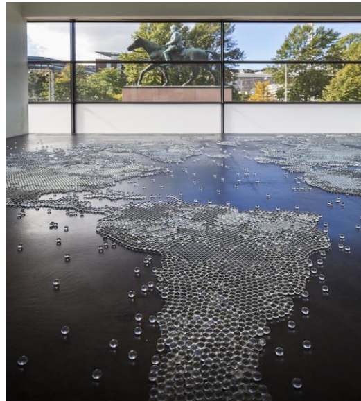
Görsel 4. Mona Hatoum, "Map/Harita, 14 mm'lik bilyeler, 1999, Yeniden iletim: 2007 (URL 5) (Visual 4. Mona Hatoum, "Map/Harita, 14 mm'lik bilyeler, 1999, Re-transmission:2007)

Mona Hatoum ise çalışmalarında dünyanın içinde bulunduğu karmaşa ve düzensizliğe göndermeler yaparak paradoksal katmanları ekolojinin soyut gerçeklik algısı ile bütünleştirir. Sınırlar üzerindeki tahakkümün siyasal erk ile bütünleştiği ifadeleri çalışmalarında konu edinen sanatçı Filistinli olması sebebiyle bağlı bulunduğu coğrafyanın içinde bulunduğu sürekli savaş hali, sınırlar, şiddet, açlık, ötekileştirme gibi sorunları eko - topografik bir biçim olan haritalarla bütünleştirerek haritaların sınırları belirlemede soyut bir gerçeklik barındırdığını ifade etmeye çalışır. "Hatoum'un haritaları, coğrafi ve siyasi sınırları göstermekten ziyade, insanlığa yuva olması beklenen yerküreye nüfuz etmiş tehlike, yersizlik ve kaybolma hislerini çağırıştırır." (Baykal, 2012:27) (Görsel 4)