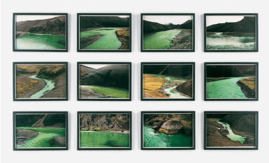
Görsel 3. Olafur Eliason, The Green River Series/ Yeşil Nehir Serileri, 1998 (URL 4) (Visual 3. Olafur Eliason, The Green River Series/ Yeşil Nehir Serileri, 1998)

Mona Hatoum ise çalışmalarında dünyanın içinde bulunduğu karmaşa ve düzensizliğe göndermeler yaparak paradoksal katmanları ekolojinin soyut gerçeklik algısı ile bütünleştirir. Sınırlar üzerindeki tahakkümün siyasal erk ile bütünleştiği ifadeleri çalışmalarında konu edinen sanatçı Filistinli olması sebebiyle bağlı bulunduğu coğrafyanın içinde bulunduğu sürekli savaş hali, sınırlar, şiddet, açlık, ötekileştirme gibi sorunları eko - topografik bir biçim olan haritalarla bütünleştirerek haritaların sınırları belirlemede soyut bir gerçeklik barındırdığını ifade etmeye çalışır. "Hatoum'un haritaları, coğrafi ve siyasi sınırları göstermekten ziyade, insanlığa yuva olması beklenen yerküreye nüfuz etmiş tehlike, yersizlik ve kaybolma hislerini çağırıştırır." (Baykal, 2012:27) (Görsel 4)