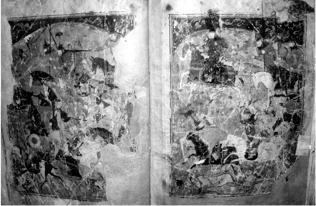
Res. 7: Molla Muhammed Şadı, Fetihnâme , Şiban Han'ın ordularının Sarıpul yakınlarında Babür'ün ordusunu takip etmesi, Semerkant, 1502-1503, Taşkent, Özbekistan Bilimler Akademisi, ARBAŞE, no. 5369, y.206b-207a.

başlamıştır. Kalenin burçlarında ve kapısında bulunan Babür'ün askerleri şehri savunmakta, en üst katta bulunan askerler çaldıkları karney ve kösler 19 savaşın gürültülü ortamını seyirciye duyurmaktadır. Resmin sağında, kalede Semerkantlı iki kadın ve bir grup erkek olayın ürkütücülüğünü izlemektedir. Kalenin orta kısmında pencereden bakan genç bir adam savaşı izlemekte ve eliyle işaret vermektedir. Bu figürün, Babür olduğu düşünülmektedir. 20 Kuşatmanın en iyi izlendiği kalenin giriş kısmındaki pencerede ve savunmayı yönetir biçimdeki el hareketleriyle tasvir edilen bu figürün Babür olması muhtemeldir. Babür'ün askerleri kaleden nişan aldıkları noktalara doğru ok atmakta ve kalenin düşmesini önlemeye çalışmaktadırlar. Ancak bir süre sonra bu saldırıya dayanamayacaklar ve Şiban Han ile Babür arasında yapılacak bir anlaşma ile kale teslim edilecektir.