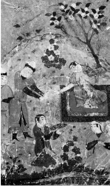
Res. 2: Molla Muhammed Şadı, Fetihnâme, Şiban Han'ın aşk mektubunun Mangıtlardan Musa Mirza'nın kızı Mahdül'e sunulması, Semerkant, 1502-1503, Taşkent, Özbekistan Bilimler Akademisi, ARBAŞE, no. 5369, y.44b.

yer alır. Solda ard arda üç kadın figürüyle elinde uzun siyah bir asa tutan erkek figürü meclise katılanlar arasındadır.