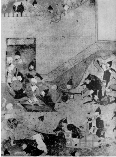
Res. 9: Anonim, Tevârih-i Guzide- Nusretnâme, Şiban Han'ın Semerkant'ı alışı, Semerkant veya Buhara, 1562-1563, Londra, British Library, Or. 3222, y. 130b, (Anonim 1967, res. 299).

lerine dair bilgiler sunar. Bu yanıyla Fetihnâme bütün bu olguları görselleştiren ilk kitap olması bakımından büyük değer taşır.