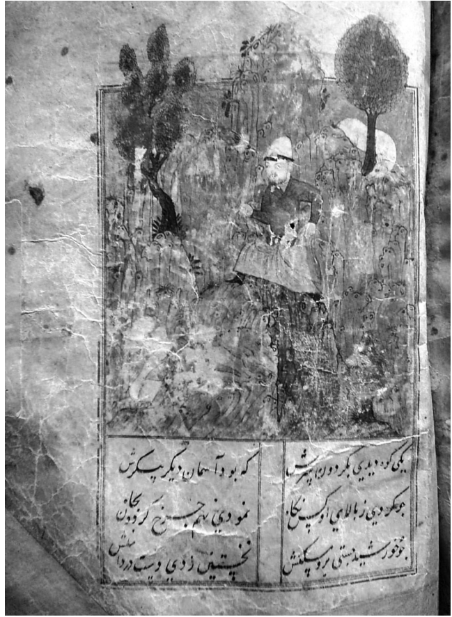
Res. 5: Molla Muhammed Şadî, Fetihnâme , Mahmud Bahadır Sultan'ın esaretten kurtularak dağlarda kaçması, Semerkant, 1502-1503, Taşkent, Özbekistan Bilimler Akademisi, ARBAŞE, no. 5369, y. 140a.

Şiban Han'ın oğulları arasında Sultan Timur'un özel bir yeri vardır. Fetihnâme 'de de Timur Sultan ordu komutanı olarak babasının izinden giden cesur bir kimlik olarak öne çıkarılmaktadır. Şiban Han'ın da bu kitapta Sultan Timur'un da resimlenmesine izin vererek oğlunu yüceltmek istediği ve bu şekilde yetiştirdiği evladıyla gurur duyduğu varsayılabilir. Han'ın oğluna verdiği önemin başka bir göstergesi, 1b sayfasında belirttiği üzere Risâle-i ma'ârif 17 adlı eserini Sultan Timur için yazmış olmasıdır. 18 (Eserin yedinci ve son resmi, bir öncekisi gibi çift sayfa