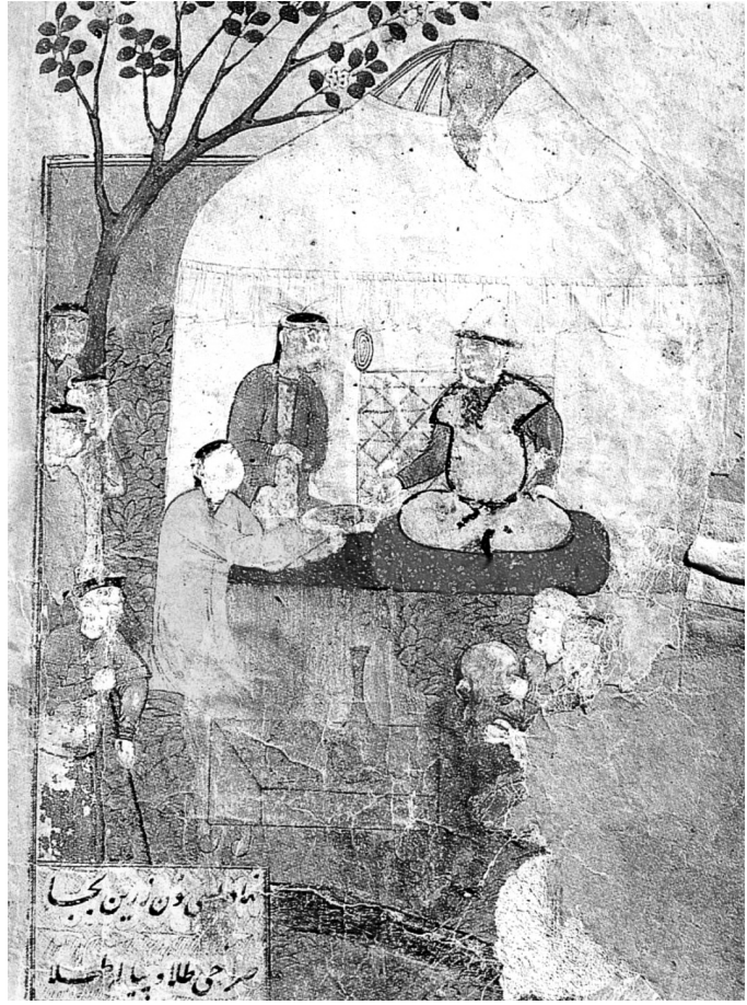
Res. 3: Molla Muhammed Şadî, Fetihnâme, Mahidil ve Şiban Han'ın eğlence meclisi, Semerkant, 1502-1503, Taşkent, Özbekistan Bilimler Akademisi, ARBAŞE, no. 5369, y.54b.

İslam dünyasında bir yöneticinin önemli özelliklerinden biri olan "adil" kavramı, Şiban Han'ın da tarihte anılmak istediği niteliklerden biri olmuştur. Özbek kaynaklarının yanında,