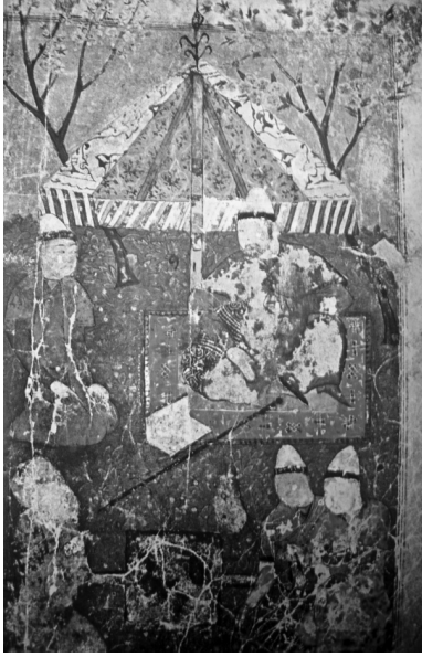
Res. 1: Molla Muhammed Şadî, Fetihnâme , Molla Muhammed Şadî'nin Nevruz günü Şiban Han'a kitabını sunması, Semerkant, 1502-1507, Taşkent, Özbekistan Bilimler Akademisi, ARBAŞE, no. 5369, y.19b.