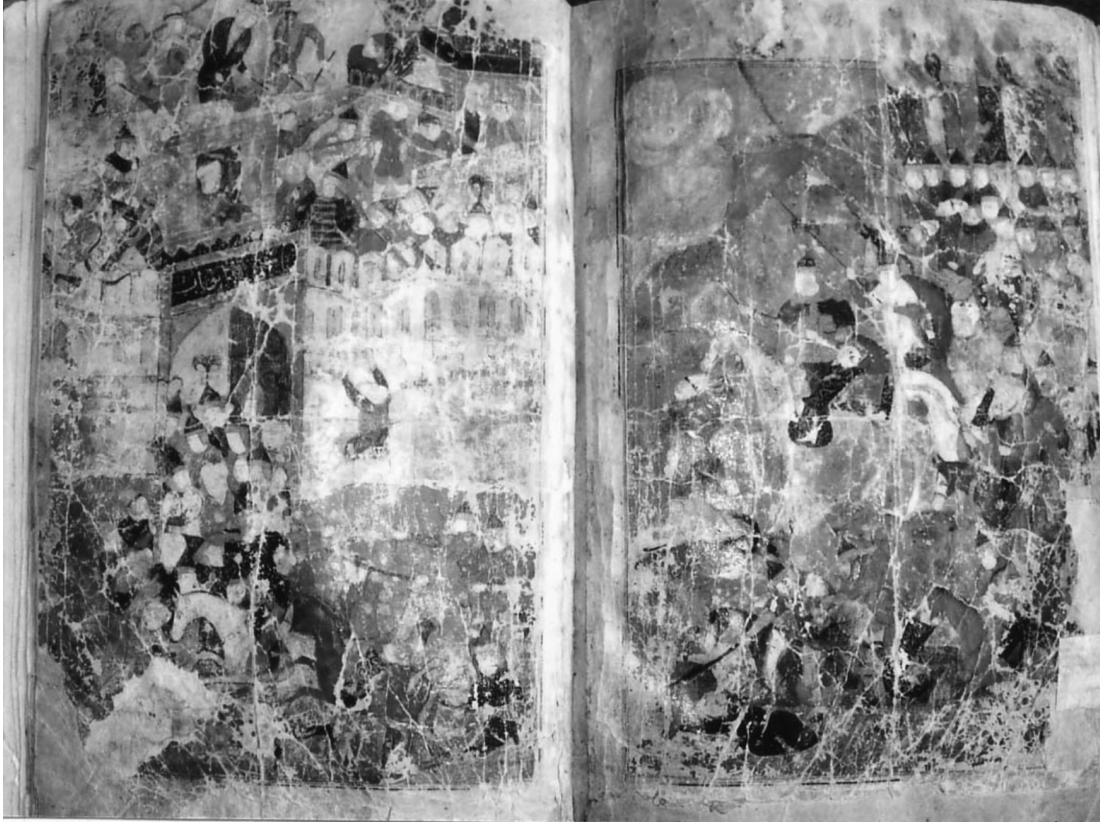
Res. 8: Molla Muhammed Şadi, Fetihnâme , Şiban Han'ın ordusunun Semerkant'a yürüyüşü ve Babür'den Semerkant'ı alması, Semerkant, 1502-1503, Taşkent, Özbekistan Bilimler Akademisi, ARBAŞE, no. 5369, y.213b-214a.