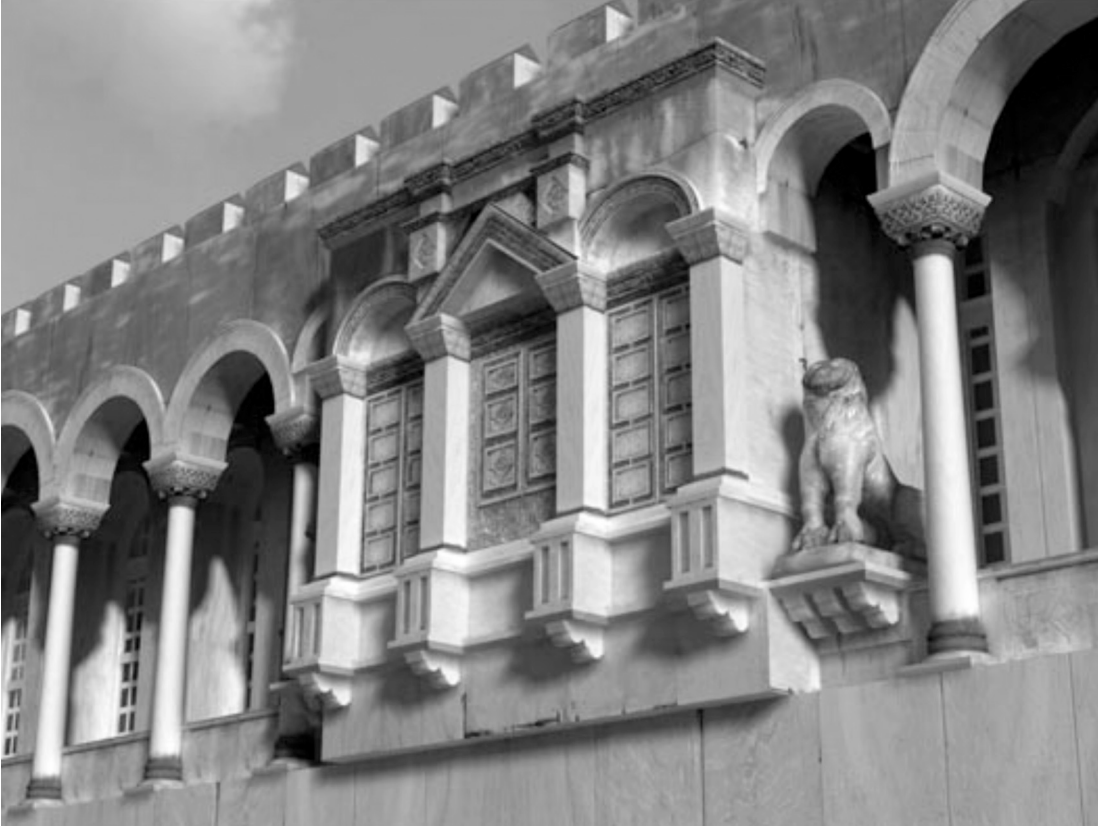
Çizim 3: Tayfun Öner-Byzantium 1200'den

Bu kemerlerin 1871 yılındaki demiryolu inşaatı sırasında kaybolmalarına karşın bahsedilen aslan heykelleri İstanbul Arkeoloji Müzeleri'ne götürülmüşlerdir. 97 (ÇİZİM 3)