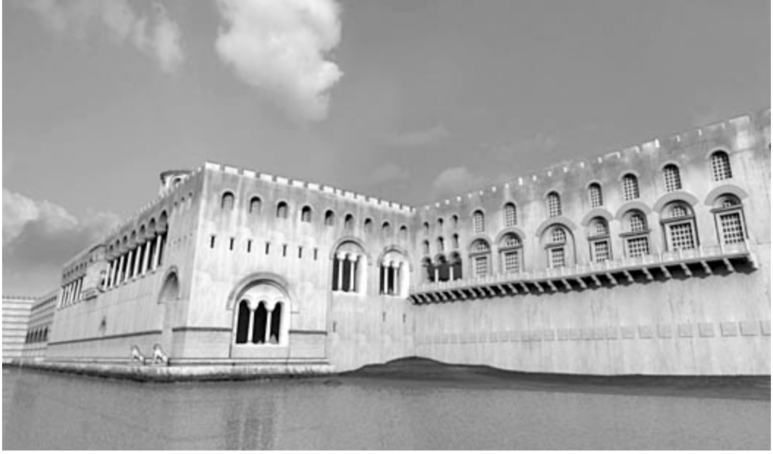
Çizim 4-a: Tayfun Öner-Byzantium 1200'den.