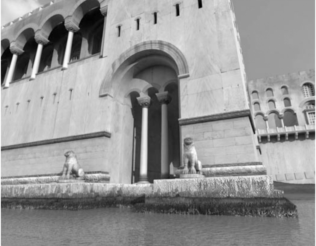
Çizim 4-b: Tayfun Öner-Byzantium 1200'den.