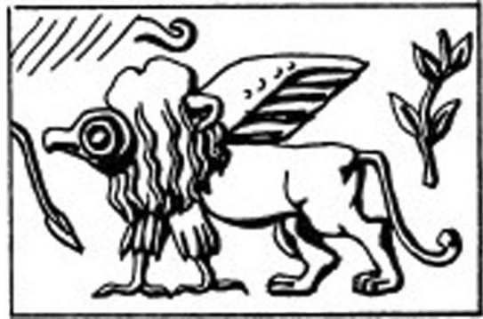
Fotoğraf 7: Susa'dan Grifon