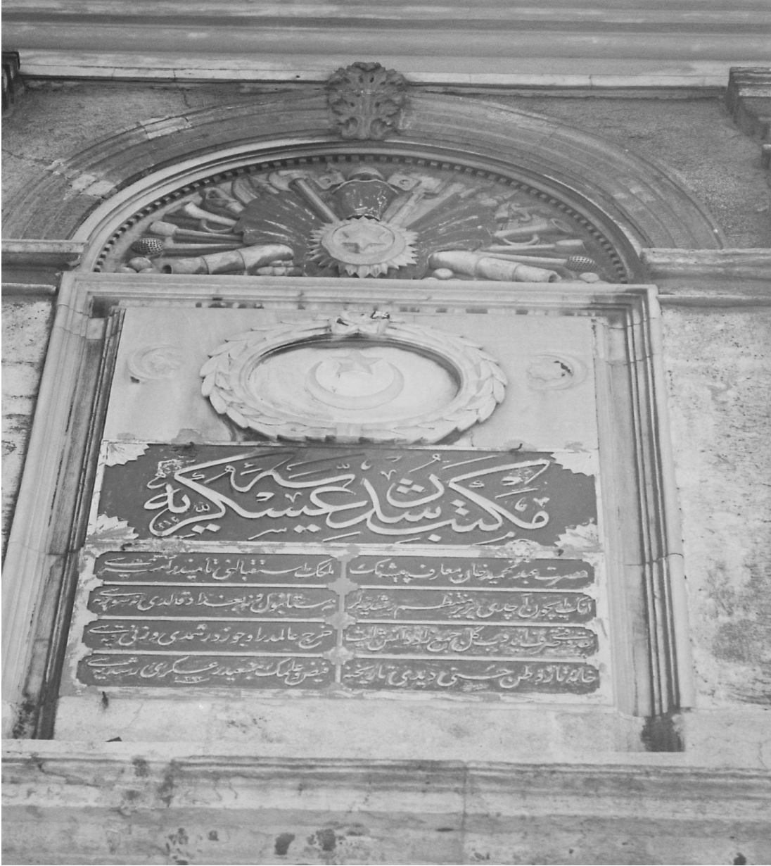
Fotoğraf No 7: Soğukçeşme Askeri Rüşdiyesi'nin Kuzeydoğu Cephesindeki Kitabe ve Madalyon (Fotoğrafı Çeken, Esmâ İğüs, 04 /09 /2008)

Hamidî Rejim, meşruiyetini yapılarda kullandığı süsleme repertuvarları aracılığıyla da kurgulamaya çalışmış, bezeme elemanlarının yapının neresinde ve nasıl kullanılacağına ilişkin bir standart uygulanmıştır. Bu standartın geliştirilmesinde, birçok okul yapısında özellikle de idadilerde, Tip Projelerin uygulanmış olması önemli bir nedendir. Bu noktadan hareketle, okul giriş kapılarının üzerine konulan padişah tuğrası ve kitabeler 16 , padişah egemenliğinin görsel teyidi olup, imparatorluğa kimlik kazandırmak için kullanılmıştır tespitini yapmak mümkündür. Okul kapısından her gün içeri giren öğrenci, öğretmen ve idareciler padişahın tuğrası ve armasıyla