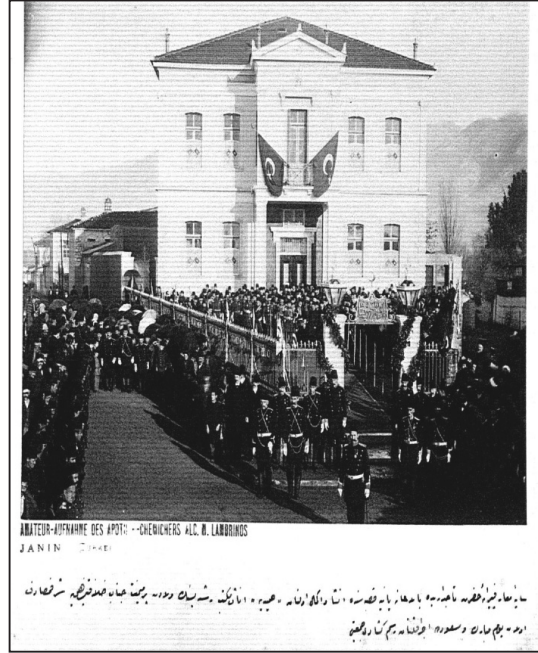
Fotoğraf 3 9 : Yanya, Hamidiye İnas Rüşdiyesi'nin Açılış Merasimi

Okulların küşad (açılış) törenlerinde de, Abdülhamid'in monark özelliği görünür hale getirilmiştir. Açılışlarda devlet erkânının bulun(durul)ması, açılışlara emperyal merasim havasının verilmesi, Sultan'ın merasimler aracılığıyla görünür kılınması ve modernleşme imgesini devletin zihinlerde okullar aracılığıyla rasyonalize etmeye çalışmasıyla ile ilintilidir. Bu bağlamda, eğitimin modernleşme için önemli kavşaklardan biri olduğu motifi gerek siyasi, gerekse yeri geldiğinde popüler motiflerle Erken Cumhuriyet Modernleşmesine de taşınmıştır.