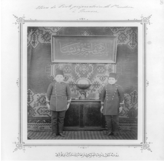
Fotoğraf No 4 13 : Bursa Askeri Rüşdiyesi Öğrencileri “Padişahım Çok Yaşa” Yazılı Levhanın Önünde

Sloganın, halk tarafından sistematik bir biçimde kullanılması için (özellikle merasim ve okul törenlerinde) siyasi erk tarafından gerekli düzenlemeler yapılmıştır. Bu minvalde; merasim veya açılışlarda toplanan kalabalık halk kitlesi “ Padişahım Çok Yaşa ” diye slogan atmış, idadi ve rüşdiye öğrencilerine Padişahım Çok Yaşa yazılı örtülerin önünde poz verdirilerek, stüdyo ortamında fotoğrafları çekilmiştir. Genelde iki öğrencinin poz verdiği bu fotoğraflarda, çağdaş eğitim araçlarından olan küre, bazende kitap dekor malzemesi olarak kullanılmıştır. 12 (Fotoğraf 4) “ Padişahım Çok Yaşa ” yazılı levhanın bu tür görüntülerde mutlaka yer alması, II. Abdülhamid'in fiziksel olmayan, ancak soyut olan varlığının genelde dünyaya, özelde de tebaaya ifadesidir.