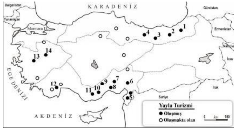
Şekil 3: Türkiye'nin önemli bazı turistik yayla yerleşimleri: 1) Ayder 2) Uzungöl (sürekli yerleşim) 3) Kümbet 4) Çambaşı 5) Belen ve soğukoluk (sürekli yerleşmeler) 6) Zorkun 7) Çamlıyayla (sürekli yerleşme) 8) Gözne (sürekli yerleşme) 9) Kuzucubelen 10) Aslanköy 11) Güzeloluk 12) Beydağları 13) Bozdağ 14) Muratdağı

Şekil 3, ülkemizdeki yayla turizminin geliştiği alanları göstermektedir. Turizme hizmet eden yaylalar, Akdeniz ve Karadeniz bölgesinde yoğunlaşmaktadır. Anadolu Göçebe yaşam alanları Şekil 1 dikkate alındığında, Akdeniz ve Ege bölgelerindeki yaylalar, turizme entegredir.