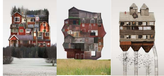
Şekil 1. Genius Loci serisi

Modernitenin ikilikler aracılığıyla ve mimari tasarımı kullanarak kentlerde ulaştığı durumu görmek için kent dokusu kolaj çalışmaları değerlendirilebilir. Kent dokularını tek bir yapıda birleştiren kolajlar yapan Grafik sanatçısı Anastasia Savinova'nın "Genius Loci" adındaki serisi (Şekil 1) şehirlerin karakteristik yapılarını bir araya getirerek, bir ev imajı yaratıyor. "Bir yerin koruyucu ruhu" anlamına gelen Genius Loci kavramı ile sanatçı kentlerdeki dokuyu oluşturan elementleri ve farklılıkları gözlemleyerek "yerin hissi"ni aktaran kolajlarla ikonik yapılar yaratıyor (Gök, 2017).