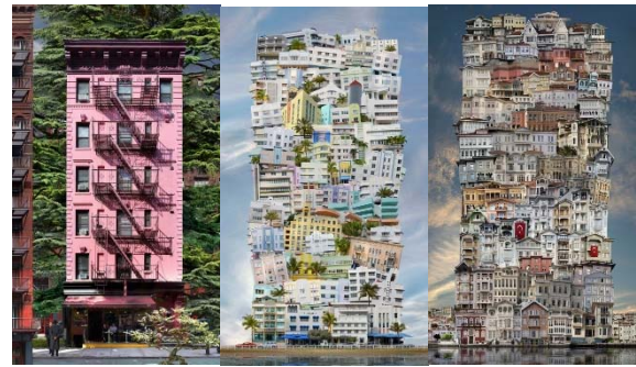
Şekil 2. Babels: Hayali Evren

Jean-François Rauzier Kent dokularını aktardığı "Babels" serisinde (Şekil 2), kültürel motiflerle süslü hayali bir mimari evren sunuyor. Serisinde ilerleme, bunalım, çevrebilim, ütopya ve özgürlük gibi temaları 'hyperphotography' tekniği (büyük ve küçük ölçeklerin bir potada eritilip tek bir parçada betimlenmesine olanak veren teknik) ile işleyen, sanatçı, sanal bir gerçeklik yaratıyor ve insan algısının yeniden inşa edilmesini mümkün kılıyor ( Küçükşen, 2016).