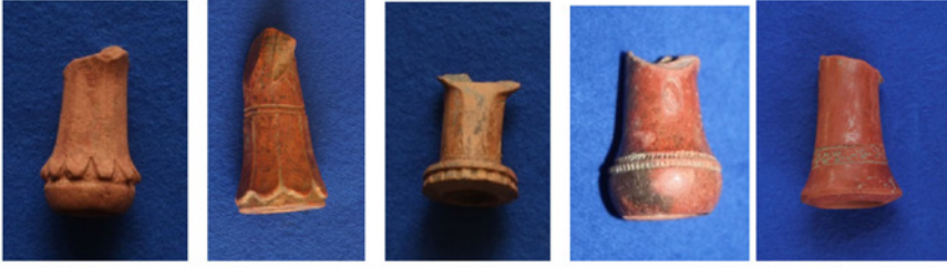
F. 36. DMR 2015-18 F. 37. DMR 2015-19 F. 38. DMR 2015-20 F. 39. DMR 2015-21 F. 10. DMR 2013-4