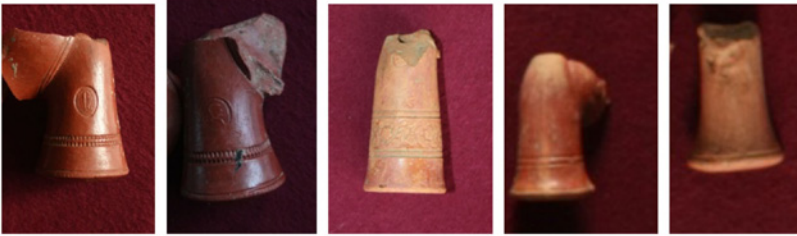
F. 14. DMR 2014-2 F. 15. DMR 2014-3 F. 16. DMR 2014-4 F. 17. DMR 2014-5 F. 18. DMR 2014-6