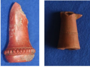
F. 40. DMR 2015-22 F. 41. DMR 2015-23