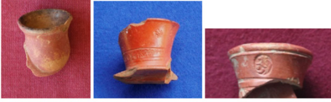
F. 3. DMR 2010-3 F. 9. DMR 2013-2 F. 13. DMR 2014-1