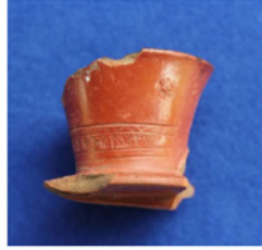
F.9. DMR 2013-2 "BABALIK"?