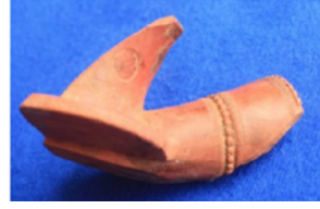
F. 25. DMR 2015-7 Okunamayan damga