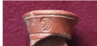
F. 13. DMR 2014-1 Okunamayan damga