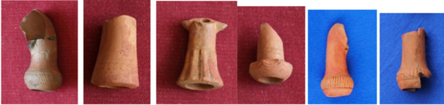
F. 4. DMR 2011-1 F. 5. DMR 2011-2 F. 6. DMR 2011-3 F. 7. DMR 2011-4 F. 11. DMR 2013-5 F. 12. DMR 2013-6