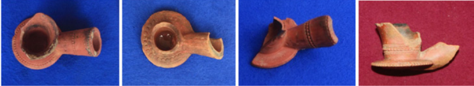
F. 23. DMR 2015-5