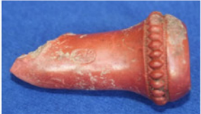
F. 40. DMR 2015-22 Okunamayan damga