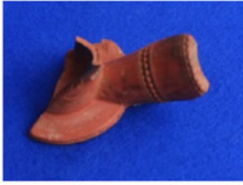
F. 25. DMR 2015-7 Okunamayan damga