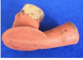
F. 23. DMR 2015-5 Okunamayan damga