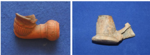
F. 31. DMR 2015-13