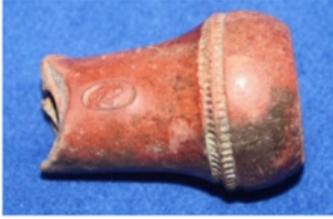
F. 39. DMR 2015-21 "HAMDİ"