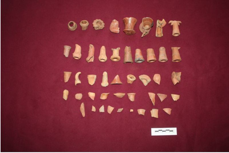
F. 44. Demirköy Fatih Dökümhanesi lüle parçası buluntularından örnekler.