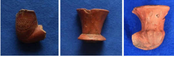
F. 33. DMR 2015-15 F. 34. DMR 2015-16 F. 35. DMR 2015-17