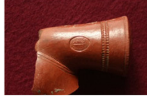
F. 14. DMR 2014-2 "DALGALI"