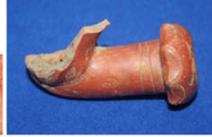
F. 30. DMR 2015-12 "ŞÜKRİ"