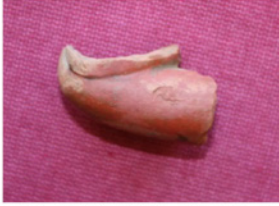
F. 2. DMR 2010-2 "BALABAN"?