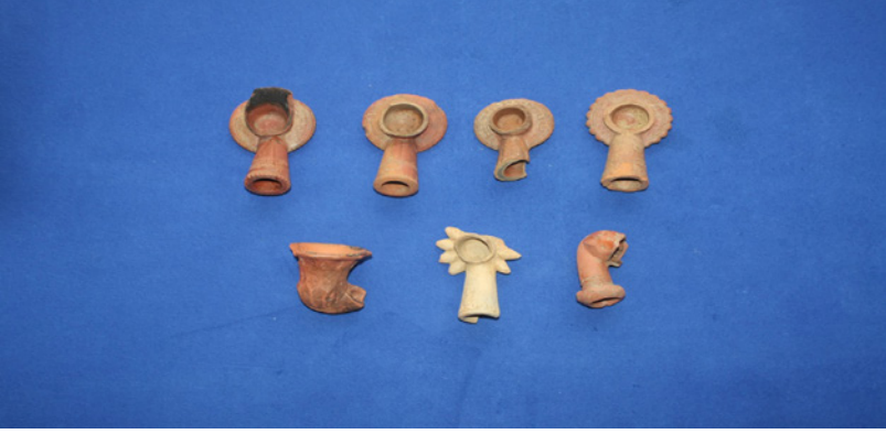
F. 43. Demirköy Fatih Dökümhanesi 2015 yılı buluntuları arasında altın yıldızlı lüle örnekleri.