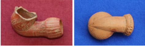
F. 1. DMR 2010-1