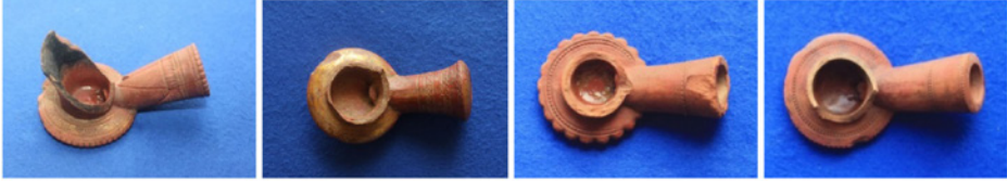
F. 19. DMR 2015-1