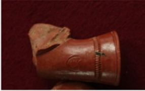
F. 15. DMR 2014-3 "YEKTA"