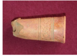
F. 16. DMR 2014-4 Okunamayan damga