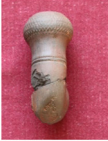
F. 4. DMR 2011-1 nolu lüledeki palmet motifi.