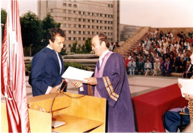
F.6- Doktora Diploma Töreni, 08 Temmuz 1983.

1980'de Çankırı Astsubay okulunda öğretim elemanı olarak askerlik hizmetini tamamladı. Hacettepe Üniversitesi Sosyal ve İdari Bilimler Fakültesi Sanat Tarihi Bölümü'nde 1983 yılında " Manisa'da Türk Devri Yapıları " konulu tezle "Doktor" ünvanını aldı.