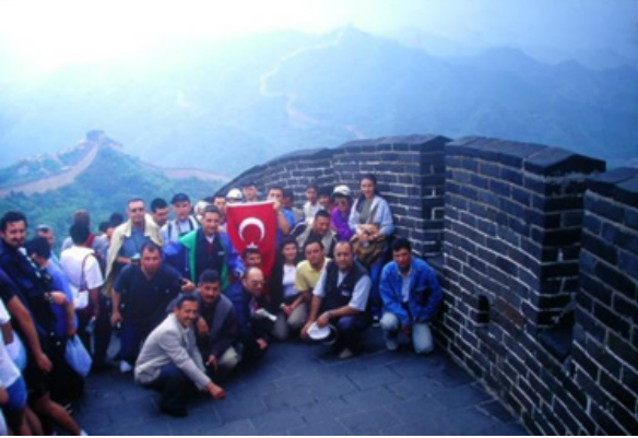
F. 9- Çin Seddi 2000.