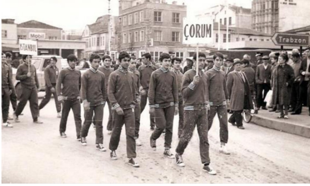
F. 3- Türkiye Basketbol Şampiyonası. Samsun, 1-4.4.1974.

Üniversite hayatına başladığı Hacettepe Üniversitesi, Sosyal ve İdari Bilimler Fakültesi, Sanat Tarihi Bölümü'nden 1975 – 1976 döneminde mezun oldu. Aynı bölümde 1976-1983 yıllarında araştırma görevlisi olarak çalıştı. Hacettepe Üniversitesi Sosyal ve İdari Bilimler Fakültesi Sanat Tarihi Bölümü'nde " Manisa'daki Saruhanoğulları Dönemi Eserleri " adlı Yüksek Lisans tezi ile bilim uzmanlığını aldı.