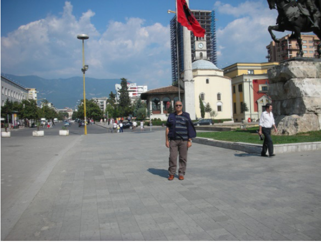
F.7- Arnavutluk Tiran.