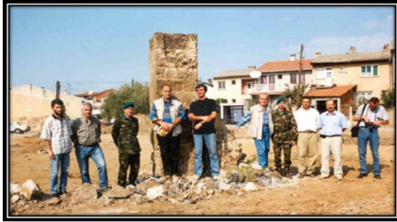
F.12- Prizren Namazgah Kazısı , 2003.