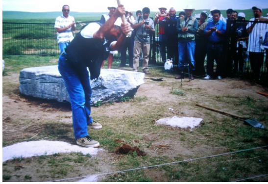
F.11- Moğolistan Türk Anıtları Kazısı 2000.

başkanlığı (2002), Kosova-Prizren Osmanlı Mezarlığı ve Üç Türbenin Düzenlenmesi Projesi başkanlığı (2004), Kosova, Priştine, Sultan I. Murat (Hüdavendigâr) Türbesi ve Külliyesi Projesi üyeliği (2005-2007), Makedonya-Üsküp Mustafa Paşa Camii Restorasyonu'nda proje danışmanlığı (2007-2011), Afganistan-Belh Şehrindeki Mevlana'nın Babası Bahaüddin Velet'in Medresesi ve Dedesi Hüseyin Hatibi'nin Türbesi Kazı Başkanlığı ve Restorasyon Danışmanlığı (2012-2013)'dir.