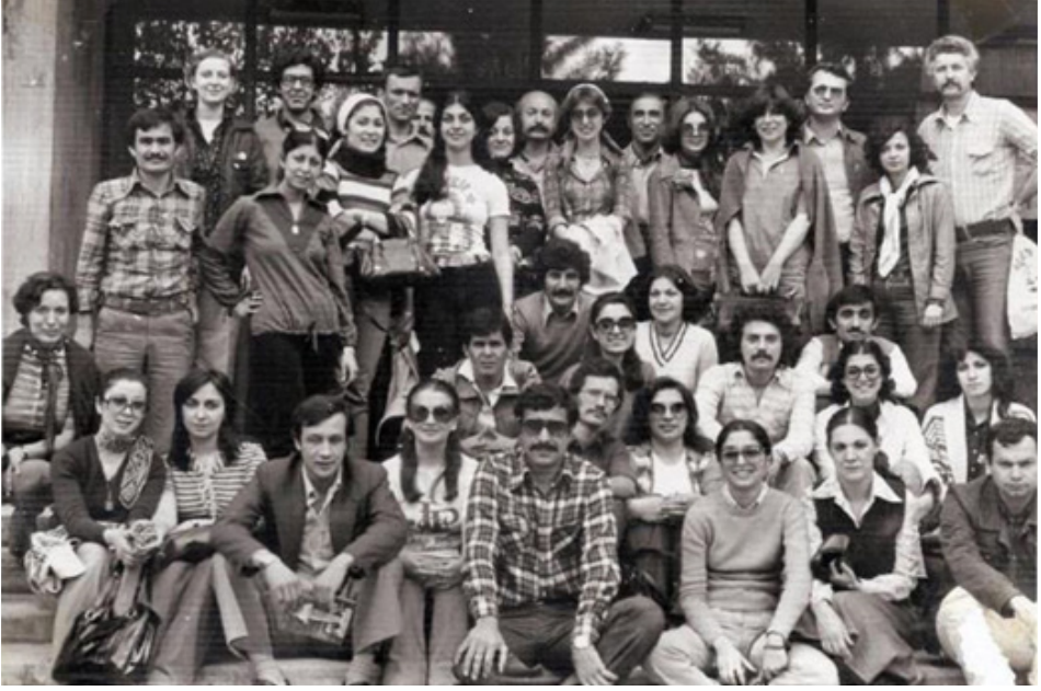
F.5- Hacettepe Üniversitesi Sanat Tarihi Bölümü hoca ve öğrencileri. Bölüm Gezisi, Selçuk Müzesi, 19 Nisan 1978.

1980'de Çankırı Astsubay okulunda öğretim elemanı olarak askerlik hizmetini tamamladı. Hacettepe Üniversitesi Sosyal ve İdari Bilimler Fakültesi Sanat Tarihi Bölümü'nde 1983 yılında " Manisa'da Türk Devri Yapıları " konulu tezle "Doktor" ünvanını aldı.