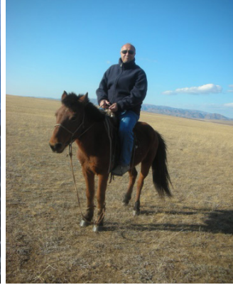
F. 10- Moğolistan 2007.