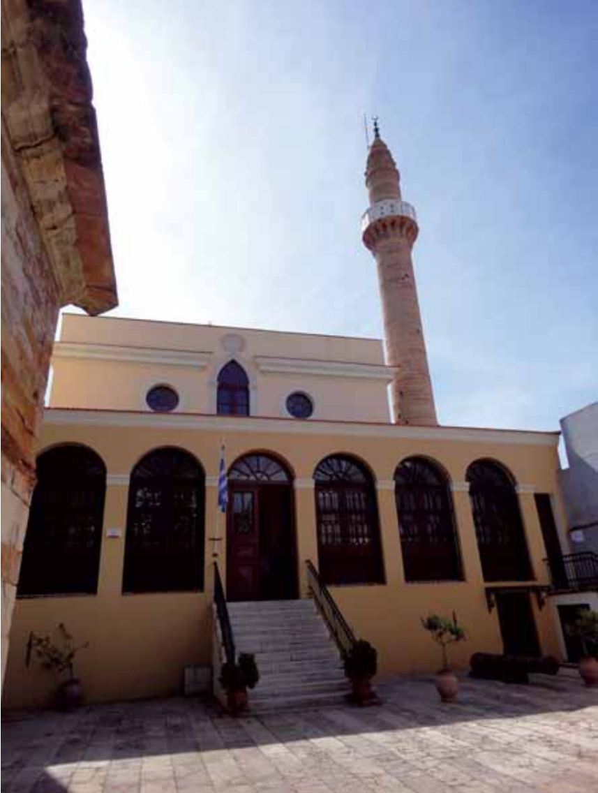
Resim 2: Sakız'daki Mecidiye Camii