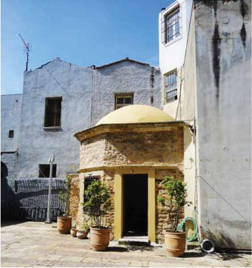
Resim 3: Sultan Abdülmecid Han VGMA, Defter No: 1419