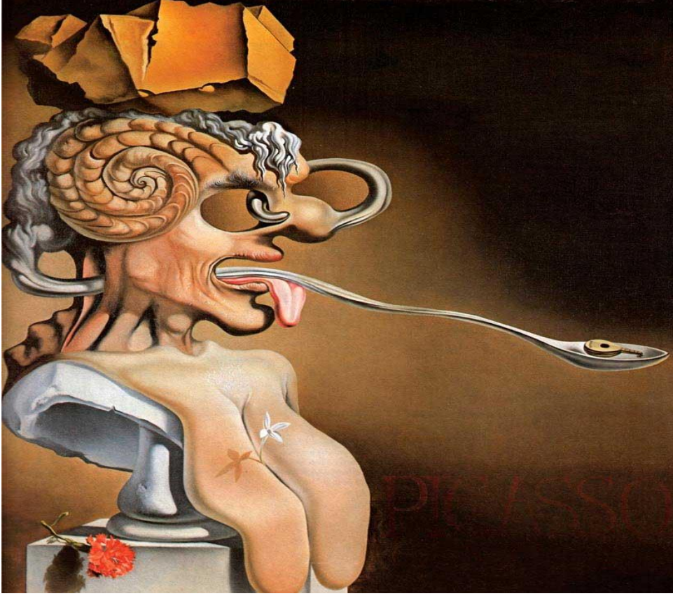
Görsel.2.Salvador Dalí "Picasso Portresi" Tarih: 1947/Orijinal Boyut: 64 x 54,7 cm./Yer:Teatro – MuseoDaliGironahttps://www.istanbulsanatevi.com/sanatcilar/soyadi-d/dali-salvador/salvador-dali-picasso-portresi-8237/

Pablo Picasso (25 Ekim 1881-Ö.8 Nisan 1973, Mougins, Fransa) Malaga'da, resim öğretmeni José Ruiz Blasco ile Maria Picasso'nun ilk çocuğu olarak dünyaya gelir. Kendinden sonra iki kız kardeşi dünyaya gelmiştir. Dünyaca ünlü olan soyadını annesinden almış ve baba mesleğine duyduğu büyük ilgiyle küçük yaşta resme başlamıştır. Picasso için söylenen iki şey vardır İspanyol olması ve dahi bir çocuk olmasıdır, bunu ömrünün sonuna dek sürdürmüştür. Konuşmayı öğrenmeden önce resim yaparken, on yaşındayken de alçı dökümlere bakarak resim çizebilmiş bu yönüyle sıradan bir resim öğretmeni kadar başarılı olmuştur. Babası taşralı bir resim öğretmenidir ve tüm resim malzemelerini on dört yaşına gelmeden Picasso'ya devretmiş bir daha da eline almayacağına yemin etmiştir. On dört yaşındayken Picasso Barselona Sanat Okulu'nun yüksek kısmına kabul edilmek için sınava girer ve normalde gerekli resimlerin tamamlanması için bir ay süre verilen öğrencilerden farklı olarak bir günde resimleri tamamlar ve teslim eder. On altı yaşındayken de Madrid Kraliyet Akademisi'ne onur öğrencisi olarak kabul edilir. Önünde artık hiçbir akademik sınav kalmamıştır. Görsel sanatların ölçüsüne göre Picasso olağanüstü bir dahi çocuktur.