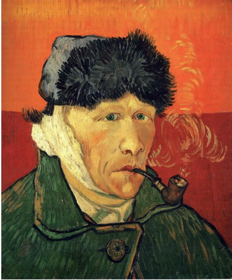
Görsel.1.Vincent Van Gogh “Otopotre” https://www.biyografi.info/kisi/vincent-van-gogh

yapıldı” ( https://www.biyografi.info/kisi/vincent-van-gogh ).Kısacık ömrüne yüzlerce sanat eserini sığdırmış aşk ve tutkuyla en çok sevdiği işi yapmıştır. Sürekli yoksulluk ve sağlıkla geçen yıllarında hep kardeşi Theo en yakın dostu ve kardeşi olmuştur. Maddi bakımdan ona bağlı yaşamıştır. Van Gogh Fransa’da bir akıl hastanesinde Saint-Remy’de hayata gözlerini yummuştur.