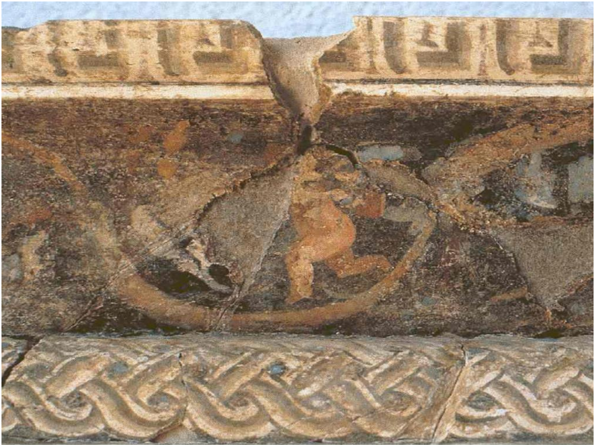
Resim 7: Meander, rankeler arasında eros, bitki motifleri ve giyoş motifi