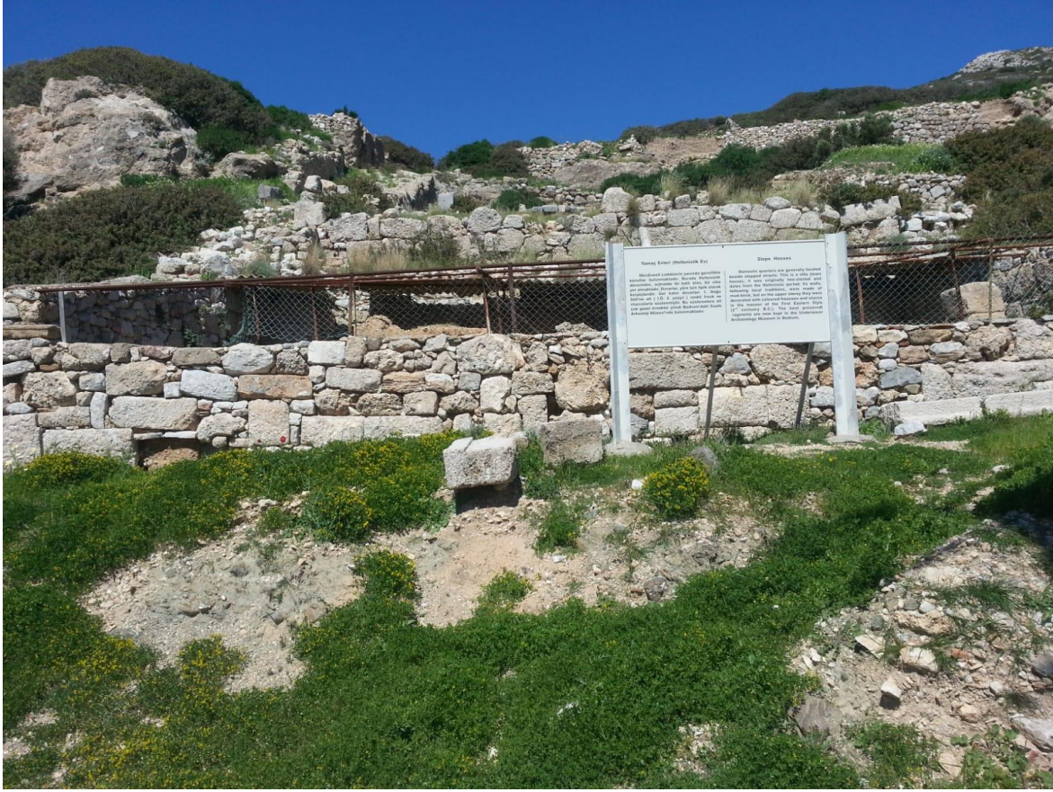
Resim 3: Knidos Hellenistik ev havadan görünümü (Günümüzde koruma çatısı altında)