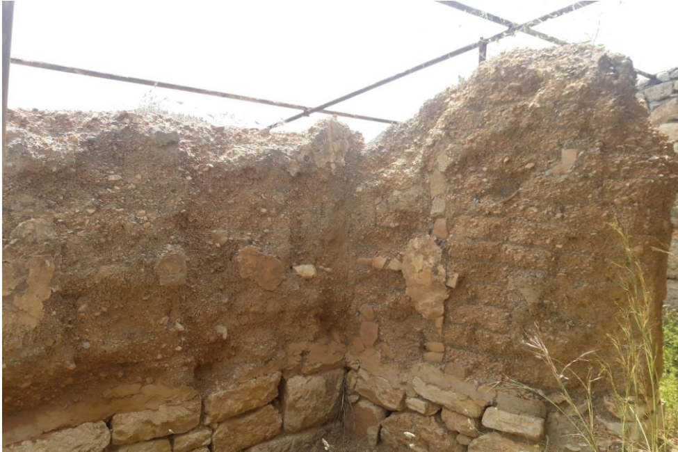
Resim 4: Hellenistik ev konglomere ve mermer temeller ve üstüne yükselmekte olan kerpiç duvarlar.