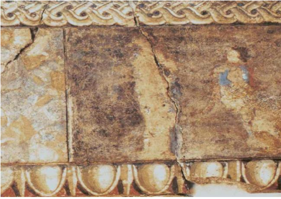
Resim 9: Mitolojik konun işlendiği figür bezemeli friz detay.