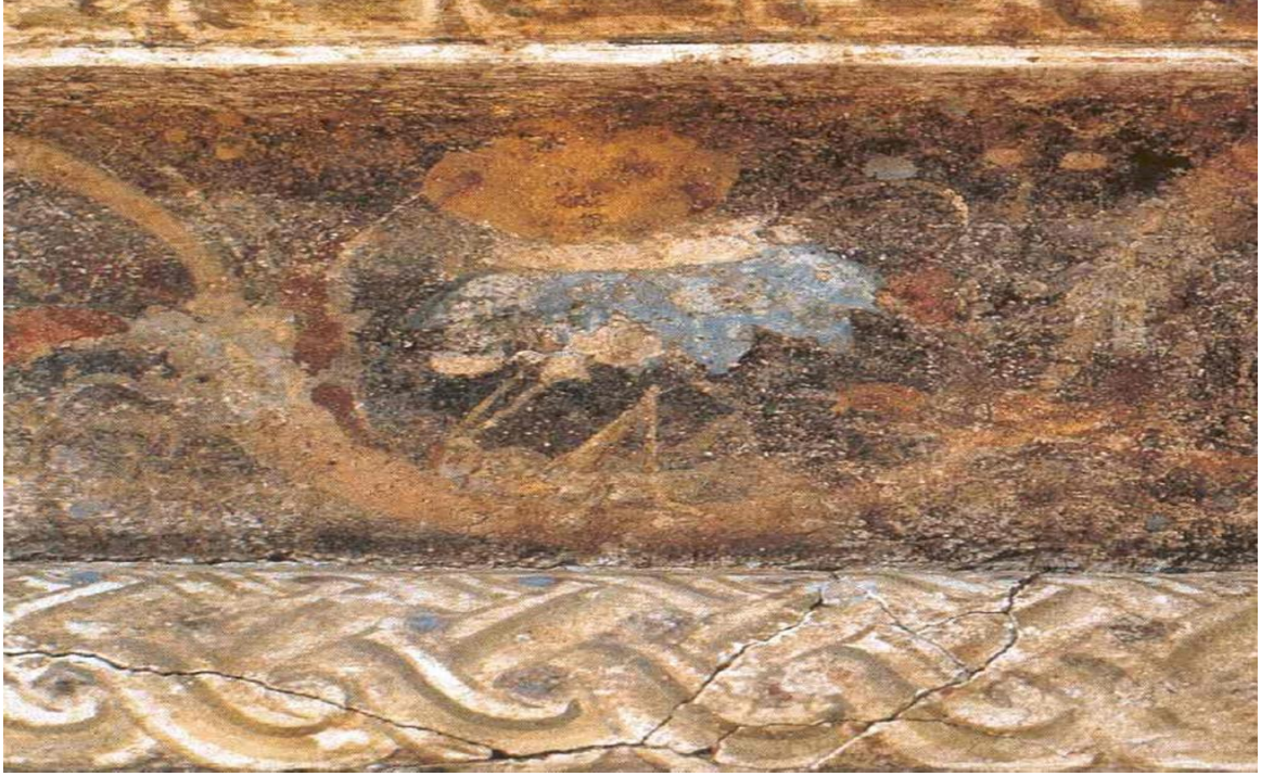
Resim 6: Meander, ters akantüs, çekirge ve örgü motifi