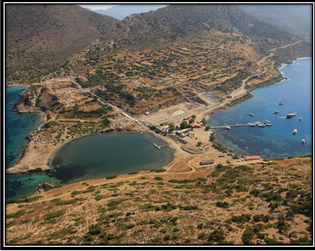
Resim 1: Knidos Antik Kenti havadan görünümü