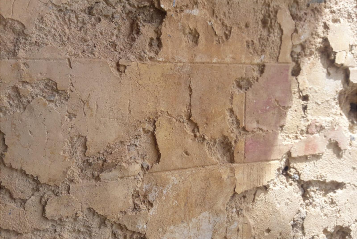
Resim 11:Boyama ve kazı olarak yapılmış duvar örgüsü taklidi.