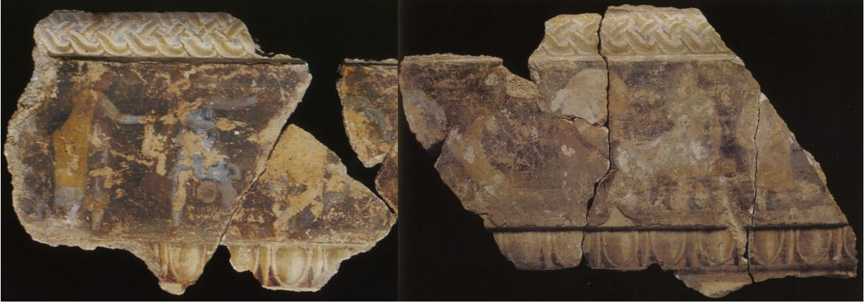
Resim 10: “Dans eden keçili kompozisyon” isimli figürlü bezeme frizi.