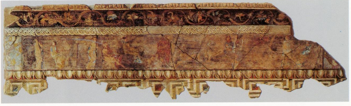
Resim 8: Mitolojik konun işlendiği figür bezemeli friz.