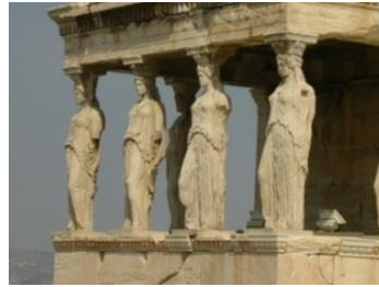
Şekil 3. Erekhtheion Tapınağı Karyatit Sütunları (Url-1)

Dinamik bir analiz-sentez içeren metaforik bağlantı simge ve analogiyle kurulur ve mimari eser metaforlarla iletişim aracı haline dönüşür. Bu bağlamda mimari eser için yeni bir kavramsal karşılık, yeni bir imgelem, metaforların oluşturduğu bu yeni dille sağlanır. Bu bir süsleme değil, gerçekliğin gücünü tasvirlerle yeniden ifade etme aracıdır. Bir başka deyişle mimarlık; kodlar taşıyan dil gibi bir iletişim aracıdır ve mimari üslubun çok anlamlılığı taşıdığı metaforlarla ilişkilidir. Mimari bir eserde kullanılan metafora örnek vermek istersek; Perslerle olan savaşlarında taraf olarak karşılarında duran Karyalılardan intikam almak isteyen Yunanlılar, erkekleri öldürmüşler kadınları ise esir almışlardır. Ardından bakire esirleri herkesin önünde küçük düşürmüşler ve halklarının hatasını bu tutsak kadınların onurlarıyla ödemişlerdir. Yunanlılar bununla da kalmayıp olayı mimari biçime taşımışlardır. Bugün dahi kullanılan Karyatit sütun yapı elemanı metafor olarak esaretin utancının ağır yükünü temsil eder (Şekil 3).