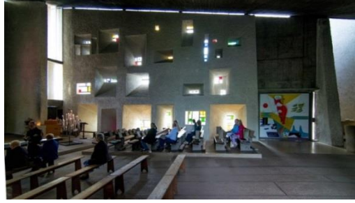
Şekil 8. Ronchamp Şapelinden İç Mekân Görüntüsü (Url-8)

Zen budizmde mekândaki boşluk ve an kavramı, sonsuzluk hissi yaratması bakımından çok önemlidir. Ando'nun Işık Kilisesinde (Şekil 7) oluşturduğu geometri, kullandığı haç biçiminde ışık yarıkları ve brüt betonda oluşan gölgelerle kilise içinde gizemli bir atmosfer yarattığı görülür. Haç simgesiyle içeri alınan ışık ve geride kalanın loşluğu mekânda hem anlamsal hem de fiziksel karşıtlık yaratarak ilahi gücün somut ifadelerini kurgulamıştır.