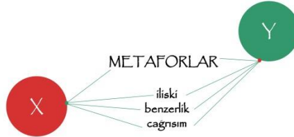
Şekil 2. Metaforla Sağlanan Dönüşümü Gösteren Tablo (Salan, 2018)

Yan anlamı oluşturan işlemlerden biri ' metafor ' dur. Metafor, bir olgunun başka bir olgu üzerinden dolaylı anlatılması, benzetme yoluyla kendi anlamının dışında yeni bir anlam kazanmasıdır. Aşağıda Şekil 2'de bir ifadenin (X); metaforla yeni bir ifadeye (Y) dönüşümü gösterilmiştir. Metafor yoluyla oluşan bu dönüşümde iki ifade arasındaki ilişki, ilişkiye bağlı benzeşim ve çağrışım gibi faktörler etkilidir.