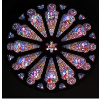
Şekil 5. On İki Havariyi Temsil Eden On İki Örüntünün Yer Aldığı Gül Pencere (Url-3)

Tanrı ve onun ışıkla gelen varlığı görünür hale gelmiştir. Bu yapılardan biri olan Saint Denis Manastır Kilisesi'nde bulunan belgelerde Tanrı en üst özsel ışık (ışıkların babası) olarak tasvir edilirken, İsa ilk aydınlanan olarak tanımlanmıştır. Bu ifadelerle mekânda maddi bir varlık olan fani ışığın; aşkın gücün, asıl ışık kaynağının bir mimesisi olduğu vurgulanmıştır.