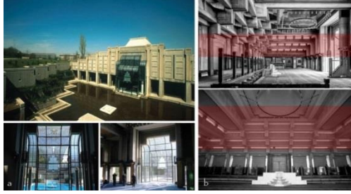
Şekil 9. TBMM Cami Dıştan ve İçten Görünümü a- (Url -9), b- (Url -10, Url-11) düzenlemiştir

Geleneksel camilerde, ilahi varlığı ve Müslümanların evrensel mesajını sembolize eden lambalarla çevrili mihrabın TBMM Caminde ışığı tamamen içeri alan şeffaf cepheyle çözümü gösterge olarak Tanrıyı ve onun nurunu kurgular. Mimarlar, cennet metaforu olarak betimlenen İslam bahçesi (gömülü arka bahçe) ile bu dünyayı simgeleyen ön avlu arasında ibadet mekânını konumlandırarak eşik mekân algısını yaratmışlardır. Mihrabın sol ve sağ yanında kalan ve göz hizasında tutulan şeffaf satılla da yatay hâkimiyet sağlanmış ve İslam'ın gözlerin gökyüzüne çevrilmemesi gerektiği düşüncesine gönderme yapılmıştır. Bu camiye ilişkin Al Asad'ın (2001) “Ön avlu portikolarının kesişme kısmından yukarı çıkan merdiven, Sufî temasının bir uzantısıdır. Merdiven belirli bir noktaya çıkmaz, fakat tersine ‘hiçbir yere’ götürür” ifadesi de camide kullanılan mimari öğelerdeki metaforlara örnek oluşturur.