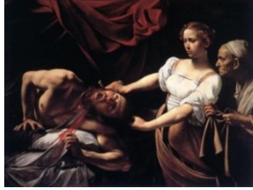
Şekil 4. Caravaggio’ nun Holofernes’in Başını Kesen Yudit Adlı Eseri (Url-2)

Tekil olarak herhangi bir fiziksel varlığı olmayan gölgeye, birçok kültürde insanlığın korkutucu ilkel yönü, bilinçdışının karanlık yüzü ve günah gibi göstergeler yüklenmiştir. Aşağıda yer alan tablo (Şekil 4) , Asurlular tarafından istilaya uğrayan İsrailoğullarından Yudit’in General Holofernes’e tuzak kurup, onu öldürmesini tasvir eder. Fondaki karanlık -koyu gölgeler ve figürlerdeki ışıkla Caravaggio, resimde üç metaforla üç karaktere işaret etmiştir: Erdem (halkını istiladan kurataran Yudit), cesaret (Yudit’in sağındaki Abra) ve günah (Yudit’in güzelliği ve hilesine kanan General Holofernes). Holofernes’in bedenindeki karanlık ve gölgeler suçu ile ölümü tasvir ederken, Yuhit’in yüzü, halkının intikamıyla aydınlanmıştır.