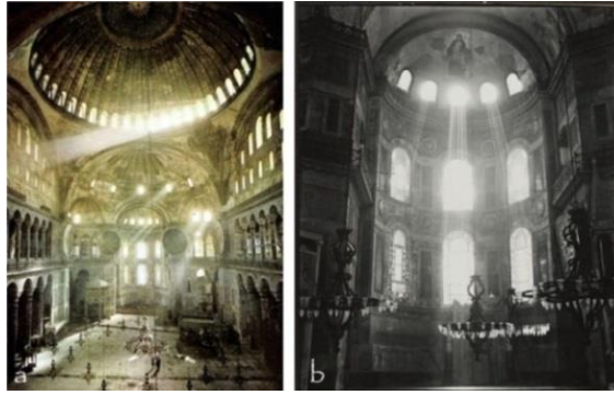
Şekil 6. Ayasofya İç Mekânından Kubbe Işıklarının ve Mistik Atmosferin Görüldüğü Açılış a- (Url-5) , b- (Url-6)

Anlam üreten ışıkla ilgili verebileceğimiz örneklerden biri Justinyen döneminde yapılmış Ayasofya'dır. Ayasofya (Kutsal Hikmet) için Roth (2000, s. 350-351) " Sayılsız pencereden içeri akan, mozaik kaplı yüksek kubbelerden yansıyan parlak ışıklarla [...] sayısız lamba ve mumun titrek ışıklarının oluşturduğu atmosferde erken Hristiyan ve Bizans liturjisi dindışı ve dinsel düzenin kaynaşmasını ve göksel olanı yeryüzünde yaratma çabasını kutlamıştır " demiştir.