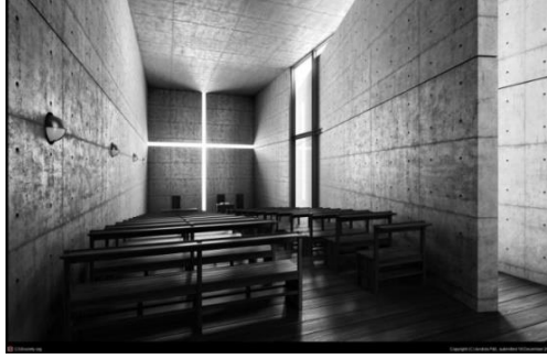
Şekil 7. Tadao Ando-Işık Kilisesi (Url -7)

Zen budizmde mekândaki boşluk ve an kavramı, sonsuzluk hissi yaratması bakımından çok önemlidir. Ando'nun Işık Kilisesinde (Şekil 7) oluşturduğu geometri, kullandığı haç biçiminde ışık yarıkları ve brüt betonda oluşan gölgelerle kilise içinde gizemli bir atmosfer yarattığı görülür. Haç simgesiyle içeri alınan ışık ve geride kalanın loşluğu mekânda hem anlamsal hem de fiziksel karşıtlık yaratarak ilahi gücün somut ifadelerini kurgulamıştır.