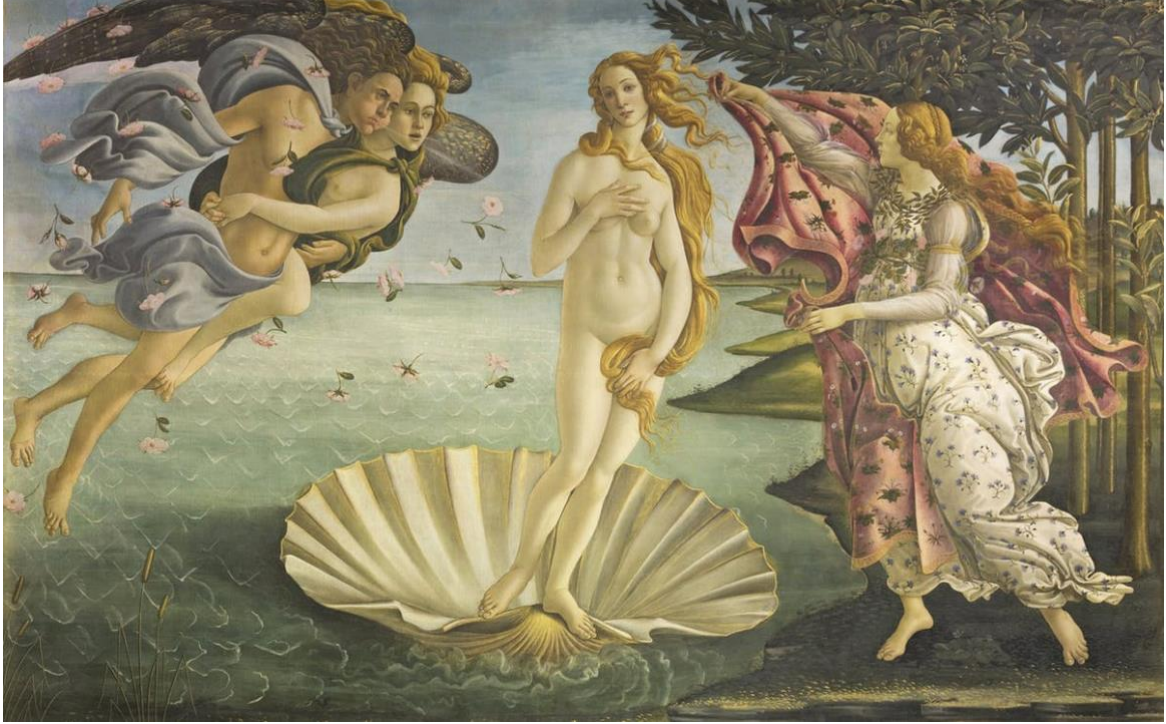
Görsel 4: Sandro Botticelli, Venus'ün Doğuşu , 1485, tuval üzerine tempera, 172.5 x 278.5 cm, Uffizi Galerisi, Floransa.

Tempera tekniđinin en bilinen örneklerinden biri; görsel 4'deki Botticelli'nin " Venus'ün Doğuşu " adlı tablosudur.