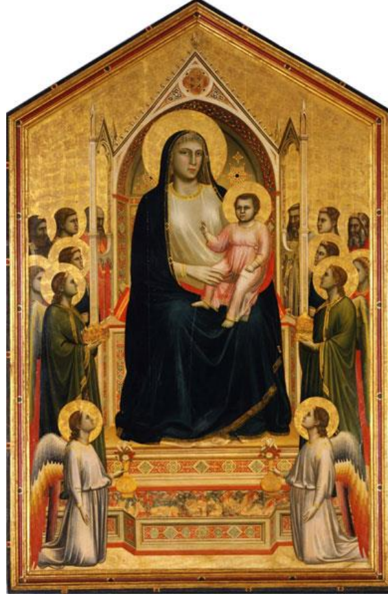
Görsel 3: Giotto di Bondone, Ognissanti Madonnası "Tahta çıkmış Meryem Ana ve Çocuğu", 1310, ahşap üzerine tempera, 325x204cm, Uffizi Galeri, Floransa.

Orta Çağ'da yapılmış olan triptikler, altar panoları vb. genellikle bu teknik uygulanmıştır. Orta Çağ'ın İtalyan sanatçılarından Cimabue, Duccio di Boninsegna, Giotto, Simone Martini, Lorenzetti Kardeşler söz konusu tekniği eserlerinde kullanmıştır.