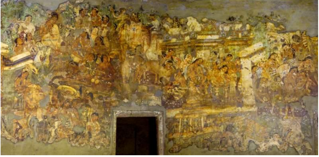
Görsel 2: Ajanta mağarası duvar resimleri, tempera tekniği, Maharashtra eyaleti, Hindistan.

Hindistan'da bulunan bazı mağaralardaki resimler incelendiğinde aynı etkiler görülmektedir.