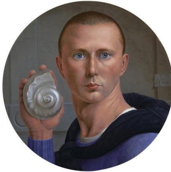
Görsel 6: George Tooker, Otoportre, 1947, panel üzerine tempera, 42cm, Curtis Galerileri, Minneapolis.

Amerikalı ressam George Tooker (1920-2011), sosyal realist tempera tabloları ile tanınan figüratif bir sanatçıdır. 1940'lı yıllarda tempera tekniğini kullanmaya başlayan Tooker, yarım asırdan fazla bu tekniğin temsilcisi olarak başarılı bir kariyer sürdürmüş ve paha biçilemez nitelikte eserler ortaya çıkarmıştır (Spring, 2002, s. 62).