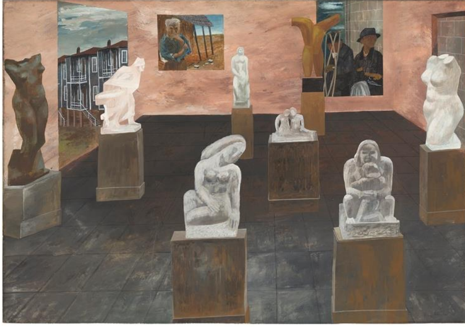
Görsel 5: Ben Shahn, Çağdaş Amerikan Heykeli, 1940, ahşap üzerine tempera, 268x76.2 cm.

Amerikalı ressam George Tooker (1920-2011), sosyal realist tempera tabloları ile tanınan figüratif bir sanatçıdır. 1940'lı yıllarda tempera tekniğini kullanmaya başlayan Tooker, yarım asırdan fazla bu tekniğin temsilcisi olarak başarılı bir kariyer sürdürmüş ve paha biçilemez nitelikte eserler ortaya çıkarmıştır (Spring, 2002, s. 62).