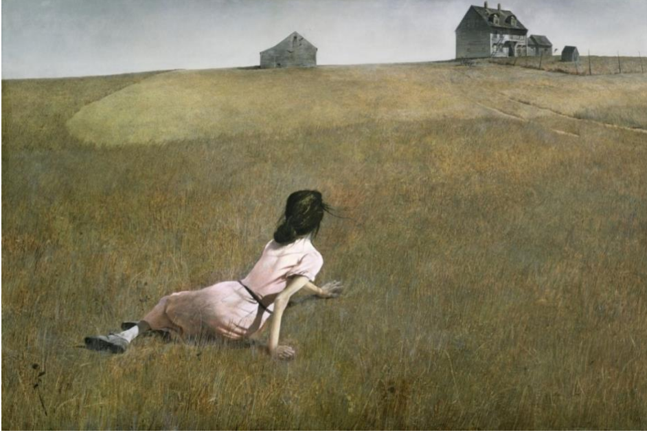
Görsel 7: Andrew Wyeth, Christina'nın Dünyası, 1948, ahşap panel üzerine tempera tekniği, 82x121 cm, Modern Sanat Müzesi, New York.