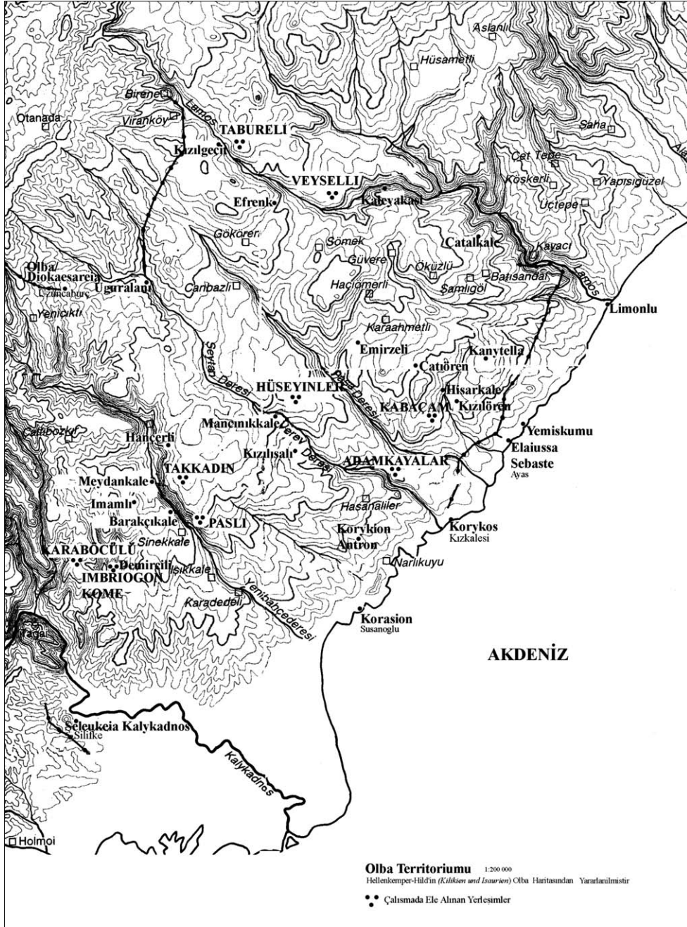
Res. 1 Olba Territoriumu Yerleşimleri