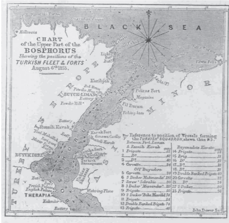
Resim 2: Osmanlı donanmasının İstanbul'un savunması için boğazın Karadeniz girişine konuşlanan gemilerini gösteren bir harita

Haziran'a kadar askeri tersanede yapılması planlanan 12 korvette ve birkaç firkateyn henüz hazır olmadığı gibi (Illustrated London News, 18 Haziran) 1853: 486) Rusya'nın üstün Karadeniz donanması karşısında bu donanma yeterli bir güvenlik sağlamıyordu. Üstelik Menşikov'un İstanbul misyonunun başarısız olması ve Osmanlı'yı Menşikov taleplerini kabul etmeye zorlamak isteyen Çar'ın Haziran ayı sonunda Osmanlı egemenliğindeki Tuna eyaletlerini işgal emrini vermesi İstanbul savunmasını daha acil hale getirdi. 10 Haziran tarihinde Boğaz'ın Karadeniz yakınlarında Rus donanmasının görüldüğü haberinin başkente ulaşması ise tedirginliği daha da artırdı.