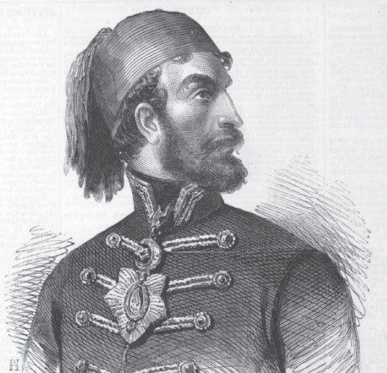
Resim 6: Tuna Ordusunun Komutanı Ömer Paşa

OMER PACHA, the Commander-in-chief of Turkish troops along the Danubian frontier, is an Austrian subject; being a native of Croatia. He was born in 1801, at Vinski, a village situate in the circle of Ogulini, thirteen leagues from Fiume. His family name is Lattas. His father was Lieutenant-Administrator of the circle; his uncle was a priest of the United Greek Church. Admitted, when very young, into the School of