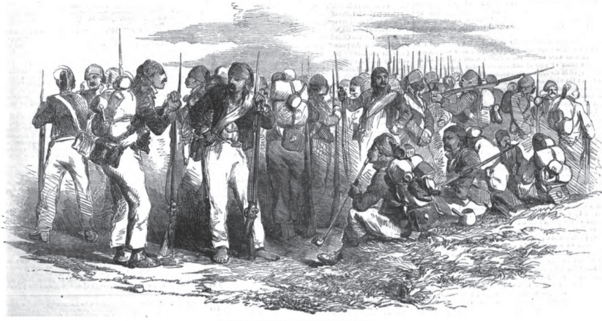
GROUP OF REDIF, OR TURKISH MILITARY RESERVE.

eyaletlerinde ve Basarabya'da konuşlanmış Rus kuvvetlerinin sayısı 110.000 piyade ve 25.000 süvariden (atlı asker) oluşurken, Osmanlı ordusunda 75.000 piyade 8.000 de süvari mevcuttu (Illustrated London News, 17 Eylül 1853: 223). Hazırlıklar ve Kuzey Afrika'dan gelen destekler sayesinde piyade sayısında kısmi bir denge sağlanmış olsa da, süvari sayısı üzerinden bir kıyaslama yapıldığında, asimetrik fark kapatılmamıştı.