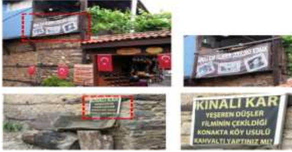
Şekil 5. "Kınalı Kar filminin çekildiği konak" ve "Kınalı Kar, Yeşeren Düşler filminin çekildiği konakta kahvaltı yaptınız mı?" yazıları ile filmin çekici unsur olarak kullanımı (Aktürk arşivi 2017)

Toplantısı'nda "kültürel" kategoride Dünya Miras Listesi'ne alınan "Bursa ve Cumalıkızık: Osmanlı İmparatorluğu'nun Doğuşu" Dünya Miras Alanı, Cumalıkızık köyünün de dahil olduğu altı bileşenden oluşmaktadır. Özgün kırsal mimarisi ile alternatif tatil arzulayanlar için kırsal ve kültür turizmi anlamında, Bursa'nın ve Türkiye'nin önemli köylerinden biri haline gelmiştir. Cumalıkızık'ın Dünya Miras Listesi'ne alınmasıyla turistik önemi daha da artmıştır.(Köşklük Kaya, 2016). Cumalıkızık'ın UNESCO Dünya Miras Listesi'ne girmesinin getirdiği turistik çekim dışında dizi filmlere dekor oluşturması da turizmin gelişmesinde önemli bir etkidir (Şekil 5).