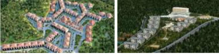
Şekil 4. İnşa edilen iki termal tesis (“Termal Tesis”, 2017)

Tesislerin kapasitesine bakılacak olursa sadece bir tanesi için 1.200 daire ve 300 otel odasından oluştuğu bilgisi verilmiştir. Toplam kapasite düşünüldüğünde Taraklı için oldukça yüksek bir sayıdır. Tesis reklamlarında “Tarihin sadece binalarda yaşamadığı, eski gelenek ve göreneklere günlük hayatta çok sık bir şekilde rastlanabilen Taraklı, Cittâslow’un 180 üyesinden biridir. Sayısız film, reklam filmi ve belgesele ev sahipliği yapan Taraklı; tarihi konakları, göletleri, yaylaları ve sakin yaşamıyla huzurun ikinci adresi... (“Taraklı Termal”, 2017) “ denilerek Taraklı ticari bir unsur olarak kullanılmıştır. Bu durumda bu tesislerin olumsuz etkileri ilçe merkezine yansımaması için ziyaretçi kontrolü politikaları geliştirilmelidir. Taraklı’ nın Yavaş Şehir olarak kendi döngüsüne devam ederken bu oranda bir ziyaretçi akınına uğraması geleceği için tehdit oluşturmaktadır.