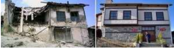
Şekil 3. Taraklı'da bir konut restorasyonu ("Taraklı restorasyonu", 2017)

Tüm bu çalışmalar Taraklı'nın kimliğini kaybetmemesi, otantikliğini korumaya devam etmesi için önemli adımlardır. Yapıların aslına uygun şekilde restore edilmesi ve kullanıma açılması yok olmayı ve yeniden canlandırıldıktan sonra ise köhnemeyi önlemek için değerlidirler. Ciltâslow'un tanımında bahsedilen doğallık, tarihi çevreyi korumanın yanı sıra yerel mutfak öğeleri, gelenek ve görenekler, yerel el sanatlarının teşviki gibi kavramlar da otantikliğin korunmasına katkıda bulunur.