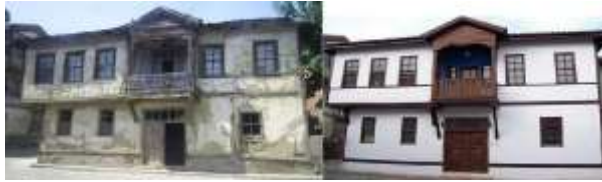
Şekil 2. Abdi İbrahim Konağı restorasyonu ("Abdi İbrahim Konağı", 2017)

arttırılması, tarımda GDO kullanımının yasaklanması, yerel ürünlerin sertifikalandırılması, kültür müzeleri kurulması gibi tarımsal, turistik, esnaf ve sanatkârlara dair politikalar da geliştirmeye çalışmıştır (Değirmenci ve Sarıbiyık, 2015). Kentin ziyaretçileri için görevlendirilen kişilere buna yönelik eğitimlerin sunulduğu ve yönlendirmeye dair levha yerleşimi ve tanıtım ofislerinin kurulmasına yönelik çalışmalar da yapılmıştır.