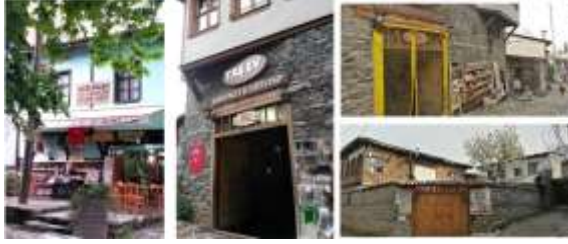
Şekil 6. Cumalıkızık'ta yemek içme mekânna çevrilmiş konutlardan bazıları

Köyde yaygın olan bir diğer sektör ise meydanlarda ve sokaklarda tezgâh üzerlerinde ya da konutların cephelerine asılarak yapılan hediyelik eşya satıcılığıdır. Bu tezgâhlarda köye ait yerel ürünlerin yerine daha çok Çin malı eşyaların satılıyor olması büyük bir eksiklik. Yöresel ürünlerin bu alanda daha az olması otantiklik bağlamında düşünüldüğünde hediyelik eşya satıcılığında kolay yönden ticari gelir tercih edilmiş ve üretim eksik kalmıştır.