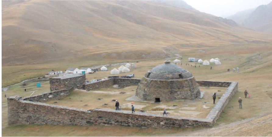
Resim 3: Modern çağın seyyahları Taş Rabat'ı ziyaretlerinde buradaki boz üyelerde konaklarlar

Hayatlarını hayvancılıkla geçiren bu aileler, at, inek, koyun ve topoz olarak bilinen dağ öküzleri bakarlar. Bu hayvanlardan bir kısmını ilkbahar ve sonbaharda At Başı kasabasındaki pazara getirerek satarlar ve böylece geçimlerini sağlarlar. Taş Rabat'ta yaşayan aileler için ilkbaharda bir telâşe başlar. İhtiyaçlarını karşılayacak kadar hayvanı sattıktan sonra diğer hayvanlarla birlikte bu küçük vadinin etrafındaki yüksek dağlara doğru göçe başlarlar. Bu göç Taş Rabat'ın doğusunda bulunan Çatır Göl'e kadar uzanır. Dağların tepesine doğru kademe kademe yapılan göçün ilerleyişini hava şartları belirler. Yüksek dağların üst kısımlarındaki geniş otlaklarda yazı geçiren hayvanlar, havaların soğuması ile birlikte tekrar kademe kademe Taş Rabat'ın olduğu küçük vadiye dönerler. Vadideki insanların bu hayat tarzı bir yandan da bölgede yüzyıllarca bu şekilde yaşamış olan konargöçerlerin sosyo-kültürel ve ekonomik hayatlarını, gelişimlerini anlamak için önemli bir gözlem alanıdır.