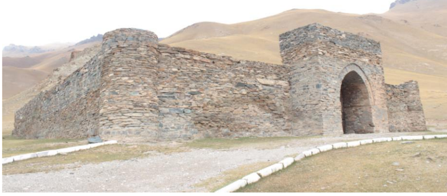
Resim 1: Taş Rabat