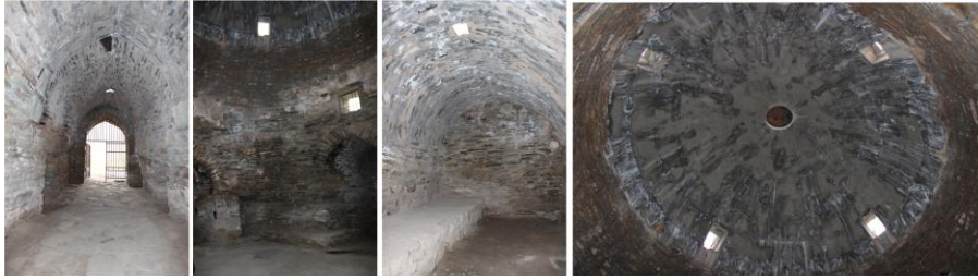
Resim 2: Taş Rabat'ın giriş koridoru, merkez salon, girişin solundaki büyük oda ve merkez salonun kubbesinin içten görünümü

Taş Rabat'ın arkeolojik kazılar sonucunda elde edilen planları arasında küçük farklılıklar mevcuttur. Peregudova, 9 numaralı odadan 14 numaralı bölüme geçiş ile 13 numaralı oda ve 17 numaralı salon arasını kapalı gösterirken, Pantusov 9 numaralı oda ile 14 numaralı bölüm arasını kapalı, 13 numaralı odayı da ileri doğru uzatarak iki oda halinde göstermektedir (krş. Plan 1 ve Plan 2). Bu farklılıkların binanın 1981-1982 yıllarında yapılan restorasyon sürecindeki çalışmalardan kaynaklanmış olabileceği düşünülebilir.