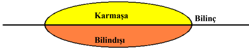
Şekil 2. Karmaşa: Kısmen bilinçdışı düzenlenen gruplar ya da temsilciler ve güçlü duyuşsal değerlerle anılar.