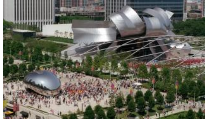
Şekil 4: Millennium Park'tan görünüm

Millennium Park'ı çevreleyen bölge, Chicago'daki en rağbet gören bölgelerden biri olmuştur. Forbes dergisi 2006 yılında parkın 60602 numaralı posta kodunu ülkedeki fiyat bakımından en sıcak bölge ilan etmiştir. Yine dergiye göre 2005 yılındaki 710.000 $'lık konut fiyatları ile ülkedeki en pahalı posta kodu bölgelerinden biri olmuştur. Parkın açılması ile birlikte bölgede konut fiyatları metrekare başına 1076 $'lık artış göstermiştir (Sharoff, 2006).