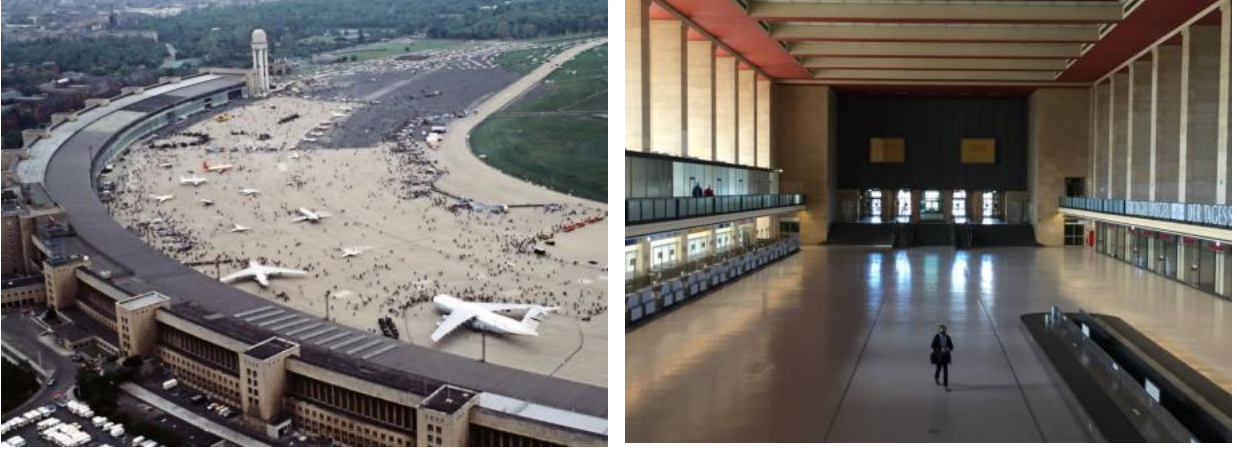
Şekil 5: Berlin Tempelhof Havalimanı'ndan görünüm

Resmi olarak 1923 yılında havaalanı olarak kullanılmaya başlanan Tempelhof Havaalanı, 1926 yılında kurulan Lufthansa Hava Yolları'na ev sahipliği yapmıştır. Eski terminal binası 1927 yılında yapılmıştır. Daha sonra Nazilerin kentin yönetimini ele geçirmesiyle birlikte, Adolf Hitler'in Berlin'i dünya başkenti "Germania" yapma hayalleri doğrultusunda 1934 yılında terminal binasının yenilenmesi emri verilmiştir. 1936 ve 1941 yılları arasında inşa edilen terminal binası 1,2 km'lik bir cepheye sahiptir ve İngiliz mimar Sir Norman Foster tarafından "tüm havaalanlarının anası" olarak nitelendirilmiştir. Hangarlar ile birlikte terminal 300.000 m 2 'lik bir alan kaplamaktadır.