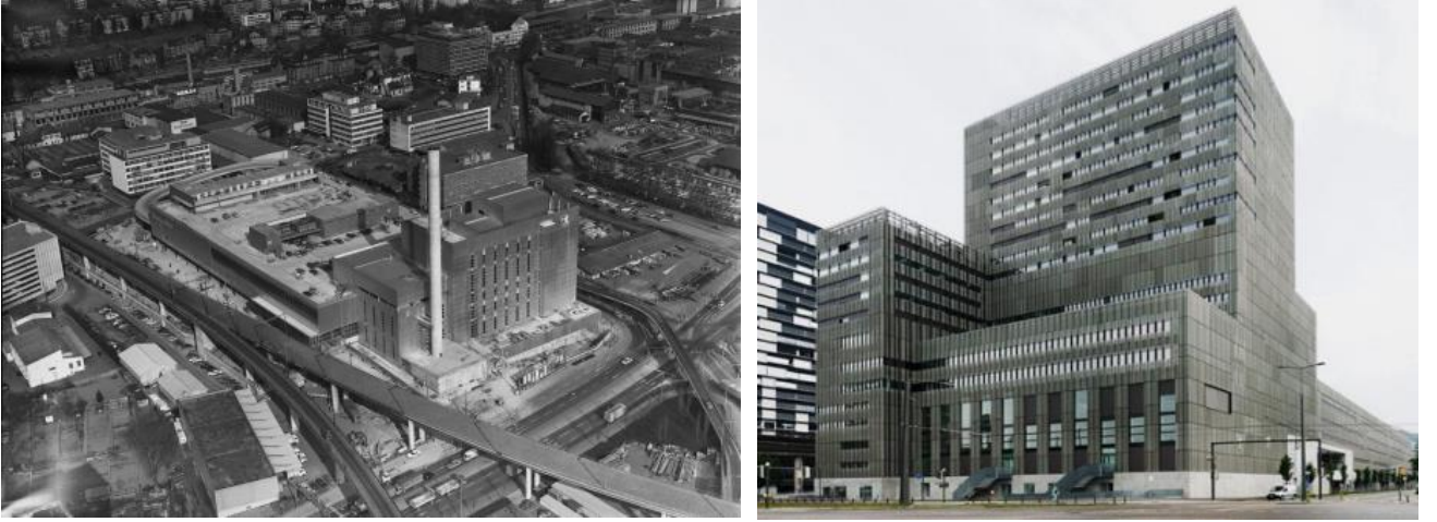
řekil 1: Toni St İřleme Binası 1976 (sol) ve gnmzdeki grnm (sađ)

Farklı lkelerdeki farklı kentler, terkedilmiř alanlarla kendi zel durumlarına gre ilgilenmektedir. İsvire’de, kent plancıları kenti iinde geliřtirmeye odaklanmıřtır. Buna gre geliřim iin daha fazla alan kente katılmayacak, bylece dođa korunacaktır. Kentler, mevcut kentsel meknda alan aramaya ve boř alan veya binalara odaklanmaya zorlanmaktadır. Burada kentler iin iki seenek bulunmaktadır: ok eski veya ok kk binaların yıkılması ya da yeni bir kullanım kazandırılması (dnřtrme). Bu eylemler maliyet etkin yntemlerdir, ancak meknların tarihini ya da kimliđini kaybetmesi riskini barındırmaktadır. Bařarılı bir dnřtrme rneđi olarak Zrih’teki eski Toni St İřleme Binası’nın eđitim, kltr ve konut alanına dnřtrlmesi verilebilir.