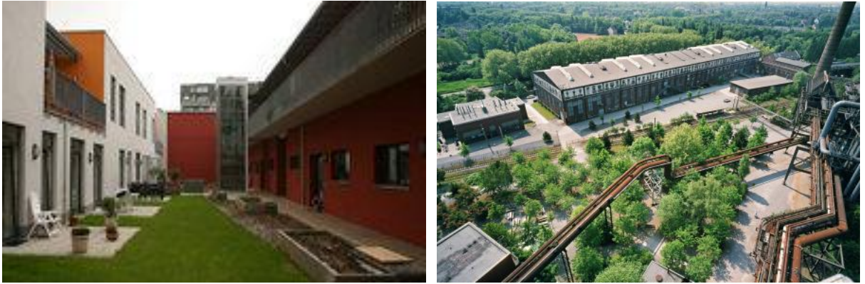
řekil 2: Widra Areal Aachen (sol) ve Duisburg peyzaj parkı (sađ)

Almanya, eski sanayi alanlarının yıkılmadan ve miraslarını kaybetmeden yeniden kullanımı aısından iyi rneklere sahiptir. Yerli halkın alıřma hayatının kmr madenciliđine sabitlendiđi Ruhr blgesi, lkenin 200 yıldan fazla bir sre boyunca sanayi merkezi olmuřtur. Sanayiler blgeden ekilip fabrikalar kapandıđında, birok fabrika binası koruma altına alınmıřtır. Bu hukuki iřlemler, blgenin kltrel mirasının ve geleneksel grnmnn korunmasında byk rol oynamıřtır. Bu arada birok sanayi yapısı kltrel merkez ya da konut olarak kullanılmıřtır. Aachen’daki Widra Areal, konut alanına dnřtrlen pek ok fabrikadan biridir. Duisburg’daki eski sanayi blgesi ise peyzaj parkına dnřtrlmřtir.