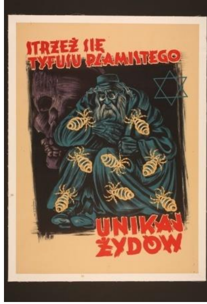
Tablo 2. "Hastalık" Konulu Propaganda Posterini