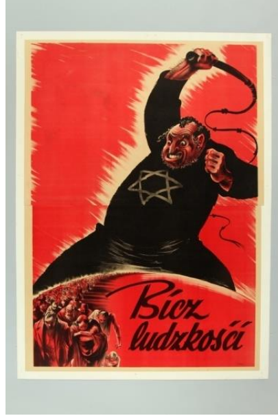
Resim 1. "Kırbaç" Konulu Propaganda Posterleri

Propaganda posterleri yananlam boyutunda incelendiğinde, posterde Yahudilerin insanlığı sömürdüğüne ve zulmettiğine vurgu yapılmaktadır. Görsel kodlar içerisinde insanların yer kürenin üzerinde bulunması, Yahudiler dışındaki tüm insanlığın zulme uğradığı mesajının oluşmasına neden olmaktadır. Bu açıdan posterde yer alan insanlar dünya halkının, kırbaçlayan Yahudi ise tüm insanlığın metonimi olarak posterde yer almıştır. Posterde Yahudiliği doğrudan simgeleyen ise altıgen yıldız olmaktadır. Sunum kodlarında insanların üzgün ve bitkin olarak yansıtılması, insanlığın sözde Yahudilerin baskılarından kurtulmak istediğinin bir yansıması olarak aktarılmaktadır. Buna karşın yine sunum kodlarında Yahudi'nin sinirli yansıtılması ile de Yahudilere yönelik korkutucu bir algının oluşması amaçlanmaktadır. Bu açıdan posterde yer alan Yahudi, zulüm metaforu olarak kitlelere aktarılmaktadır. Posterde yer alan "İnsanlığın Belası" şeklindeki yazılı kod ile doğrudan Yahudilere yönelik bir nefret söylemi inşa edilmeye çalışılmıştır. Posterdeki gerek görsel gerekse yazılı kodlar bir bütün olarak okunduğunda da,