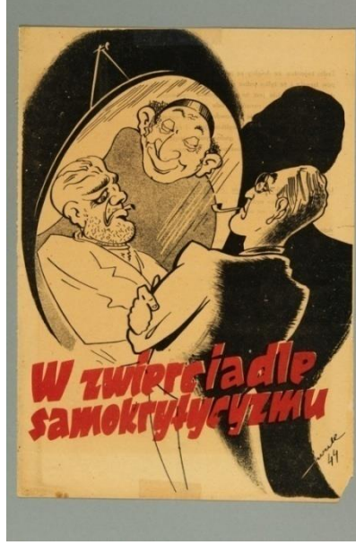
Resim 4. "Tehdit" Konulu Propaganda Posterleri

Poster yananlam açısından ele alındığında, posterde Yahudilerin dünyayı yönetenler üzerinde kimi zaman tahakküm kurarak halka zulmettikleri mitinin inşa edilmeye çalışıldığı görülmektedir. Posterde yer alan Yahudi görseli ABD'de yaşayan tüm Yahudilerin, ABD lideri ise Nazi Almanyası'na karşı mücadele veren tüm siyasi liderlerin metonimi olarak kullanılmaktadır. Bu aşamada ABD Başkanı Roosevelt'in görseline yer verilerek, ABD yönetiminin de Yahudilerin nüfuzu altına girdiği iddia edilmiştir. Böylece posterde Yahudi görseli, tehdit metaforu olarak kullanılmıştır. Roosevelt'in görünüşte Nazi Almanyası ile savaşması demokrasi ve insan hakları için değil doğrudan Yahudiliğe hizmet için olduğu aktarılmıştır. Görsel kodlarda Roosevelt'in kararlı dış görünüşünün altında tamamen Yahudilerin söylemleri altında hareket eden bitkin biri olduğu yansıtılmıştır. Bu şekilde Nazi Almanyası'nın onlarca ülke ile aynı anda savaşmasının Yahudiler tarafından düzenlenen kargaşa ortamının bir sonucu olarak ortaya konulması amaçlanmıştır. Naziler, posterde Polonya kamuoyunda Müttefik Devletleri'ne karşı vermiş oldukları mücadelenin meşruluk kazanmasını amaçlamış, aynı zamanda Yahudilerin dünya milletleri için ne kadar tehlikeli olabileceği aktarılmaya çalışılmıştır. Naziler böylece kendileri üzerinde oluşan