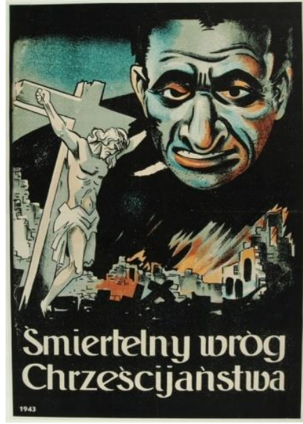
Resim 3. "Düşman" Konulu Propaganda Posterleri

Poster yananlam boyutunda analiz edildiğinde, posterde Nazi propagandası tarafından Musevilik dininin doğrudan Hristiyanlık dininin en büyük düşmanı olarak yansıtıldığı görülmektedir. Posterde yer alan sözde Hz. İsa temsili, Hristiyanlık dinini temsil etmektedir. Yıkılan şehir görseli, sözde Yahudiler nedeniyle zarar gören Hristiyan yerleşim yerlerinin metonimi olarak kullanılmaktadır. Görsel kodlar içerisinde sözde Hz. İsa temsilinin yıkıntılar içerisinde bulunması ve Yahudi görselinin gözleri ile sözde Hz. İsa temsilini izlemesi ile Hristiyanlığın başına gelen tüm felaketlerden Yahudiler sorumlu tutulmaya çalışılmıştır. Diğer yandan Yahudi görseli, korku metaforu olarak kullanılmaktadır. Posterde görsel ve yazılı kodlar birlikte ele alındığında Nazilerin, "Musevilik dinine mensup insanlar Hristiyanlık dininin baş düşmanıdır" şeklindeki miti Polonya kamuoyunda inşa etmeye çalıştığı ortaya çıkmaktadır. Böylece Hristiyanlık ve Musevilik dini arasında geçmiş dönemlerde yaşanan düşmanlıklar tekrar hatırlatılarak, Polonya halkında Yahudilere yönelik nefret duygusu oluşturulmaya çalışılmaktadır. Bu şekilde Polonya halkının Yahudilerden nefret etmesi ve Alman yetkiler ile iş birliği içine girmesi amaçlanmaktadır.