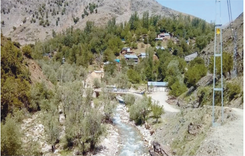
Ek 6. Yatağansögüt köyü (Fatrakum) ve Yatağansögüt Çayı