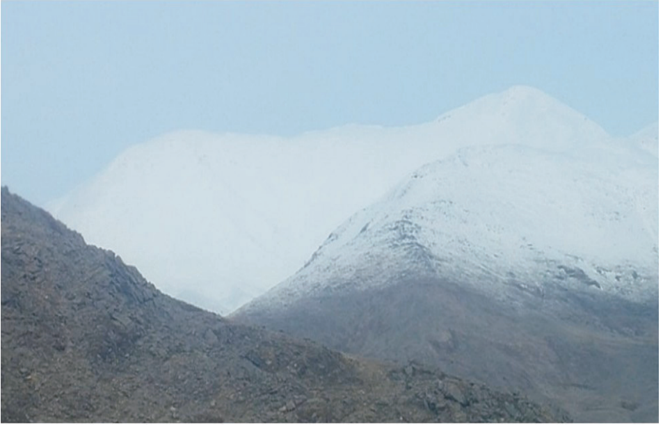
Ek 5. Akdağ'dan görünüm