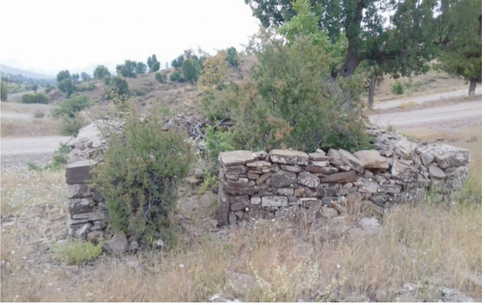
Ek 9. Celaleddin Ziyareti