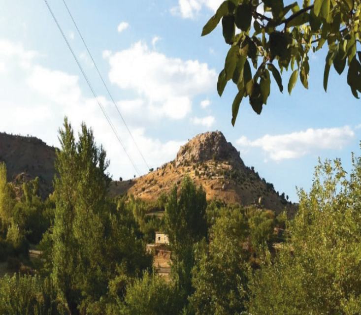
Ek1. Deve Dızd Yerleşim Yeri