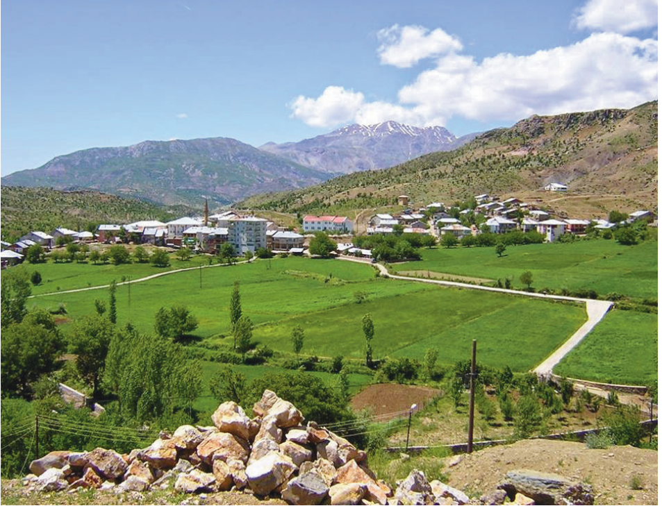
Ek 10. Servi Köyü