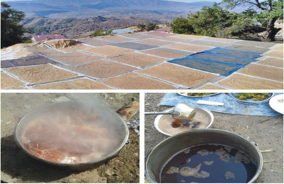
Ek 7. Bölgede Pekmez ve Pestil Yapımı