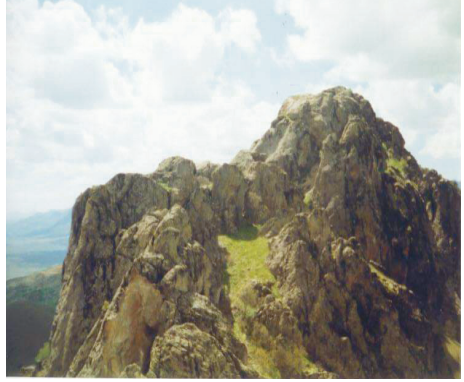
Ek 3. Kaledibi Köyü Kalesi