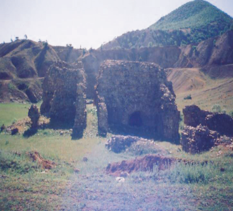
Ek 2. Gözertepe Kalıntıları