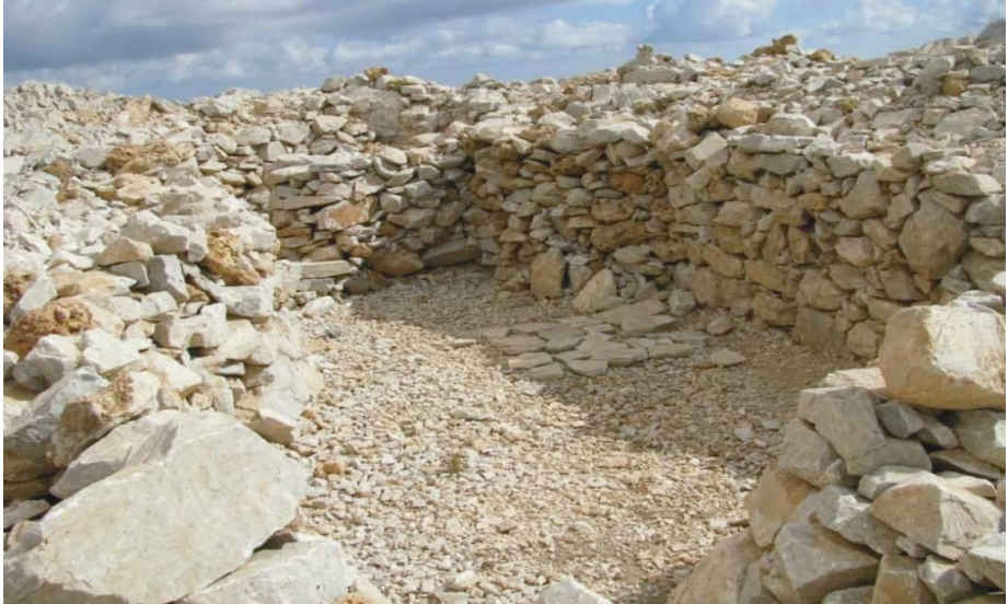
Ek 4. Sirma Tepe'de (Ko Şarık) Camii Kalıntısı