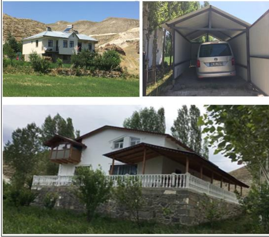
Fotoęraf 6. Yaz aylarında yreye gelen eski yre sakinlerine ait evler ve eklentileri.

zellikle eski kyn sıkıntılarla dolu yol gzerghının deęiřimi iin yapılan giriřimlere bazı ky sakinlerinin istimlak alıřmaları iin gerekli desteęi vermemesi, dięer ky sakinlerinin de daha istekli bir Őekilde yer deęiřirme faaliyetine katılımını hızlandırmıřtır. Kyn yerinin deęiřtirilmesine belli bir hukuki stat kazandırmak ve iniři hızlandırmak iin bazı ky evlerindeki hasarların toprak kaymalarından kaynaklandığı gibi Őikyetler yapılmıř, yeni ky konutlarının aynı yerde deęil Őimdiki yerde kurulması iin giriřimlerde bulunulmuřtur. Bu giriřim abaları yerleřmenin yerinin deęiřtirilmesindeki ikinci ařamayı oluřturmuřtur. Bu ařamada eski yerleřme alanında kalan dięer yre sakinlerinin taleplerini dikkate alan blge yneticileri, kyn yerinin deęiřimindeki kamusal faydaları da gz nnde bulundurarak, Tařbařı Mahallesi'nin Erzurum-Artvin Karayolunun (D 950) getięi alanda kurulmasına karar vermiřlerdir. Hak sahiplerinin tespit edilmesi srecinden sonra Milli Emlak'a ait araziler belli bir bedel karřılıęında ky sakinleri tarafından alınmak ve ky tzel kiřilięine ait araziler tahsis edilmek suretiyle yeni meskenlerin yapılacaęı sahalar hazırlanmıřtır.