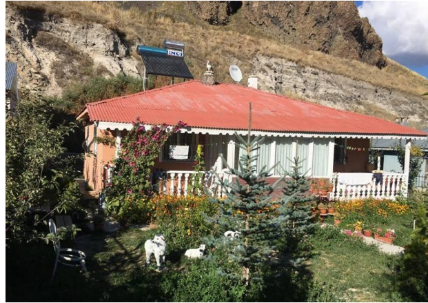
Fotoęraf 14. Modern evre dzenlemesine sahip olan yeni konutlardan bir rnek.