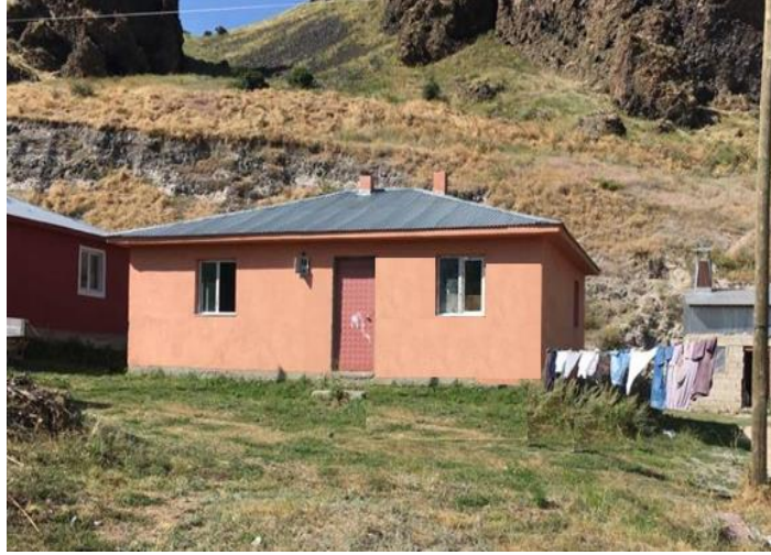
Fotoęraf 12. 2015 yılında yapımı tamamlanıp hak sahiplerine daęıtımı yapılan modern konutlar.

Yer deęiřtirmenin en byk ařaması olan ikinci ařamada yre sakinleri tarafından toplu konut alanında 2013 yılında yapımına bařlanan evler 2015 yılında hak sahiplerine teslim edilmiřtir. Tek katlı olarak 80 m 2 byklğnde yapılan evler 450 m 2 'lik parselleri ierisinde modern bir mesken rneęi gstermektedir(Fotoęraf 12). Fakat kullanım alanı kk kalan evlerin hemen yakınında veya arkasında kısa sre ierisinde depo, kiler, odunluk, garaj ve tandır gibi eklentiler yapılmaya bařlanmıřtır. Buna benzer durum lkemiz genelinde kırsal yerleřmelerde yapılan yeni konutların etrafında sıklıkla grlmektedir(Fotoęraf 13). Yer deęiřtirmenin, dolayısıyla konut yapımının devlet eliyle gerekleřtirildięi alanlarda, bu tr geleneksel mimariden uzaklařma ve konut-kltr uyumsuzluęı (Gk, Yazar, 2011, s.85 ; Orhan, Gk, 2015, s.163) sıklıkla rastlanan bir durum olmakla birlikte, zamanla ky sakinleri tarafından bazı deęiřikliklerin yapılması gibi kaınılmaz zorunluluklar da yařanmaktadır.