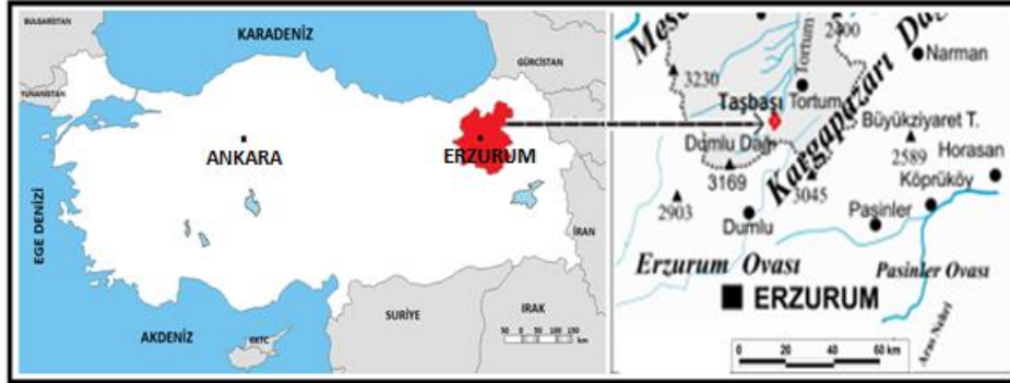
Şekil 1. Araştırma Sahasının Lokasyon Haritası.

İncelemeye söz konusu olan Taşbaşı Mahallesi, Karadeniz Bölgesi'nin Doğu Karadeniz Bölümü'ndeki Tortum Çayı havzasında bulunmakta ve idari olarak Erzurum ili, Tortum ilçesi sınırları içerisinde yer almaktadır. Tortum Çayı'nın kaynağına yakın kesimlerinde Mescit Dağları'nın kuzeydoğu yamaçlarında kurulmuş olan Taşbaşı Mahallesi; Tortum ilçe merkezi, Akbaba Mahallesi, Aktaş Mahallesi, Çiftlik Mahallesi, Konak Mahallesi, Tatlısu Mahallesi ve Yumaklı Mahallesi ile sınır komşusu durumundadır.