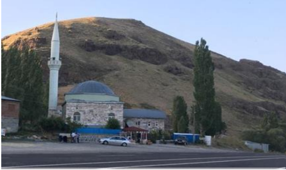
Fotoğraf 9. 2008 yılında ibadete açılan yeni Taşbaşı Mahallesi Camii.

D 950 Karayolunun hemen kenarında kurulan yeni yerleşme tam anlamı ile taşınmadan önce yeni caminin inşaatına 2005 yılında başlanmış ve 2008 yılında ibadete açılmıştır (Fotoğraf 9). Erzurum-Artvin Karayolunun hemen kenarında yapılan yeni Taşbaşı Mahallesi Camii sadece köy halkına değil yoldan geçen insanlara da hizmet vermektedir. Kadrolu bir imamın görevli olduğu, şadırvan ve modern tuvaletlere sahip olan yeni cami, yol güzergâhını kullanan yolcuların kısa süreli molalar için durmasına ve ibadetlerini yapabilmesine imkân sağlamaktadır.