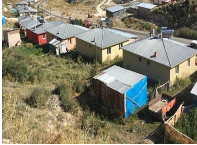
Fotoęraf 13. Modern meskenlerin etrafında yapılan yeni eklentiler.

dinlenme, tatil ve sıla ziyaretine dayalı turizm amaçlı kullanım řeklidir. Ulařım řartlarının iyileřmesinin yanı sıra, yeni yerleřmede eskiye gre evre dzenlemesinin daha plānlı bir hal alması, ime ve kullanma suyu teminindeki rahatlık, geliřen alt yapı hizmetleri ile modern meskenlerin varlıęı blgeden daha nce g etmiř olan ailelerin yılın belli dneminde de olsa Tařbařı Mahallesine gelmesine imkān tanımıřtır. Arařtırma sahamızdaki 40 konutun 17'sinin yaz aylarında yreye gelen aileler tarafından kullanılıyor olması, Tařbařı Mahallesi iin yeni ve gittike daha nem kazanacak bir ekonomik fonksiyon alanının varlıęını gstermektedir. Turizm amaçlı olarak gerekleřen bu geici g hareketine, bařta Erzurum olmak zere lkemizin dięer byk kentlerine g eden yre sakinlerinin katıldığını ve bu konudaki istekli tavırlarının zamanla daha da arttığını yerinde yaptığımız incelemelerde tespit etmiř bulunuyoruz.