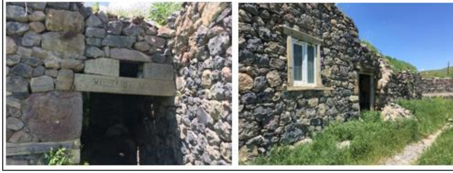
Fotoęraf 10. Terkedilen yerleřme alanında bulunan eski meskenler.

Yerleřmenin yer deęiřtirmesinin nedenlerinden birinin de bu ilkel meskenlerden kurtulmak olduęunu daha nce ifade etmiřtik. Dededen kalma bu geleneksel tař ve toprak evler yerine aędař yapı malzemelerinin kullanıldıęı meskenler yeni yerleřim alanının en belirgin farklarından birini oluřturmaktadır. Yeni Tařbařı Kynn tařınması kademeli bir srete gerekleřtięi iin yeni yerleřim alanındaki konutlarda bu kademelenmeye baęlı olarak ok belirgin farklılařmalar bulunmaktadır. 1981 yılında yeni yerleřim alanına inen ilk aileler kendi imknlarıyla aędař mimarı ve aędař yapı malzemeleri kullanarak geleneksel ky mimarisinden farklı olarak evlerini yapmıřlardır. Fakat bu ilk ařamada yer deęiřtiren sekiz aile, besledięi hayvanların barınaklarını daha nceki yerleřimde olduęu gibi evlerine yakın yapmıřtır. Hatta  ailenin hayvan barınakları iki katlı olan konutun alt katında bulunmaktadır (Fotoęraf 11).