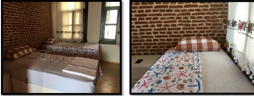
Görsel 8: Ayrıcalık Tarihi Küçük Taşkonak Konukevi Yatak Odası

Konuklarında kalan konuklar; güler yüzlü karşılandıklarını, sorunların çözmede samimi içten güler yüzlü muhatap bulduklarını, çalışan personelin çok ilgili olduğunu belirtmişlerdir. Bu tarz konukevlerinde kendilerini evlerinin rahatlığında, ev atmosferinde daha özgür hissettikleri için otellere tercih ettiklerini, ortamın daha sakin, sessiz ve huzurlu olduğunu belirtmişlerdir. Bu görüşlerini web sayfalarına yaptıkları yorumlarında "Artık Ayrıcalık'ta bir evim oldu" şeklinde ifade etmişlerdir.