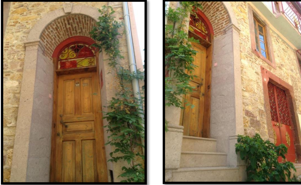
Görsel 6: Tarihi Küçük Taşkonak Konukevi Kapıları

Ayvalık geleneksel evlerinde genellikle iki giriş kapısı vardır. Bunlardan biri ışık olarak kullanılan bölüme, diğeri ise oturma mekânına açılır. İşlik zaman zaman dükkân olarak da kullanılır. Kapılar, kemerli oluşları ve işçilikleriyle, basit ve sade görünümülü yapılara ihtişam katar. Ayvalık ilçesi ve çevresi, zengin tarihi ve kültürel kimliği ile doğal güzelliklerinin sergilendiği Tepeleri; Şeytan sofrası, Cennet, Aşıklar, İlk kurşun, Çıplak, tavşan kulakları tepesi gibi pek çok seyir tepesi. Tarihi camileri; Ayos Yannis/Saatli, Ayos Yorgis/Çınarlı, Kato Panaya /Hayrettinpaşa ve Ayos Nikolaos/Biberli Cami. Kiliseleri; Ayazma, Profit İliyas, Ayos Dimitriyos, Taksiyarhis, Taksiyarhis Anıt Müzesi, Meryemana, Panayia, Faneromeni (Ayazma), Aya Triyada, Ayi Vasiliiyu, Ayos Pandeleymonas. Manastırları; Ayi Nikolau, Aya Paraskevi, Çamlı, Leka Panaya /Koruyan Meryem, Ayişığı, Ayos Apostolos, Tavuk Adası, Güvercin Adası /Aya Yorgi, Profit İliya, Kızlar ve Taşlı Manastırları ile yerli yabancı tüm turistlerin ilgisini çekmektedir.