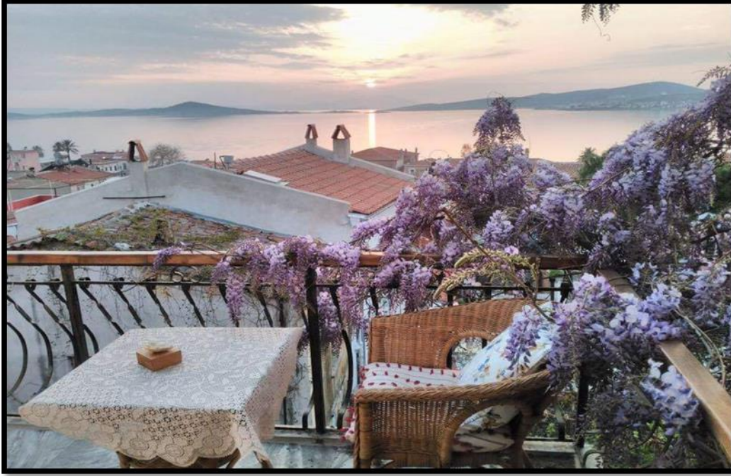
Görsel 7: Ayvalık Mor Salkımlar Konukevi Balkon Manzarası

Ayvalık merkez de işletilmekte olan aşağıdaki 3.1. no'lu tabloda isimleri belirtilen 5 pansiyonda konuk edilen 393 müşterinin görüş ve yorumlarına göre seçilmiştir. Bunlar en çok konuk yorumu bulunan, tüm sezon açık olan ve 2010 yılından günümüze kadar hizmet vermekte olan pansiyonlardır. Mimari tarzları, fiyat, temizlik, kahvaltı, lokasyon, karşılama ve ilgilenme, ev atmosferi başlıkları altındaki, müşteri görüşleri, her pansiyonun ayrı ayrı değerlendirilmiş olup sonrasında karşılaştırılmış ve incelenmiştir. Araştırmada konuk yorumlarında en çok öne çıkan konular başlık olarak seçilmiştir. Bu çalışmada hedeflenen Ayvalık merkezinde eski Rum mimari yapısı özelliğini taşıyan evlerde yapılan Konukevi İşletmeciliğinde sunulan hizmetlerden hangilerinin müşteri tercihini ve memnuniyetini etkilediğidir.