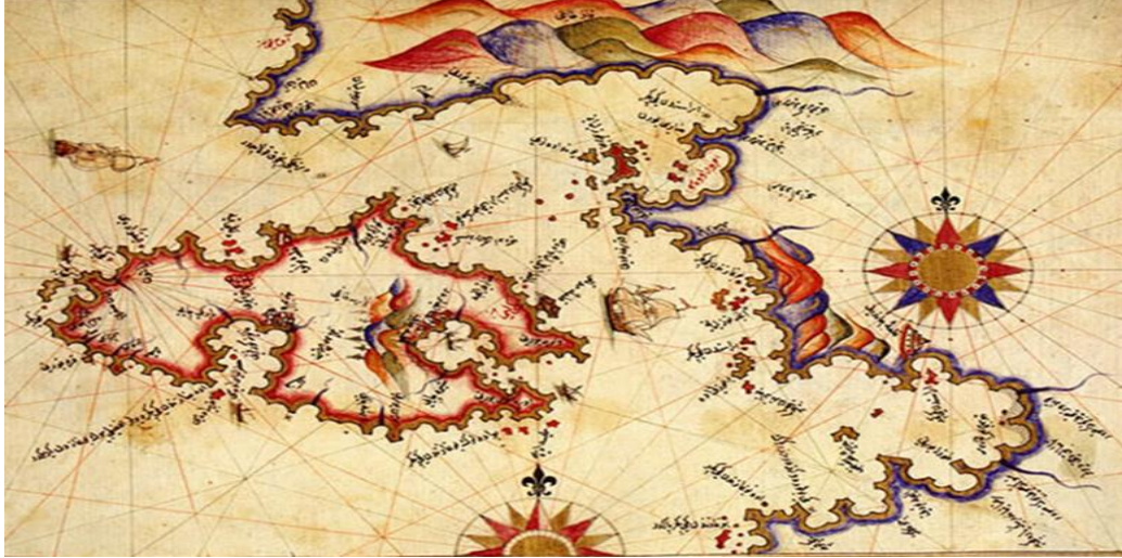
Görsel 4: Ayvalık Piri Reis Haritası

Ege bölgesinde bulunan geçmişten gelen tarihi kültürünü ve tarihi kentsel dokusunu bugüne kadar sürdürebilen ender yerleşim bölgelerinden biridir. Anadolu'da Geleneksel Konut Mimarisi içinde değerlendirilebilecek konutlara sahip yerleşimlerden biri olan Ayvalık, tarihi kent dokusuna ait bu birikim açısından oldukça zengin bir içeriğe sahip olduğu belirtilmelidir. XIX. ve XX. yüzyıla ait konutlardan en azından 1000 tanesi plan ve mimari özelliklerini koruyabilmiş biçimde sağlam ve kullanılır durumdadır. Kent bu kimliğiyle açık hava müzesi durumundadır. Geçmişle yaşayabilen bir kent olma özelliğini her sokağı donatan evleriyle ortaya koyar.