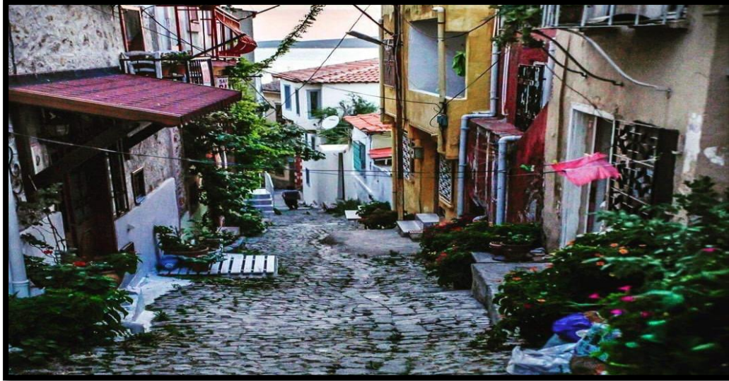
Görsel 5: Ayvalık'ta Sakarya 2.Fethiye sokak

Ayvalık cadde ve sokaklarındaki dar yapı, evlerin bitişik nizamda oluşu kentin sürekliliğini ortaya koymakta, bir süre korsanların barınağı olarak kullanıldığını düşündürmektedir (Yaşar, 1996).