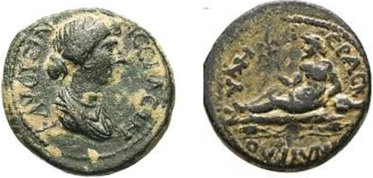
Resim 2: Hyde şehir sikkesi üzerindeki nehir tanrısı