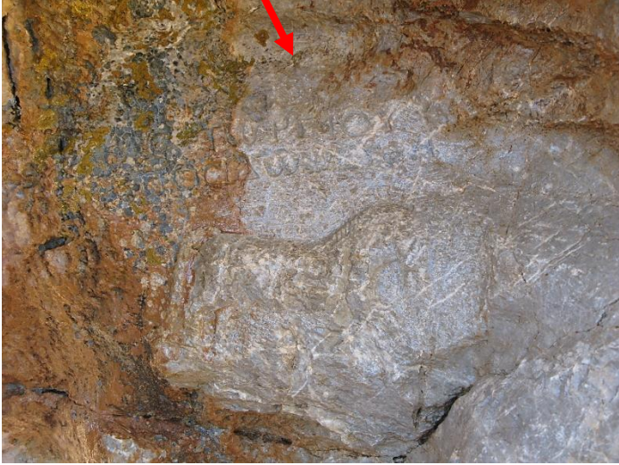
Resim 5: Tosuntaşı'ndan Poseidon kabartması