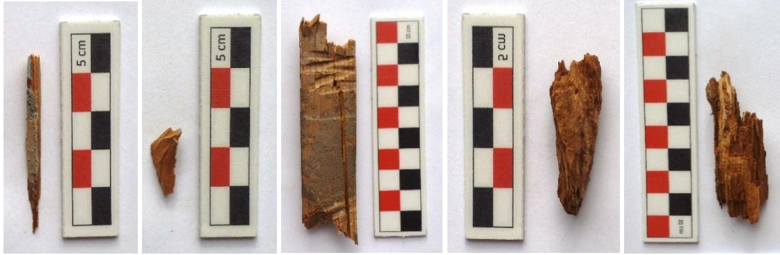
Şekil 2. Soldan sağa AAC-A2, AAC-A4, AAC-A6, AAC-A7 ve AAC-A8 kodlu ahşaplar.