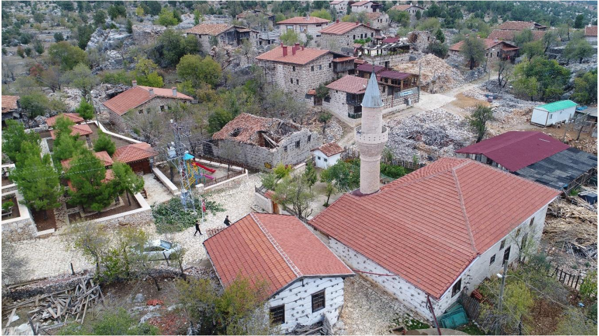
Şekil 1. İki farklı kısımdan oluşan Sarıhacılar Köyü Camisi. Sonradan eklenen bölümdeki “düğmeli duvar”.

Bu çalışma, ahşap ve moloz taş kullanılarak inşa edilen Akseki-İbradı Havzası'nın 19. yüzyıl yöresel mimari örneklerinden olan Sarıhacılar Köyü Camisi'nin muhtelif kısımlarından alınan ahşapların anatomik tanımını yapmak amacıyla gerçekleştirilmiştir.