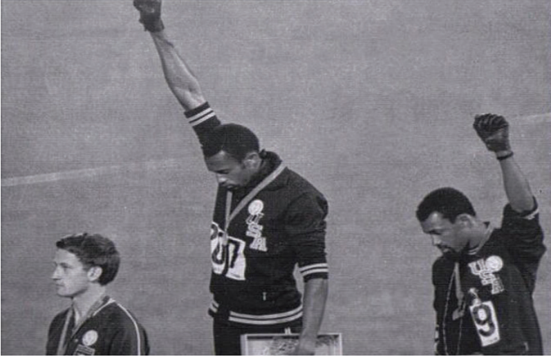
Resim 1- John Carlos ve Tommie Smith 1968 Meksika Olimpiyatları'nda

siyah eldivenli kollarını havaya kaldırmışlar ve bu ikonik görüntü tarihe geçmişti. Smith, bu hareketlerinin “Siyah İktidar” sembolü olmadığını, daha çok bir “insan hakları selamlaması” olarak nitelendirilmesi gerektiğini söylemiştir. Bu gösteri, modern olimpiyat tarihindeki en önemli anlardan biri olarak tarihe geçmiştir. O dönemde genç bir spor yazarı olan Brent Musberger, bu iki atleti “kara derili hücum askerleri” olarak adlandırmıştır. Smith ve Carlos, olimpiyat madalyasının getireceği imtiyaz, şöhret ve serveti daha ulvi bir dava uğruna kurban etmişlerdir. Bu duruma cevaben John Carlos şunları söylemiştir: “Birçok siyah atlet, olimpiyat madalyası kazanmanın kendilerini ırkçılıktan koruyacağını düşünmekteydi. Ancak sen bir madalya kazanmış olsan bile, madalyan örneğin anneni bu durumdan koruyamazdı. Kız kardeşini ya da çocuklarını ırkçılıktan muhafaza edemezdin. Evet belki sana 15 dakikalığına bir şöhret bahşederdi [Andy Warhol’un ünlü sözüne atf yaparak], ama geri kalan hayatında ne olacaktı ki?” ( https://www.aljazeera.com/indepth/opinion/2011/09/2011192813230659320.html ).