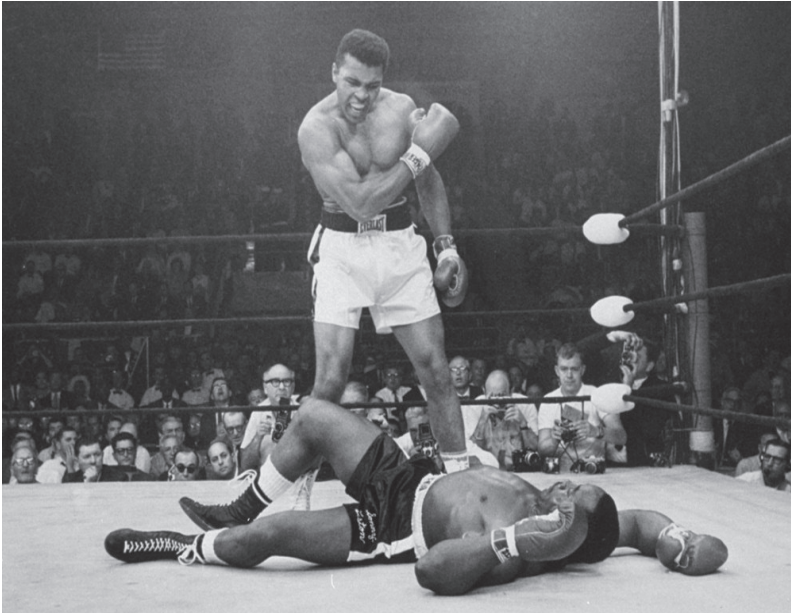
Resim 2- Muhammed Ali-Sonny Liston Müsabakası