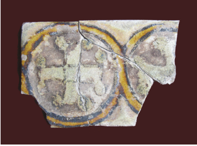
G. 2. Renkli sır tekniğinde çini parçası (Ü. M. Ermiş, 2017)