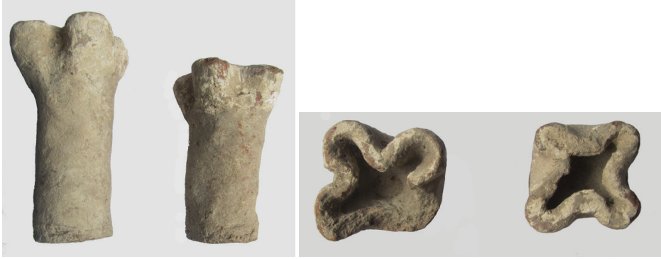
G. 1. Niksar'dan dört yapraklı yonca biçimli keramoplastik süsleme parçaları (Ü. M. Ermiş, 2017)

Niksar çevresinde bulunan ve günümüzde Yağıbasan Medresesi içinde oluşturulan vitrinlerde sergilenen birkaç parça dikkat çekicidir. Bunlardan biri keramoplastik 1 süs çömleridir. Keramoplastik süslemelerin bir çeşidi olan, uç kısmı dört yapraklı yonca biçiminde şekillendirilmiş bu süsleme parçalarından Niksar'da iki adet örnek tespit edilmiştir. Bu örneklerde harcın içine gömülen sap kısımları yuvarlak formulu olup, sapın içi doludur 2 (G. 1).