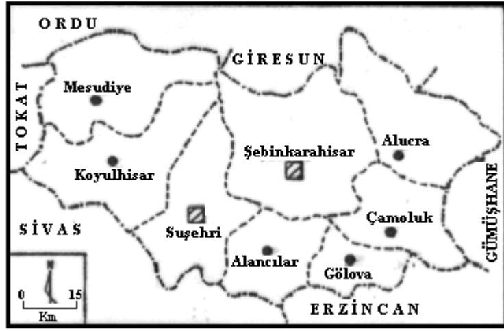
Şekil 3. Suşehri veya Şebinkarahisar Merkezli Muhtemel Yeni İl Haritası

Çalışma sahamızı meydana getiren Orta Kelkit Yöresinde bulunan yerleşmelerden Şebinkarahisar 1933 yılına kadar bir il merkezi durumunda iken, bu tarihten sonra Giresun'a bağlı ilçe durumuna getirilmiştir. Aynı şekilde söz konusu tarihe kadar bu ilin birer ilçesi durumunda olan Koyulhisar ve Suşehri Sivas'a, Alucra ise Şebinkarahisar ile birlikte Giresun'a bağlanmıştır. 1990 yılından sonra ise Suşehri'ne bağlı birer bucak merkezi olan Akıncılar ve Gölova ile Alucra'ya bağlı bir bucak merkezi olan Çamoluk ilçe durumuna getirilmiştir. Dolayısıyla yirminci yüzyıl içerisinde yörenin idarî yapılanmasında önemli değişiklikler yaşanmıştır. Gerek yörenin idarî yapısının değişikliğe uğraması, gerekse yöre içerisinde uzun dönemlerden beri bağlı olunan merkezlere uzaklıktan kaynaklanan sorunlar, Şebinkarahisar ve Suşehri merkezli yeni bir il yapılanmasının tartışılmasına neden olmuştur. Kuşkusuz bu talebin gündeme gelmesinde önemli haklı nedenler vardır. Öncelikle çalışmamızın başından beri değindiğimiz gibi yöre içerisindeki yerleşmeler ile bağlı olunan il merkezleri arasında belirgin fizikî engeller bulunmaktadır. Buna bağlı olarak doğal çevre, sosyal ve ekonomik hayat tümüyle farklılaşmıştır. Böyle belirgin coğrafi farklılaşmaların olduğu bir alanda idarî yapılanmanın buna uygun hâle getirilmesinin tartışılması olumlu karşılanması gereken bir durumdur (Darkot, 1961:43).