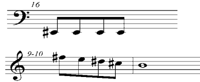
Şekil 11. Motif 2 ile Motif 4'ün karşılaştırılması