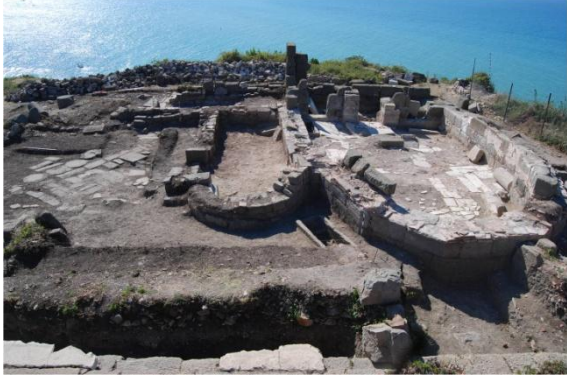
Resim 6: Akropolis Kazıları, Kilise

çok sayıda keramik heykel parçaları, sikkeler, yazıtlar ile kısmen taş döşeli yollar ortaya çıkarılmıştır (Öztürk, 2013; Batı Karadeniz Kalkınma Ajansı, 2018).