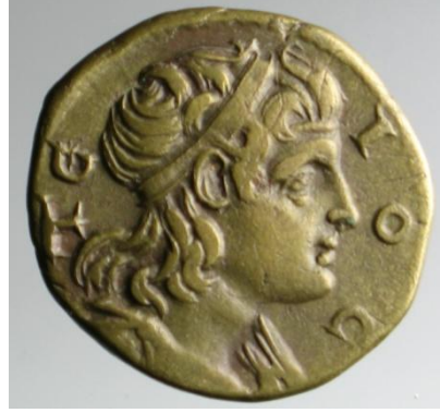
Resim 7: Rahip Tios, Roma Dönemi İstanbul Arkeoloji Müzeleri Koleksiyonu

Kaynak: Öztürk, B. (2013). Tios / Tieion (Zonguldak - Filyos) Antik Kenti Epigrafik Çalışmaları ve Tarihsel Sonuçları, I. Uluslararası Karadeniz Kültür Kongresi Bildiri Kitabı, s; 498-499.