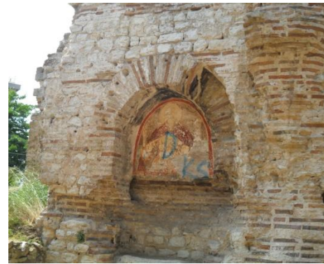
Resim 11: İlyas Peygamber, Balatlar Kilisesi