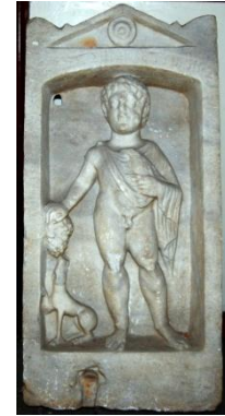
Resim 5: Çocuk Herakleitos'un Mezar Taşı, Karadeniz Ereğli Müzesi

Kaynak: Öztürk, B. (2013). Herakleia Pontika (Zonguldak – Karadeniz Ereğli) Antik Kenti Epigrafik Çalışmaları ve Tarihsel Sonuçları, I. Uluslararası Karadeniz Kültür Kongresi Bildiri Kitabı, s:520, 523, 527.