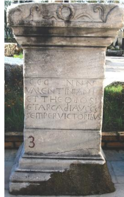
Resim 4: Valentianus, Theodosius ve Arcadius'un Onurlandırılması, Karadeniz Ereğli Müzesi