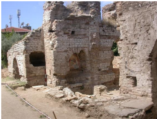
Resim 10: Ayazma, Balatlar Kilisesi

Geç Roma döneminden günümüze kalan Balatlar Kilisesi ya da 'Mitridates Sarayı' olarak bilinen yapı topluluğu surlardan sonra gerçek işlevi belirlenen en büyük yapıdır. Çevresi yoğun yapılaşmaya maruz kalmış yapı kalıntısından günümüze iki büyük haç planlı yapı ile dikdörtgen planlı büyük bir salon ulaşmıştır. Bazı kaynaklarda yapının Roma döneminde hamam, gymnasium ve palaestra (spor yapısı) olarak inşa edildiği Doğu Roma İmparatorluğu döneminde ise (6-7. yüzyıl) manastır ve kilisenin kurulduğu, 11. ve 13. yüzyıllarda ise tahıl deposu olarak kullanıldığı ve Sinop'un Türklerin eline geçmesinden sonra manastıra dönüştürüldüğü ve aynı zamanda Ortodoks Hıristiyan halk için mezarlık alanı olarak da kullanıldığı belirtilmektedir (Köroğlu, 2013). Osmanlı imparatorluğunun son dönemine tarihlenen mezarlıkta bulunan kemikler üzerine yapılan çalışmaların Balatlar'daki Ortodoks halkın ölümü nasıl algıladığı, ölü gömme geleneklerinin neler olduğu ve Hristiyanlık tarihi boyunca nasıl değişim yaşadığını göstermesi açısından önemli bir kaynak olduğu ifade edilmektedir. Balatlar Kilisesi'nde sürdürülen arkeolojik kazılarda mezarlara gömü hediyesi olarak konulmuş ithal ve yerel üretim seramik çeşitleriyle karşılaşmıştır. 2010 yılında başlanan kazı çalışmaları halen devam etmektedir (Köroğlu, 2013).