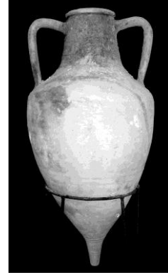
Resim 13: Bosporos Krallığı (MS 2.-3. yüzyıl) dönemine ait Amfora, Sinop Arkeoloji Müzesi