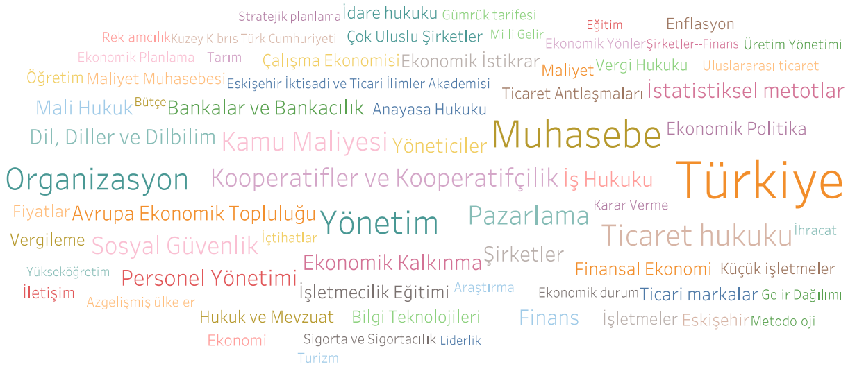
Grafik 3: Tüm Yıllar Bazında Kullanım Sıklığı 10 ve Daha Fazla Olan Anahtar Kelimelerin Kelime Bulutu Gösterimi

Tablo 7'de her on yıllık periyot için (1960'lar, 1970'ler gibi) en sık kullanılan ilk yirmi anahtar kelime listeleri kıyaslama kolaylığı amacıyla birlikte verilmektedir. Tablo 7'ye göre tüm yıllar boyunca Türkiye ve Muhasebe anahtar kelimeleri öne çıkmaktadır. 1965-1969 yılları arasında öncelikli olarak Muhasebe ve İş Hukuku en sık kullanılan anahtar kelimeler arasındadır. 1970'li yıllarda ise Muhasebenin yanında Ticaret Hukuku ve Organizasyon, Yönetim, Kooperatifler gibi anahtar kelimelerinin önce çıktığı görülmektedir.