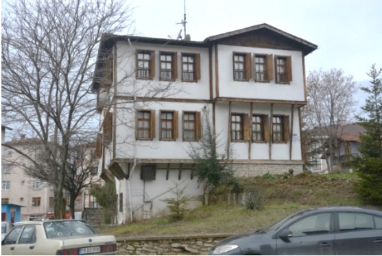
Fotoğraf 23. Türkiye Emekliler (İşçi) Derneği Safranbolu Şubesi

Belediyeye ait olan yapılardan bir diğeri de Türkiye Emekliler (İşçi) Derneği Safranbolu Şubesi'ne (2001) tahsis edilen ve Mimar Selahattin Karakök ile Mühendis Burhan Yılmaz tarafından inşa edilen yapıdır. Bina, modern yapı malzemelerinin geleneksel Safranbolu evlerine öykünülerek kullanıldığı bir yapıdır. Yapı, su deposu üzerine konumlandırılmış ve arazinin coğrafi yapısı da gözetilerek zemin üzerine iki katlı olarak inşa edilmiştir. Geleneksel Safranbolu evlerinin tamamında görülebilen ikili ve üçlü ahşap çerçeveli pencere düzenlemesi, ahşap şeritler, geniş saçaklar, çıkma oda ve destek unsurlarıyla bu yapı, geleneksel Safranbolu evinin adeta bir kopyasıdır.