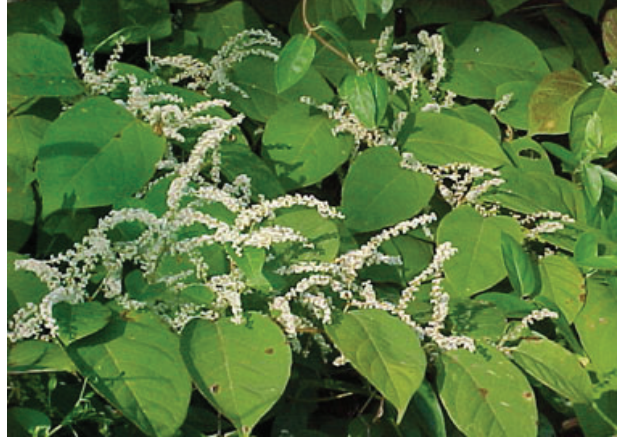
Şekil 1. Polygonum cuspidatum

Üzümlerde resveratrol miktarı asmanın yetiştirildiği toprak, hava gibi koşullara, Botrytis cinerea adı verilen küfle enfekte olmasına ve şarapçılıkta kullanılan yöntemlere bağlı olarak değişebilmektedir. Üzümlerde resveratrol sentezi stres, zedelenme, enfeksiyon ve UV ışınları gibi dış faktörlere bağlı olarak değişim göstermektedir (13). Resveratrol üzüm kabuklarında 5-7 ppm, çekirdeklerinde 1 ppm, etli kısımlarında 0.1 ppm'den azdır (14). Kırmızı şaraplarda üzümün kabukları ile birlikte cibre fermentasyonu yapıldığı için kabuklardan geçen resveratrol miktarı fazladır. Kırmızı şarap yapımı sırasında şarap mayası cibre fermentasyonu sırasında üzüm suyunda bulunan şekerleri fermente ederek oluşturduğu alkol üzümün kabuğundaki resveratrolü ekstrakte eder. Kırmızı şaraplarda ortalama resveratrol miktarı 1-11 ppm kadardır (15). Beyaz şaraplarda cibre fermentasyonu yapılmadığı için 0.1-2 ppm arasındadır. Pembe şaraplarda 0.05-1.19 ppm arasında ölçülmüştür (16,17)