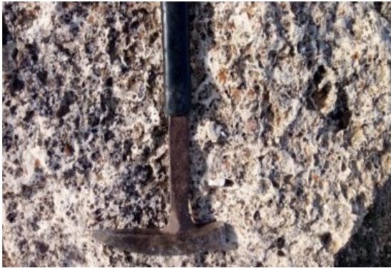
Şekil 5b. Kozaklı Kireçtaşı Üyesindeki kırmızımsı kahverengi metamorfik kaya parçacıkları içeren beyaz renkli gözenekli kireçtaşı seviyeleri (Yakın görünüm)