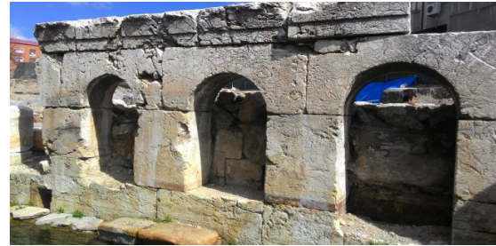
Şekil 6b. Sarıkaya Termal Roma Hamamı'nın mermerden yapılmış büyük havuz ve batı cephenin içten görünümü