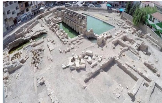
Şekil 1a. Sarıkaya Termal Roma Hamamı’nın havadan görünümü [20]

Bulunduğu yöredeki doğal yapı taşlarından inşa edilmiş Sarıkaya Termal Roma Hamamı, kısmen korunmuş halde olup, günümüzde mermerden yapılmış ön cephe, havuzlar ve iç bölmelerin temel seviyeleri haricindeki diğer seviyeleri tahrip olmuştur (Şekil 1a ve b).