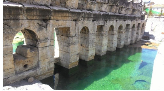
Şekil 2b. Sarıkaya Termal Roma Hamamı batı cephesi büyük havuz (natatio) içinden görünüm [22]

"Therma Basilica" olduğu bilinmektedir. Bölgede hâlihazırda var olan termal su kaynağının hamam içerisinde kullanıldığı ve aynı zamanda taban ısıtmasında da kısmen faydalandığı yapılan çalışmalarla ortaya konmuştur [22,23].