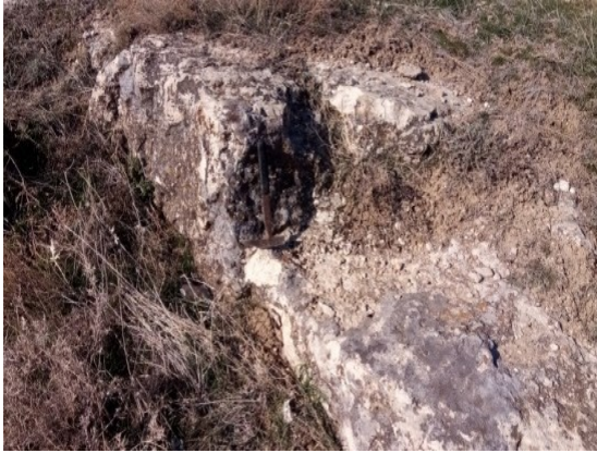
Şekil 5a. Kozaklı Kireçtaşı Üyesindeki beyaz renkli gözenekli kireçtaşı seviyeleri