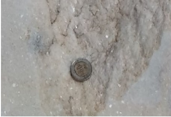
Şekil 4b. Bozçaldağ Formasyonuna ait iri kristalli mermerler (Yakın görünüm)