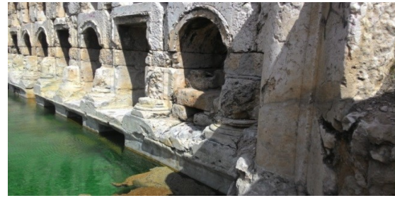
Şekil 6a. Sarıkaya Termal Roma Hamamı'nın mermerden yapılmış büyük havuz ve batı cephenin dıştan görünümü [22]

Termal Roma Hamamı'nın cephe ve havuzlarında beyaz renkli orta-iri kristalli, yer yer breşik dokuya sahip mermerler kullanılmıştır (Şekil 6a, 6b ve Şekil 7). Hamam taban döşemelerinde de altıgen olarak kesilmiş "opus sectile" olarak adlandırılan taban döşemesi bulunmaktadır [22] (Şekil 8).