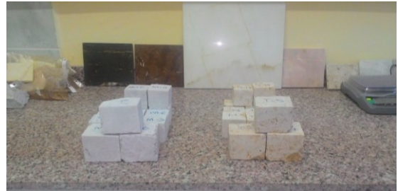
Şekil 13. Fiziko-mekanik deneyler için farklı ebatlarda hazırlanan numunelerin görünümü

Yozgat Sarıkaya bölgesinde araziden temin edilen mermer ve kireçtaşı numunelerinin fiziko-mekanik özelliklerinin belirlenmesi öncesinde numune hazırlama işlemleri gerçekleştirilmiştir. Numuneler TS EN ve ISRM standartlarında belirtilen numune boyutlarında Ahi Evran Üniversitesi Kaman Meslek Yüksekokulu, Madencilik ve Maden Çıkarma Bölümü Doğal Taş Analiz Laboratuvarında hazırlanmıştır (Şekil 13).