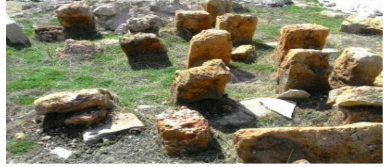
Şekil 12. Sarıkaya Termal Roma Hamamı taban ısıtmasında (hypocaust) kullanılan traverten dikmeler (suspensura)