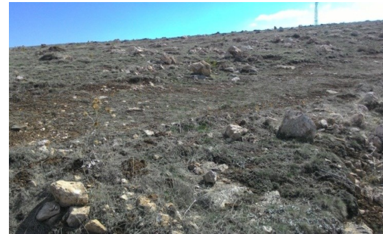
Şekil 4a. Bozçaldağ formasyonuna ait mermerler