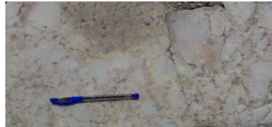
Şekil 7. Sarıkaya Termal Roma Hamamı'nın dış duvarında kullanılan breşik dokulu iri kristalli mermer