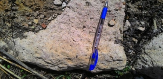
Şekil 9. Sarıkaya Termal Roma Hamamı'nın iç duvarları ve kanallarında kullanılan kireçtaşı

Termal hamamın iç kısım duvarlarında, kanallarda ve toprak altında kalan temel yapıda genellikle metamorfik kayaç kökenli kum-çakıl boyu kırıntı içeren, gözenekli, kirli beyaz-bej renkli kireçtaşları kullanılmıştır (Şekil 9). Hamam içerisindeki oluklarda ve havuz basamaklarında da kireçtaşları kullanılmıştır (Şekil 10-11). Gözenekli, kırmızımsı sarı renkli damarlı travertenler, Termal Roma Hamamı'nın taban ısıtması için oluşturulmuş hypocaust kısmında suspensura amacıyla taş dikmeler olarak kullanılmıştır [22] (Şekil 12).