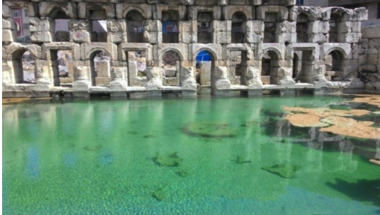
Şekil 2a. Sarıkaya Termal Roma Hamamı batı cephesi büyük havuz (natatio) dışından görünüm [22]

Sarıkaya Termal Roma Hamamı, Roma hamam mimarisinin Orta Anadolu'da görülen nadir yapılarından biridir. Hamamın ortaya çıkarılması için Yozgat Müzesi Müdürlüğü'nce 2010-2015 yıllarında kazı çalışmaları yapılmıştır. Kuzey-Güney doğrultulu inşa edilen yapının günümüze kadar korunan en önemli kısmı batı cephesi olup, söz konusu cephe, yaklaşık 4,5 metre yükseklikte, iki katlı, her katında onar kemer bulunan bir bölümdür (Şekil 2a ve b). Kuzey-güney uçlarında yarım daire planlı iki havuzcuk, önünde büyük termal havuz, cephe gerisinde iç havuz ve bunun doğusunda üçüncü bir havuz bulunmaktadır [21,22].