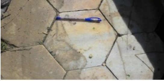
Şekil 8. Sarıkaya Hamamı'nın mermer taban döşemesi (opus sectile)

Termal hamamın iç kısım duvarlarında, kanallarda ve toprak altında kalan temel yapıda genellikle metamorfik kayaç kökenli kum-çakıl boyu kırıntı içeren, gözenekli, kirli beyaz-bej renkli kireçtaşları kullanılmıştır (Şekil 9). Hamam içerisindeki oluklarda ve havuz basamaklarında da kireçtaşları kullanılmıştır (Şekil 10-11). Gözenekli, kırmızımsı sarı renkli damarlı travertenler, Termal Roma Hamamı'nın taban ısıtması için oluşturulmuş hypocaust kısmında suspensura amacıyla taş dikmeler olarak kullanılmıştır [22] (Şekil 12).