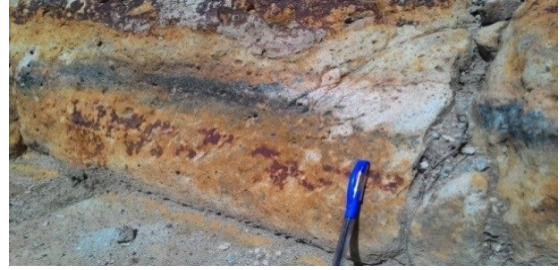
Şekil 11. Kaynağın ana çıkışındaki iç küçük havuz içi ve tabanı mermer, dış yükseltmeler sarımsı kahve renkli kireçtaşı