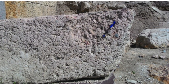
Şekil 10. Sarıkaya Termal Roma Hamamı içerisinde kırmızımsı kahverengi metamorfik kaya parçacıkları içeren kireçtaşı