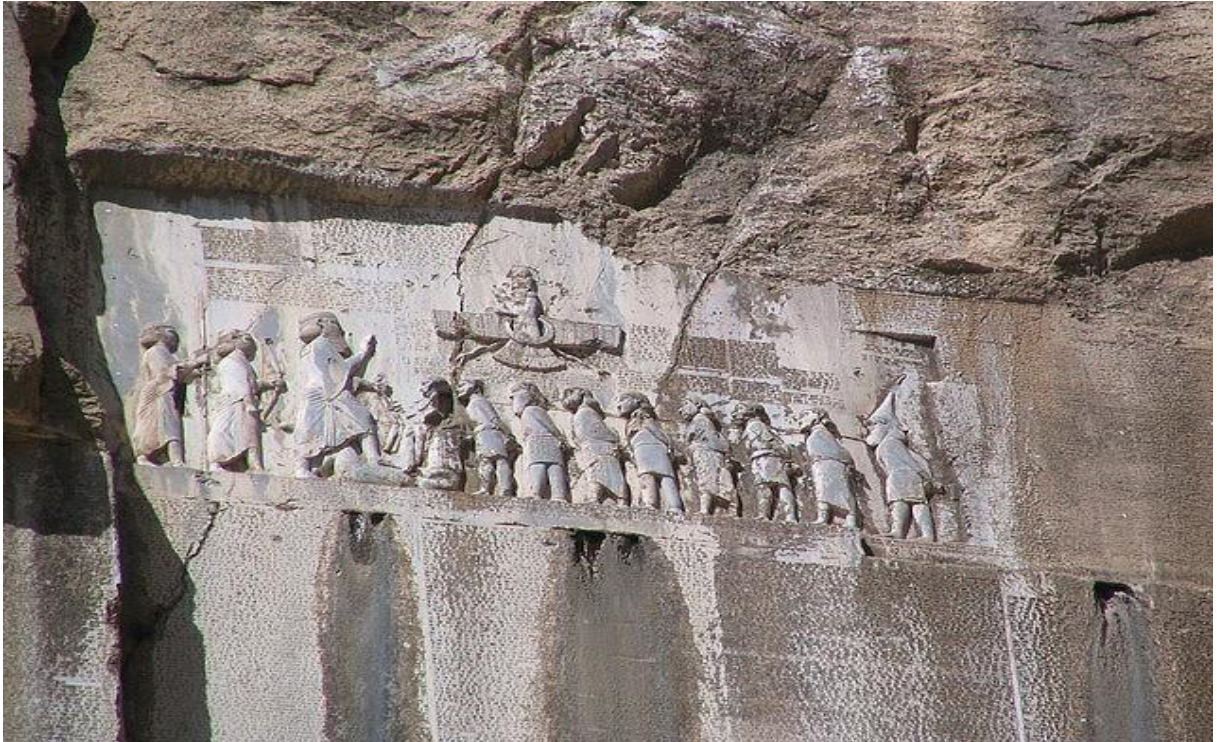
Şekil 7: Behistun kitabesi (Kuhrt, 2012).