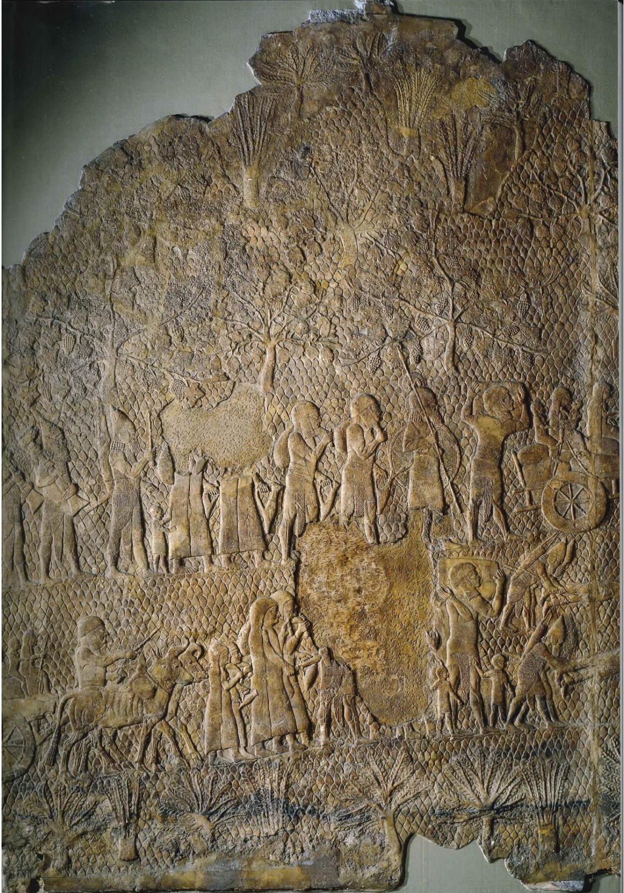
Şekil 5: Asur Kralı Sanherip döneminde gerçekleştirilen Lakiş kentinden sürgün edilenleri gösteren kabartma (Radner, 2018).