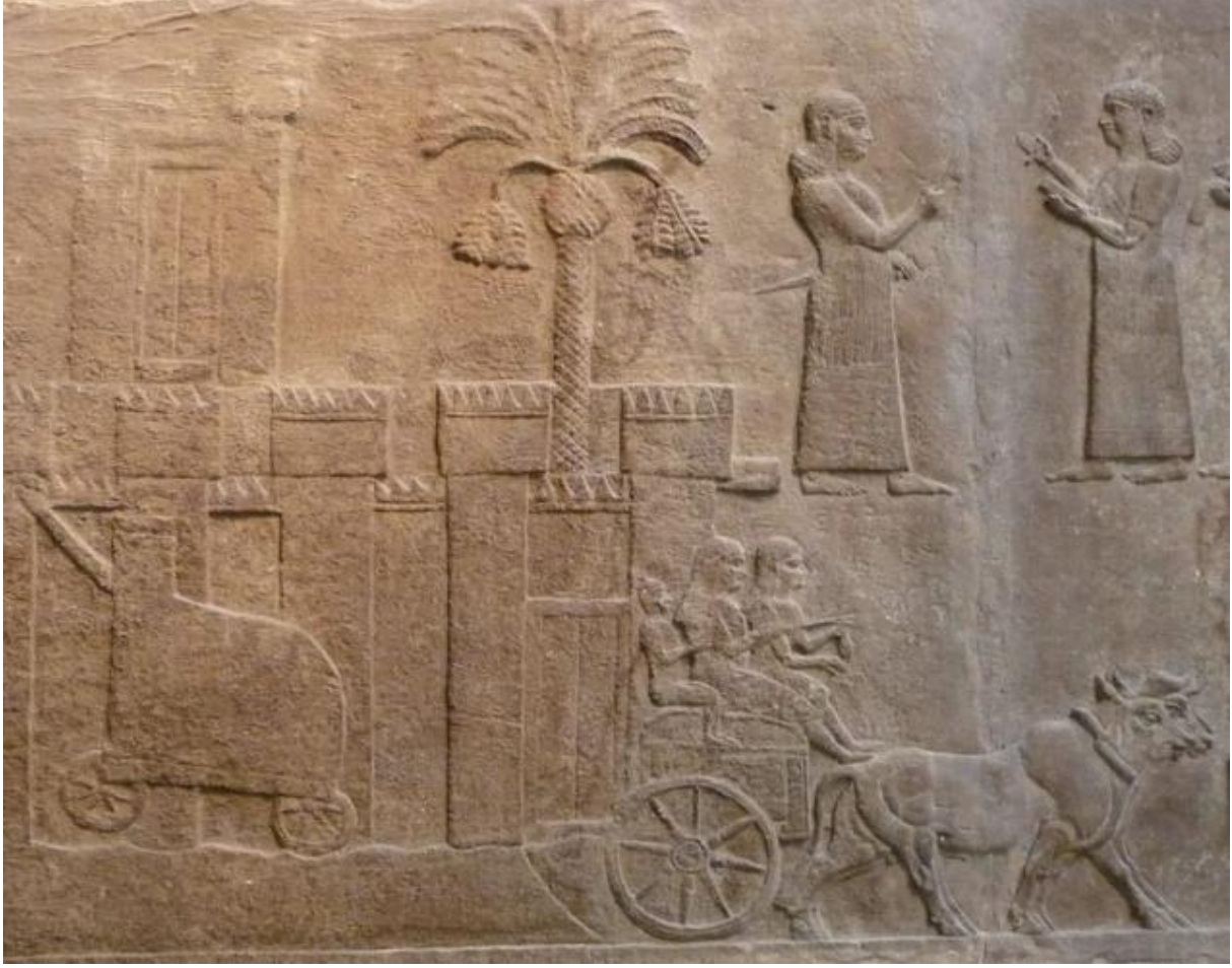
Şekil 3: Asur Kralı III.Tiglat-Pileser dönemi'nde gerçekleştirilen sürgün (Kalhu sarayı'ndan bir duvar kabartması) (Radner, 2011.)