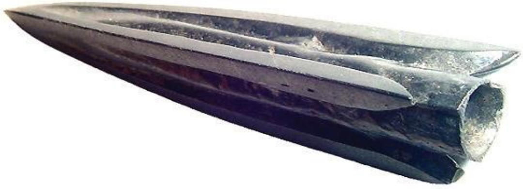
Şekil 6: İskit ok uçları (Palaz Erdemir ve Erdemir, 2010).