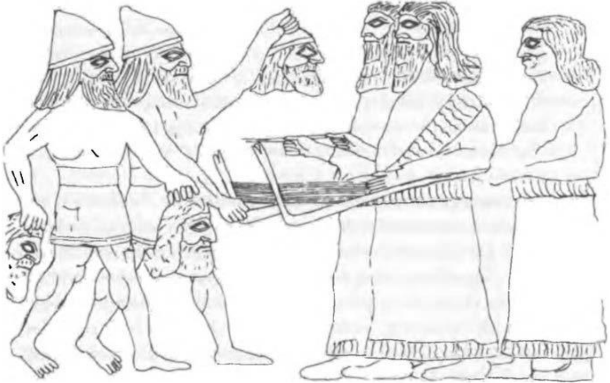
Şekil 4: Elllerinde düşmanların kesik başlarını tutan Asur askerleri (Kuhrt, 2007: 186).