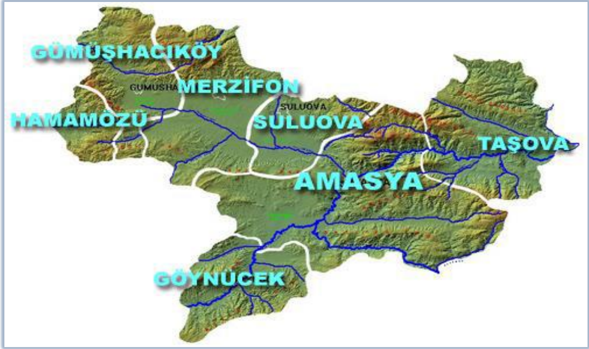
Şekil 2: Amasya İli Fiziki ve İdari Yapısı