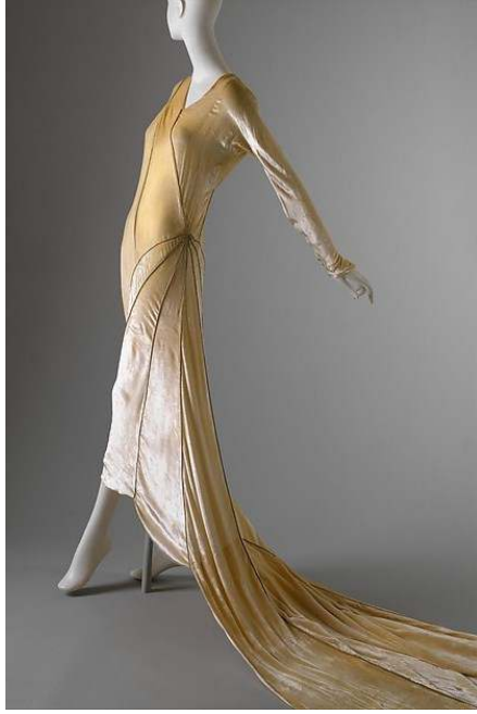
Figür 15 Madame Vionnet, Gelinlik , 1929, İpek.