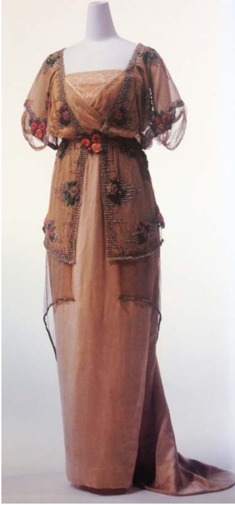
Figür 7 Paul Poiret, Gece Elbisesi , 1910-11, Tül ve Saten.