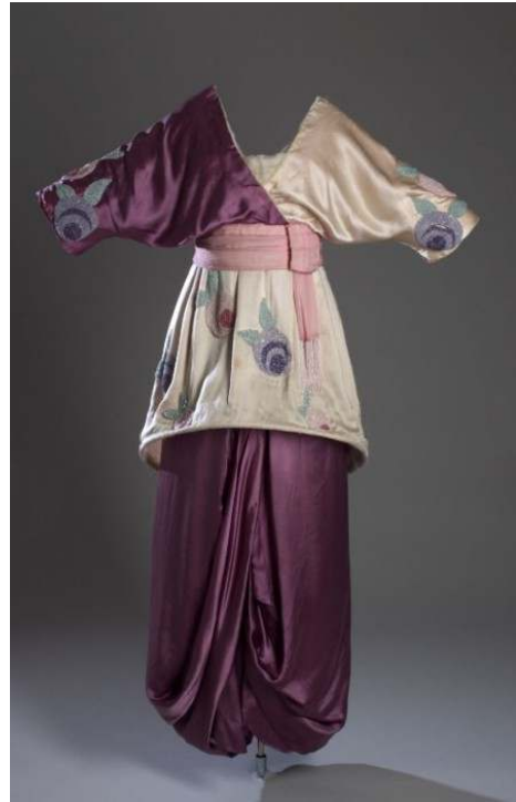
Figür 9 Paul Poiret, Elbise , 1913, Saten ve Boncuk.

1920'ler Avrupa'da caz devri olarak da adlandırılmaktadır. Bu dönem, 1. Dünya Savaşı sonrası tekrar hayatı yakalamak isteyen; moralsiz ve yokluk dolu bir dönemden sonra kendini iyi hissetmeye ve eğlenmeye odaklanan toplumu yansıtmaktaydı. Kadınların elde ettikleri sosyal ve ekonomik özgürlüğü bırakmak istemedikleri, karşı cinsle ya da kendi cinsleriyle ilişkilerinde daha serbest ve özgür oldukları, sigara içtikleri ve durmadan dans ettikleri (Charlston) bu dönemin kadın silüeti Art Nouveau'ya göre oldukça androjendi. Giysilerde bel hattı kalçaya inmiş; bol, rahat, serbest dökülen ve gece giyiminde bacak ve sırt dekoltesi ile tamamlanan tasarımlar korse ve abartılı eteklerin yerini almıştı (Hennessy 2012: 256-257). Bu giysiler sanki beden üstüne giyilmiş dörtgenler gibi durmaktaydı.