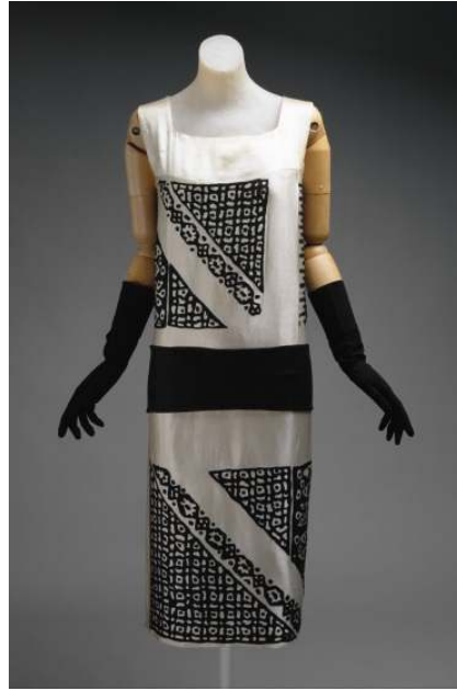
Figür 11 Jean Lanvin, Elbise , 1924, İpek ve Yün.