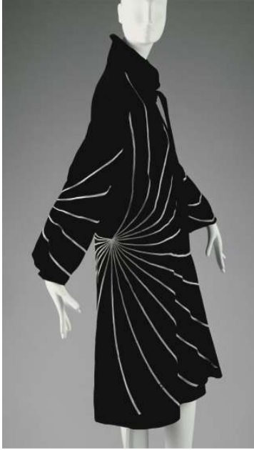
Figür 10 Jean Lanvin, Palto , 1927, Pamuk ve Yün.