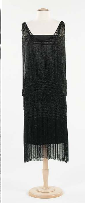
Figür 18 Coco Chanel, Gece Elbisesi , 1924-26, İpek.