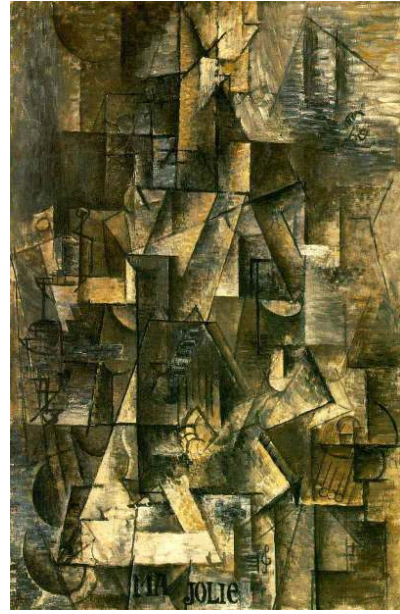
Figür 2 Pablo Picasso, Güzelim , 1911-12, Tual Üzerine Yağlı Boya.

Picasso'nun kübizmi anlatırken onun müzik, matematik, fizik, psikanaliz v.b. alanlarla ilişkilendirilerek yorumlanmasına karşı olduğu ve kübizmin resim sanatı dışında bir ilgi alanı olmadığını dile getirdiği bilinmekle beraber (Antmen 2009: 46); bu akımın modern sanatın oluşumu ve gelişimine katkısı, diğer sanat dallarına etkisi ve modern hayat algısı çerçevesinde tasarıma etkisi yadsınamaz.