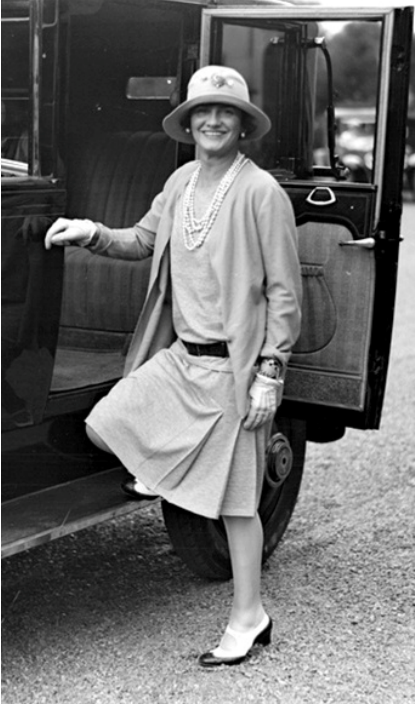
Figür 17 Coco Chanel, Takım , 1928, Jarse Kumaş.

olarak nitelendirilen ve hala onun ismi ile anılan “küçük siyah elbise” tasarımı (Figür 18) dönemin giysilerinin dörtgen biçimini net bir şekilde yansıtır. En üst katmanına eklenen püsküller, tasarıma dikey biçimde eklenen çizgisel öğeler olarak giysinin çok katmanlı ve derinlikli algılanmasına yol açar. Bu püsküller beden hareket ettikçe salınır ve giysi üzerinde hem optik yanılsamaların hem de hareketli ve muğlak derinlik algısının oluşmasında rol oynar. Aynı derinlik ve muğlaklık algısı kübist resimlerdekine benzer biçimde Figür 19’daki elbisede de gözlemlenir. Saydam kumaş bedeninin üzerinden sarkarken ya da hareket halinde salınırken farklı siyah tonları ve kromalarının yanı sıra ön-arka plan ilişkileri yaratır.