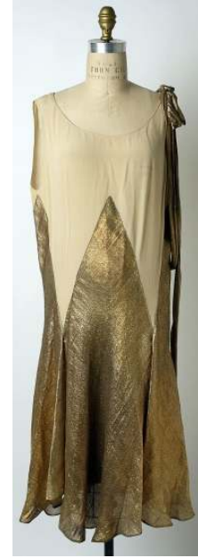
Figür 12 Jean Lanvin, Gece Elbisesi , 1927, İpek, Metal İplik.

Jean Patou (1880-1936) önceleri tenis sporcularına tasarladığı modern spor giysileri ile ünlenmiş olsa da sonraları Art Deco ve Kübizm etkisi ile yarattığı güçlü çizgiler, net ve temiz renkler ve geometrik biçimler ile öne çıktı (Seeling 1999: 68). Figür 13'teki giysi birbirini tekrar eden benzer kupların oluşturduğu hareketli bir yüzeyden oluşturulmuştur. Bu parçalar vücudun kavislerine birebir uymamakla beraber bel hattında daralmakta ve etek ucunda genişlemektedir. Büyükçe bir plili eteği andıran giysi, geometrik kuplarının yanı sıra kullanılan net ve açık koyu kontrastı ile ayrıştırılmış renkleri ile modern ve deneysel bir tarzı yansıtmaktadır. Dikine paralel çizgiler optik bir etki de yaratmakta ve bedeni olduğundan daha uzun bir biçimde şekillendirip soyutlamaktadır. Beden bir silindir olarak ele alınmış; ancak bu silindirin kavisli cephesi kübist bir anlayış ile geometrik parçalara bölünüp tekrar bir araya getirilmiştir.