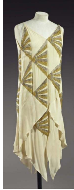
Figür 16 Madame Vionnet, Elbise , 1925, İpek, Metal İplik.

Son olarak Coco Chanel (1883-1971), moda tarihinde modern kadını yaratan tasarımcı olarak anılır. Art Deco'nun önemli temsilcilerinden olan Chanel aynı zamanda dönemin sanatçıları ile yakın dostluklar kuran, onlar için kostümler tasarlayan (örneğin Rus sanat yönetmeni ve Ballets Russes'un kurucusu Sergei Diaghilev'in "Mavi Tren" Balesi ("Diaghilev and the Ballets Russes, 1909-1929 When Art Danced with Music" Sergi Kataloğu 2013: 13)), bazen onları manevi ve maddi olarak da destekleyen, bunların yanı sıra Bauhaus ekolüne ve Picasso'ya hayranlık duyan bir kişiydi (Seeling 1999: 301). Yansıttığı modern kadın görüntüsü, dönemin ruhu ile birebir örtüşmekteydi. Erkek çamaşırlarında kullanılan ve esnek örme bir kumaş olan jarseyi kadın dış giyimine taşıyarak esnek, basit, sade, dörtgen biçiminde, beden ile uyumlu, rahat ve şık tasarımlar yaratmıştı. Bu giysilerin, 19. yüzyılın kavisli ve abartılı kadın silüetleri göz önüne alındığında ne kadar farklı, yeni ve sıra dışı olduğunu görmek mümkündür. Chanel esnekliğin modern hayatın önemli prensiplerinden birisi olduğunu fark etmişti. Kadınların esnek giysiler içindeyken giysiyi unutup dünyanın kendisine konsantre olması gerektiğini düşünmekteydi (Seeling 1999: 99).