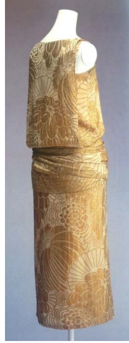
Figür 14 Edward Molyneux, Gece Elbisesi , 1926, İpek.