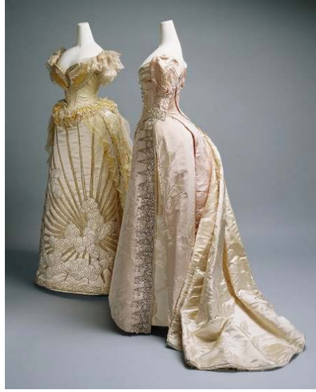
Figür 6 Charles Frederick Worth, Gece Elbisesi , 1892, İpek ve Kristal.

19. yüzyılın sonu ile 20. yüzyılın başı genel olarak haute-couture'ün babası olarak nitelendirilen Charles Frederick Worth'un tasarımları üzerinden tanımlanır (Figür 6). Bu tasarımlar Art Nouveau'nun ruhuna uyacak biçimde gene kavislerden meydana gelmiştir. Korse ile ince bel vurgulanmakta; eteğin genişliği arkaya çekilerek dolgulu bir kalça formu oluşturulmakta ve korsenin üst kısmında öne çıkan göğüsler ile beraber toplamda kum saatine benzeyen bir kadın formu yaratılmaktadır.