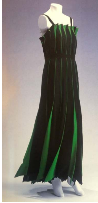
Figür 13 Jean Patou, Gece Elbisesi 1930, Krep.