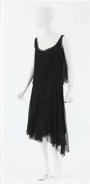
Figür 19 Coco Chanel, Gece Elbisesi , 1925, İpek.

Moda tarihçisi Richard Martin, Kübizmin moda ya olan etkisinden bahsederken oy kullanan, spor yapan, otomobil ve hız ile tanışan ve modern toplumda statüsü yükselen kadının değişen bu koşullar sonucu kübist giysi formlarına yönelmesinin tek başına yeterli bir açıklama olmadığından; kübizmin o zaman kadar olan estetik algının tam tersine yönde yarattığı estetik uyarının modadaki bu değişimin asıl nedeni olduğundan bahseder. Bu çerçevede, modayı etkileyenin sadece Kübizm değil; Kübist kültür ve anlayış olduğunu söylemek mümkün olabilir (Martin 1999: 11-12, 16). Bir taraftan klasik sanat hala kabul görse de, zamanın ruhu kübizmin doğmasına olanak sağlamıştı; yani toplumda topluca yaşanan modern hayata geçiş hem sanatı hem de kadını ve modayı değiştirmişti.