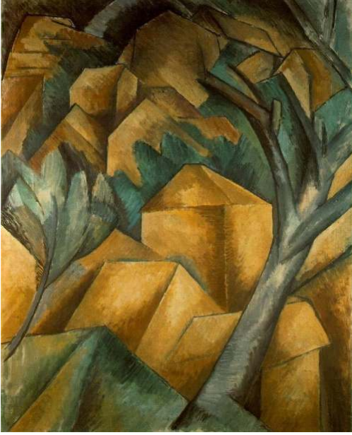
Figür 1 George Braque, Estate'daki Evler , 1908, Tual Üzerine Yağlı Boya.