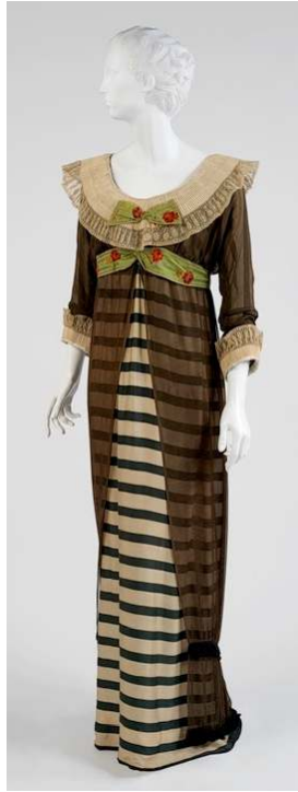
Figür 8 Paul Poiret, Elbise , 1910, İpek ve Keten.