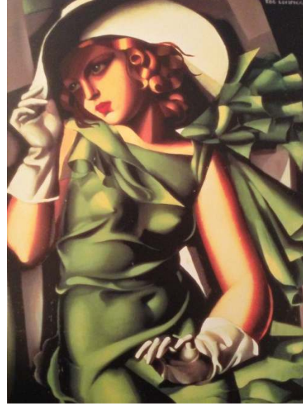
Figür 5 Tamara de Lempicka, Yeşilli Genç Kadın , 1927-30, Tual Üzerine Yağlı Boya.