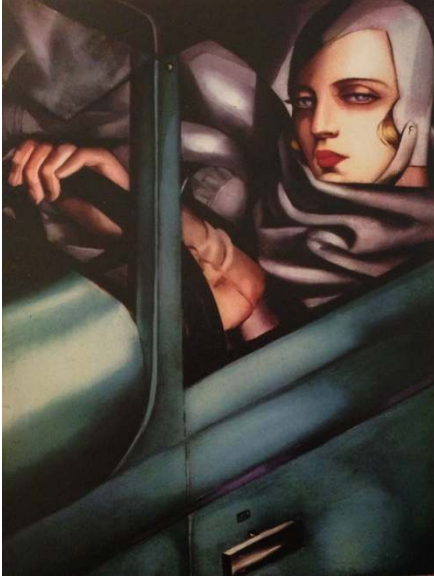
Figür 4 Tamara de Lempicka, Yeşil Bugatti'li Tamara (Otoportre) , 1927, Ahşap Üzerine Yağlı Boya.