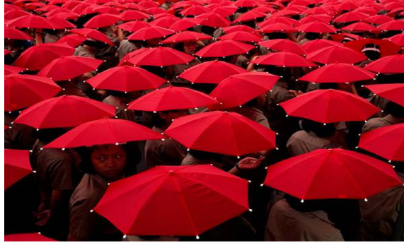
Fig. 4 Fotoğrafta renk, http://121clicks.com/inspirations/feel-the-color-inspiring-examples-of-red-color-photography/24.11.2016