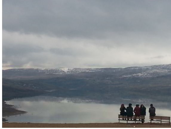
Fig. 3 Görsel tasarım öğelerinde ton fotoğrafı, foto. Erkan Çiçek, Aralık 2014, Tunceli.

Sette çekim esnasında kullanılan ışık miktarı ve bunun sahneye dağılımı kontrasta etki eden önemli bir unsurdur. Yumuşatıcı filtreler veya toplayıcı ve ışığı sert karakterli hale getiren spotlar, ışığın direkt sahneye düşmesi ile tavandan yansyarak sahneye düşmesi arasındaki fark, ışığın set içinde dizilimi ve kullanılan yansıtıcılar, sahnenin, daha sonra da filmin genel kontrastını düzenleyen elemanlardır.