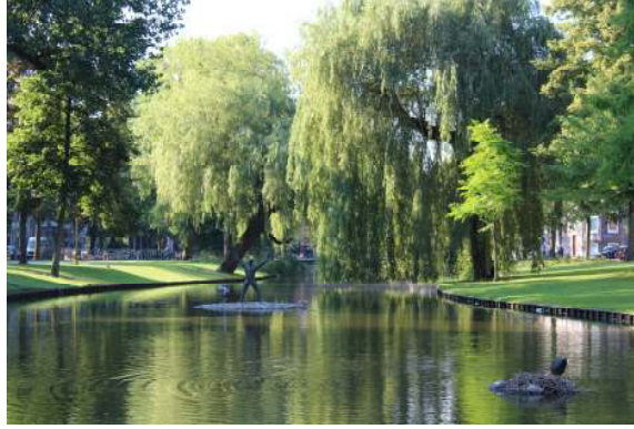
Fig. 5 Görsel tasarım öğelerinde renk fotoğrafı, foto. Erkan Çiçek, Temmuz 2016, Amsterdam

Aşağıdaki fotoğrafta ise renkler arasında uyum sağlayarak güçlü bir etki yaratmak mümkün iken karşıt renklerle daha güçlü kompozisyonlar da oluşturulabilir.