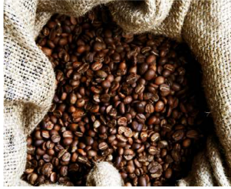
Fig. 8 Görsel tasarım öğelerinde birlik, foto. Erkan Çiçek, Kasım 2013, Hollanda.

Birlik ilkesi düzenlenen görselin kendi içinde bütün halinde olması, yeterli ve eksiksiz olması anlamına gelir. Bu kural bozulsa bile bilinçli bozulur ve anlatımı desteklemek içindir. Işıklı alanlar ve koyu alanlar birbirini tamamlar ve eksiksiz bir sahne oluştururlar (Uysal, 2007: 76).