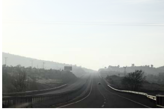
Fig. 1 Görsel tasarım öğelerinde çizgi fotoğrafı, foto. Erkan Çiçek, Ekim 2012, Türkiye.

Yukarıda ki fotoğrafta da görüldüğü gibi bir fotoğrafta çizgiler; yollar, dikey ve yatay binalar, yapılar, akarsular, insan bedeninin biçimleri, tepeler, gölgeler gibi binlerce şekilde karşımıza çıkarak anlam kazanmaktadır. Çizgiler bir tek hareket ve yönü belirtmez, tonlar, nesnelere, ışık ve gölge arasında bir sınır meydana getirmektedir. Çizgiler çerçeveyi oluşturur. Birbirine paralel yatay çizgiler perspektifi oluşturur, diyagonal çizgiler dinamiktir. Eğriler akıcıdır ve yumuşaktır. Doğada ve çevremizde yer alan düz ve eğri çizgiler fotoğrafta farklı yapıların ve duyguların ortaya çıkmasını sağlar (Terzi, 2006: 31).