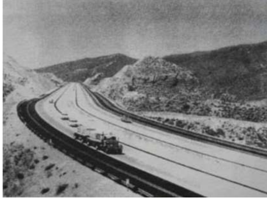
Fig. 2 Düz çizgi ve kıvrımlı çizgi fotoğrafından örnek, Joseph Mascelli, Sinemanın 5 Temel Ögesi .

Genellikle çizgiyi de resmi de yaratan içgüdüler aynıdır, Masaccio'dan Tiepolo'ya kadar Rönesans'ın bütün büyük ressamı aynı zamanda büyük çizgi ustalarıdır. Modern bir ressam olan Picasso'ya bakalım, çabuk ve zıt üslup değişmesiyle bizi şaşırtan bu ressamın asıl ustalığı az bir gayretle üç boyutlu biçimi veren desenlerinde ortaya çıkmaktadır. Dehanın çizgisindeki damgayı her yerde ve her zaman bulabiliriz. Bu özellik güzel sanatlarda o kadar yaygındır ki insan kolayca Blake'nin görüşüne düşerek çizgiyi tek önemli özellik sayabilir. Fakat ton dediğimiz özellik de o kadar yaygındır ve belki de ifade aracı olarak aynı değerdedir (Read, 2014: 26).