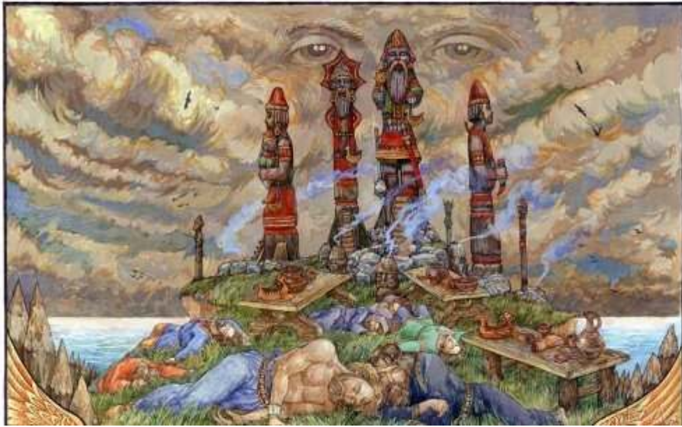
Figür 1. V.Korolkov, Kiyev tepeleri, Özel koleksiyon, k.a.

Nitekim Kiyev Knyazı Vladimir'in kurduğu panteon da toplumsal, dini ve siyasi olmak üzere belli amaçlar üzerine kurulur. Vladimir, 978 yılında Kiyev tahtına oturduğunda hâkimiyetini sağlamlaştırmak ve korumak adına bir takım çalışmalarda bulunur. Birlik ve beraberliği sağlamanın temel koşullarından biri yukarıda sözünü ettiğimiz üzere dini inanç sistemidir. Bu durum inancın toplumsal boyutunu oluşturmaktadır. Bu doğrultuda Vladimir, paganist inanç sistemi içinde her bir tanrının belli bir bölgede daha güçlü olması durumunun yarattığı kopukluğu aşmak adına tüm tanrıları bir merkezde toplamaya karar verir. Böylece Kiyev'de Vladimir Panteonu olarak adlandırılan Perun, Hors, Dajdbog, Stribog, Smargl ve Makoş 2 gibi tanrıların yer aldığı bir yapı oluşturulur (Figür 1).