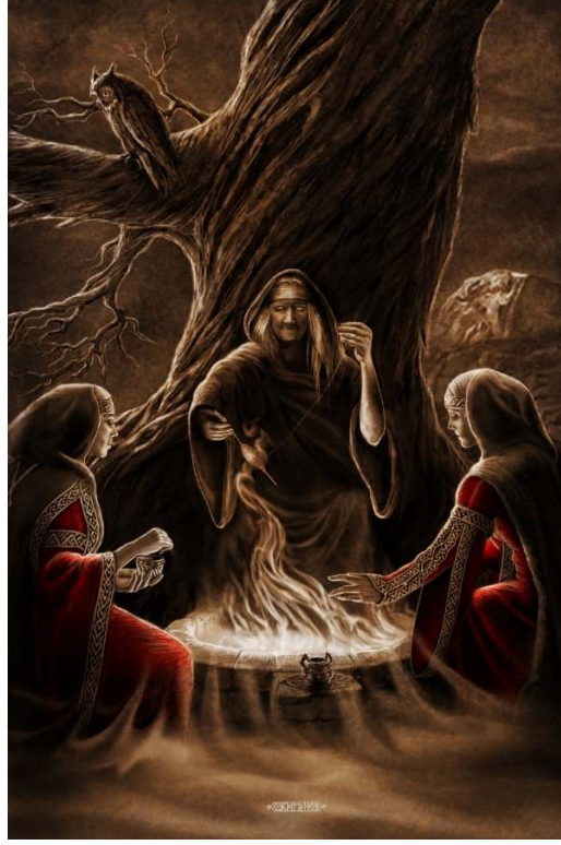
Figür 9. İ. Ojiganov, Makoş, Dolya ve Nedolya , Özel Koleksiyon, 2011, ty.

insanları ise cezalandırır. Makoş'un, aynı zamanda evliliği ve aile mutluluğunu gözetip koruduğuna da inanılır (Yeremenko 2011: 79).