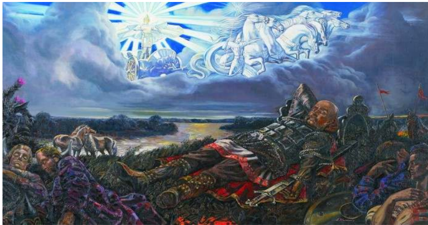
Figür 5. A.Klimentko, Dajdbog , İlk Slav Mitolojisi Müzesi, Tomsk, 2006, t.y.

İgor Destanı 'nda Hors yüce bir Tanrı olarak anlatılır. Eski çağlardan bu yana çiftçiler ve denizciler Hors'u, karanlığı aydınlatan, yol gösteren gece güneşi olarak kabul etmektedirler (Belyakova 1995: 98). Bunun yanı sıra Hors hiçbir zaman yalnız değildir, her zaman diğer Tanrılarla birlikte anılır. Örneğin, gün ışığı olmadan güneş olamaz. Bu yüzdendir ki, Hors ve Dajdbog her zaman yan yanadırlar. Hors'un uğurlu günü Dajdbog'da olduğu gibi pazardır ve sevdiği element saf altındır. Hors günü yazın 21-25 Haziran iken sonbaharda ise 21-23 Eylül'dür (Gavrilov ve Nagovitsin 2002: 95). Hors, yanında beyaz köpekler ya da kurtların ona eşlik ettiği, beyaz at üzerinde gökyüzünde doğudan batıya giden ve yaşlı bilge bir kişi olarak betimlenir (Pigulevskaya 2011: s.76). Vladimir panteonunda yer alan üçüncü tanrı olan Dajdbog (Dajbog), Doğu Slav mitolojisinde en önemli baş Tanrılardan biri olarak kabul edilir (Figür 5).