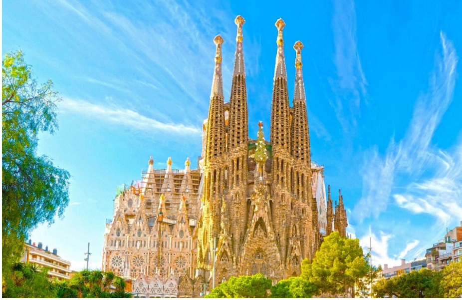
Resim 5: Art Nouveau’nun önemli sanatçılarından biri olan Katalan mimar Antoni Gaudi tarafından tasarlanan La Sagrada Familia yapımı hala tamamlanamamış bir bazilikedir. Modern neo-gotik ve Art Nouveau bir mimariye sahip olan eserde asimetrik kuleler yapılmıştır. Bu yapıya uygun olarak gökyüzüne doğru uzanma çabası olan bu kulelerin camlarında birçok vitray uygulanmıştır. Mimari yapı, tıpkı kurumuş bir ağaç gövdesine benzetilmiştir. 18 kule yapılması planlanmış ancak 8 kulesi bitmiş durumdadır. Bazilikanın içyapısını ayakta tutan kolonlar dallanıp budaklanan ağaçlar şeklinde tasarlanmıştır.