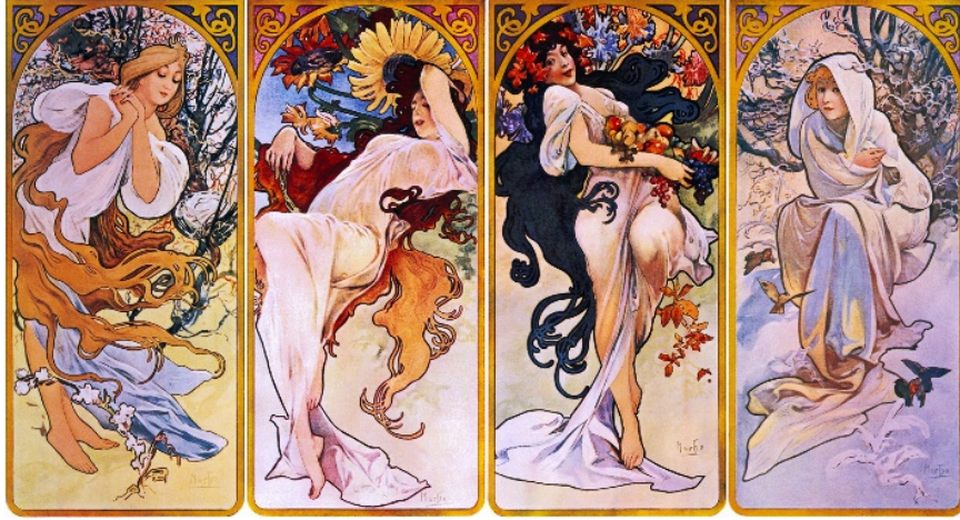
Resim 4: Four Seasons isimli dekoratif pano Art Nouveau sanatçısı Alphonse Mucha tarafından 1895’de yayınlanmıştır. Mevsimleri kişileştirerek, kadınların ruh durumuyla gösterdiği bu panolarda bahar masumiyeti, yaz sıcağı, sonbahar verimliliği ve kış da soğuk havayı simgelemiştir. Burada gösterilen dört panelde doğanın uyumlu döngüsü temsil edilmiştir. Panolardaki bitkisel motifler, kıvrımlı çizgiler, neoklasik tarzda giyinmiş zarif kadın figürleri ve kadınların başlarında haleye dönüşen çiçekler Art Nouveau üslubuna özgüdür.