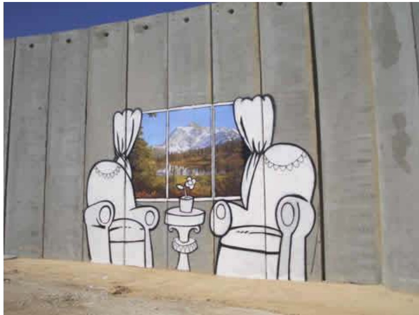
Resim 3: Tatil Enstantaneleri, Filistin, 2005.