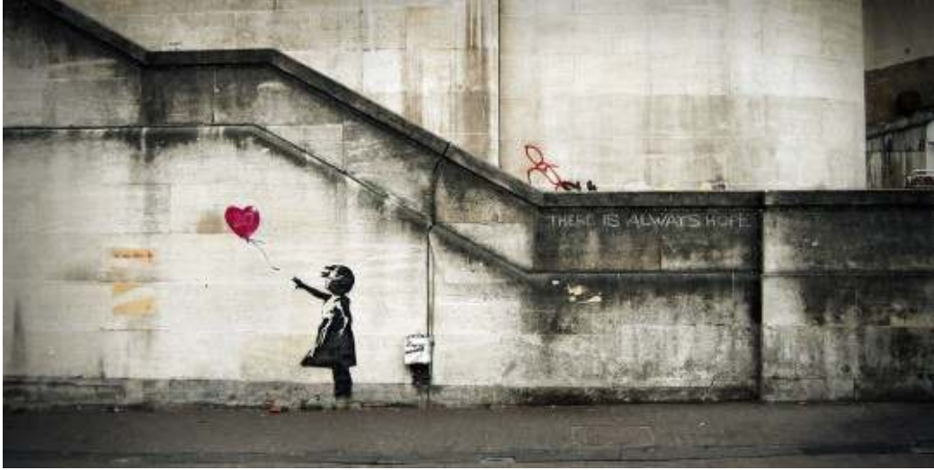
Resim1: 2002, Kırmızı Balonlu Kız