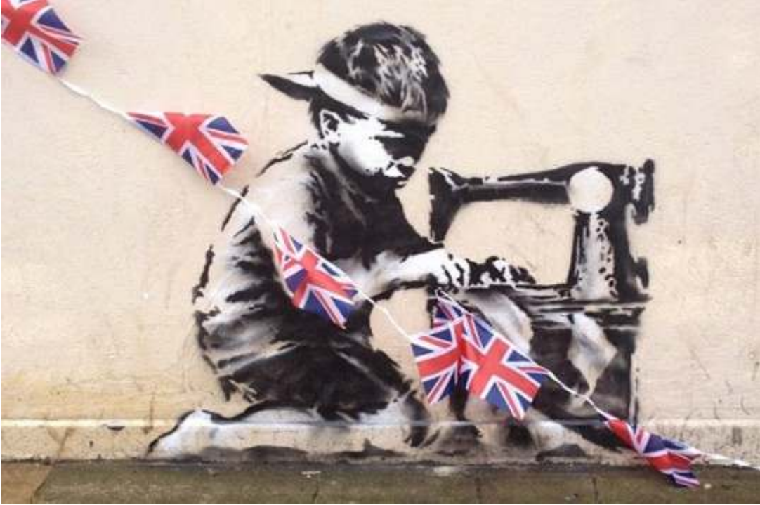
Resim 11: Çocuk İşçi, 2013.

Bu resmi bu kadar dokunaklı yapan etrafının kentsel bir harabeyle kuşatılmış olmasıydı. Fotoğrafçının bu fotoğrafı bir galeri sahibine göstermesiyle birlikte birkaç gün sonra yanlarında duvarcı testeresi, mini bir traktör ve kamyonla birlikte eski fabrika sahasına gittiler. Usta başından izin alarak duvarı yerinden söktüler, fakat yıkıntı alanının sahipleri daha sonra eserin kendi izinleri olmadan alındığını iddia ederek geri istediler ve yüz bin dolar talebiyle mahkemeye başvurdular. “Davalıların hareketleri duvar freskinin haksız şekilde mülk edinilmesi suretiyle yasadışı bir komplo oluşturuyor.” Banksy’nin resminin mahkemeye taşınma şekli çok ilginçtir, bir grafiti resminden duvar freskine terfi etmiştir.