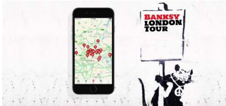
Resim 24: http://banksylondontourapp.co.uk/

Bir cep telefonu uygulaması olan ‘Banksy London Tour’, belli bir ücret karşılığında kullanıcılara Londra’nın sokaklarında Banksy’nin eserlerinin yerlerini harita üzerinde gösteriyor. Neredeyse bir galeride geziyormuşçasına, her eserin hangi sokakta, hangi caddede, hangi duvarda bulunduğunu gösteren uygulama, aynı zamanda eserlerin belli başlı özelliklerini, resimleriyle beraber tanıtıyor.