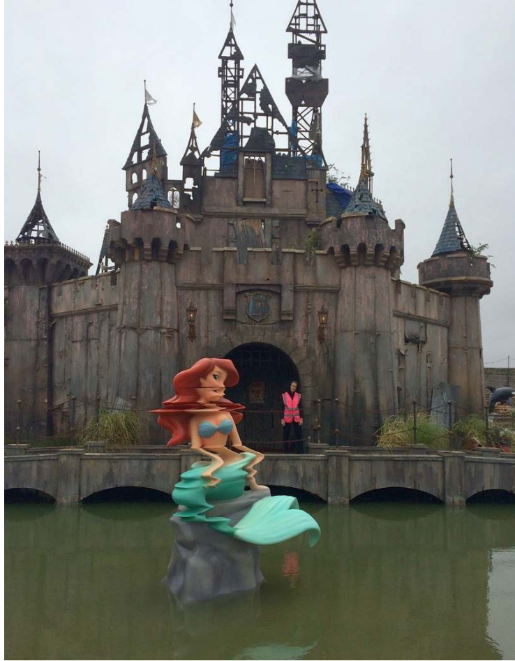
Resim 21: Dismaland, 2015.