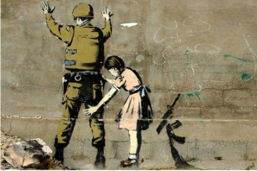
Resim 5: Kız ve Asker, Beytullahim, 2007.

Kız ve Asker adındaki bu eser İsrail duvarının Beytullahim bölgesine resmedilmiştir. Banksy, 'Santa's Ghetto' sergisinin tanıtımında bu resmi kullanmıştır. Sergi için Beytullahim bölgesini seçmiş olmasının nedenini, buranın İsa'nın doğum yeri olması ve aynı zamanda tüm insan hakları ihlalleri iddialarının da merkezi olması, şeklinde açıklamıştır.