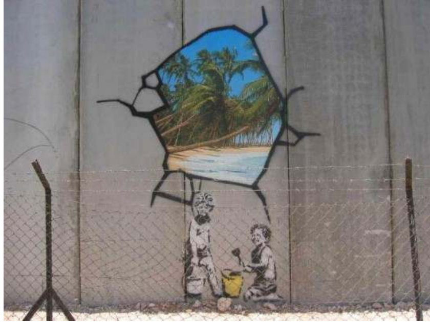
Resim 2: Tatil Enstantaneleri, Filistin, 2005.

kendilerini 'eđitimli vandal' olarak tanımlayan destekçileri ve takipçileri olduđu bilinmektedir. Kimilerine gre ise Banksy'nin 'eđitimli vandal' lakaplı gerilla sanatçılarında oluşan bir rgt vardır. Banksy'nin kamu malına zarar verdiđini dşnen ve yaptıklarını sanat eseri olarak grmekten ok terrist eylem olarak adlandıran hatırı sayılır bir kesim ile birlikte İngiliz hkmeti de, kimliđinin ifşa olması durumunda bir sulu gibi yargılanacađını ngrmşlerdir. Bu tehdit Banksy'nin kimliđini aıklamaması iin bir bařka neden olarak sunulabilir.