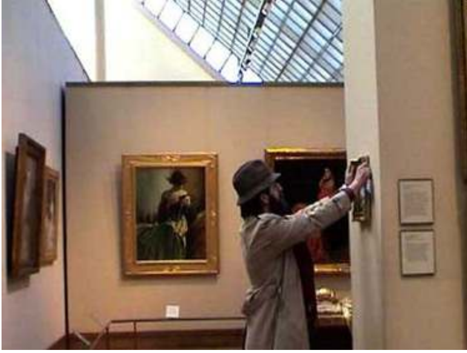
Resim 12: Metropolitan Müzesine kendi yaptığı işi asarken kendini fotoğraflatmıştır. 2005

Banksy verdiği bir röportajında sergi mekanları ve müzelere ilişkin şu sözleri sarf etmiştir. Bence bir müze gidip de bir sanat eserine bakmanız için kötü bir yer; çünkü bir sanat eserine dair olabilecek en kötü bağlam bir başka sanat eseri.