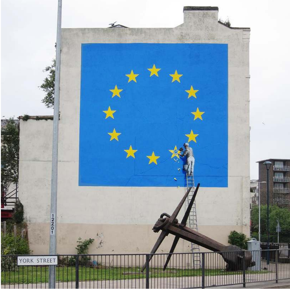
Resim 25: Banksy'nin en son işi, Brexit yorumu, Dover, İngiltere, 2017.

Banksy son işini İngiltere'nin Dover şehrinde bir binanın duvarına yaptı. Duvar resminde bir işçi AB Bayrağı'nda yer alan 12 yıldızdan birini parçalıyor.