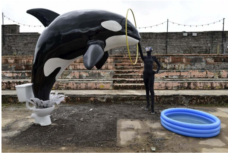
Resim 19: Dismaland, 2015.

Banksy İngiltere'de terk edilmiş bir spor merkezini geçici sergi alanına çevirdi. Banksy'nin " küçük çocuklara uygun olmayan aile eğlence parkı " diye tanımladığı parkta, azrailin çarpışan arabalarla eğlendiği ya da Cinderella'nın bal kabağı arabasında korkunç bir kazaya uğradığı eserler sergileniyor.