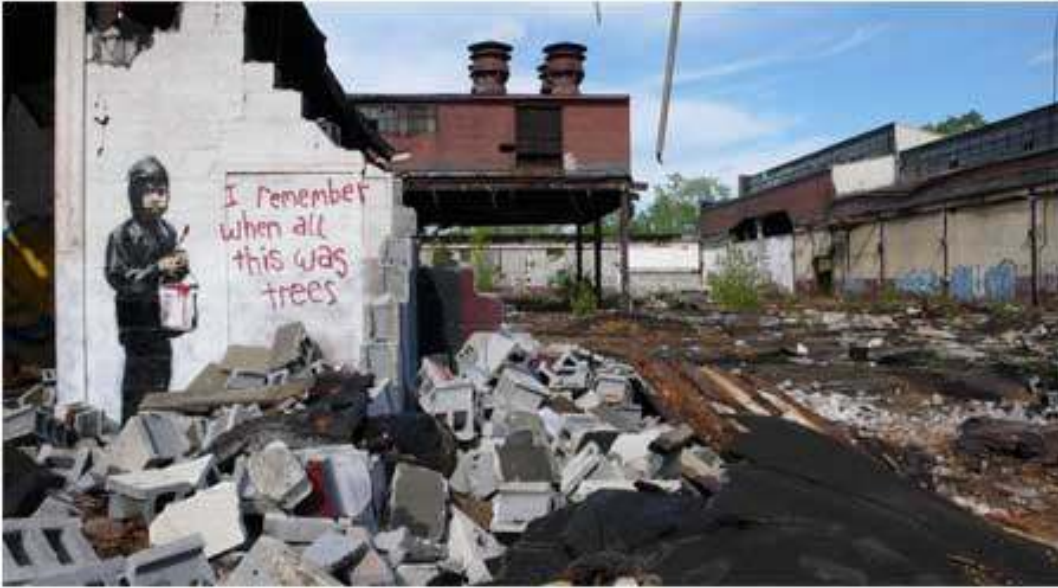
Resim 10: Buraların Hep Ağaç Olduğunu Hatırlıyorum, Detroitte, 2010.

Mayıs 2010'da ise bir fotoğrafçı Detroitte 1956'da kapanmış bir fabrikanın bahçesindeki yıkıntılar arasında bu fotoğrafı çekti, bu bir Banksy işiydi. Resimde elinde boya kutusu tutan bir çocuk vardı ve yanındaki duvara şu yazılmıştı "I remember when all this was trees" "Buraların hep ağaç olduğunu hatırlıyorum"