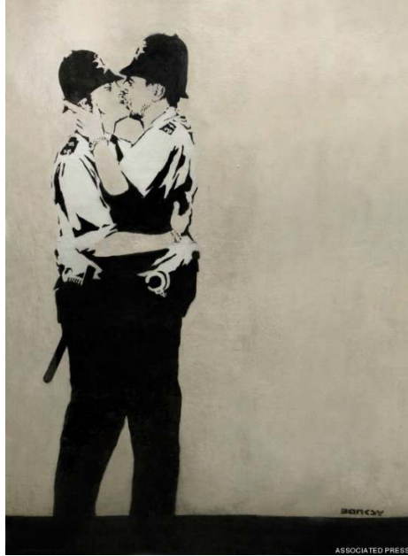
Resim 15: Kissing Coppers, Brighton, İngiltere, 2005.