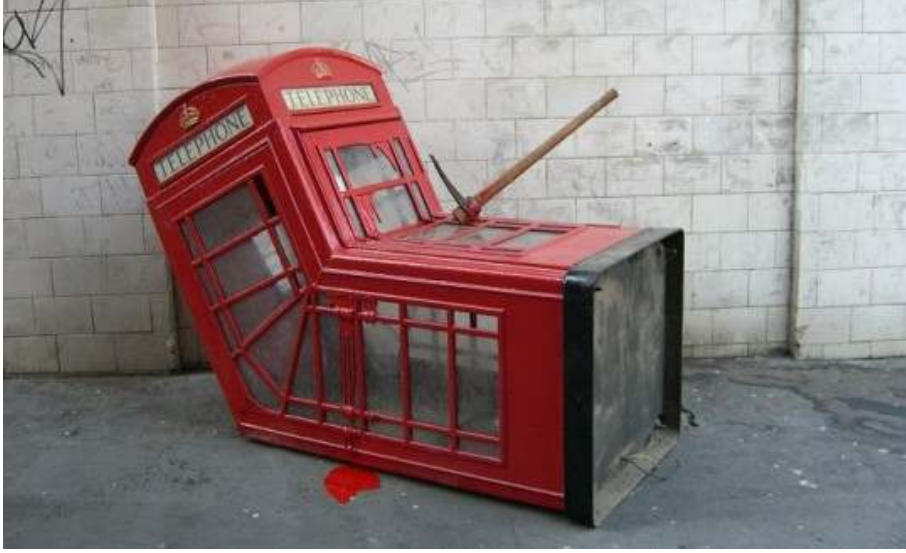
Resim 16: Harap Edilmiş Telefon Kulübesi, 2005.

İngiltere'nin Brighton kentinde bulunan Prince Albert Pub'ın duvarına çizilmiş olan eseri satın alan kişinin ismi açıklanmamıştır. Miami'de açık arttırmada 573 bin dolara satılmış olduğu bilinmektedir. Banksy bu eserinde aşkın, hangi türde olursa olsun özgür olması gerektiğinin ve toplum tarafından kabul görmesi gerektiğinin altını çizmektedir.