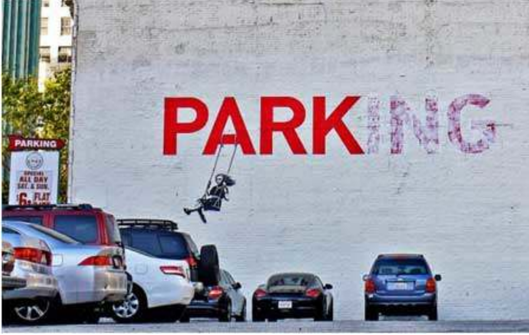
Resim 7: Parking, 2010.

Londra'nın kuzeyinde Chalk Farm'de bulunan bir duvar graffiti si olan Hizmetçi sonradan Doğu Londra'daki V&A Çocukluk Müzesi'nde sergilenmiştir. Bu eserden oluşturulan bir şablon, 2008'in Aralık ayında New York'ta bir Sotheby's açık arttırmasında 1.870.000 dolar rekor fiyat etiketiyle satılmıştır. Kendisinin en pahalı eseri olarak bilinir.