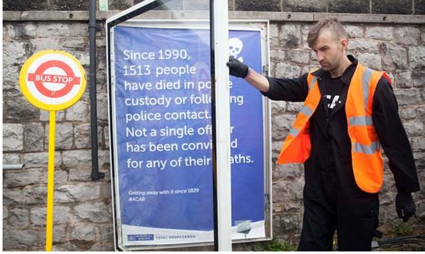
Resim 20: Dismaland, 2015.

Sergi alanındaki bir çadırda katılımcılar otobüs duraklarındaki reklam panolarının kilitlerini nasıl açabileceklerini öğrenip 5 paunda panoları kırmak ve reklamları propaganda posterleriyle değiştirmek için gerekli olan aletleri satın alabiliyorlar.