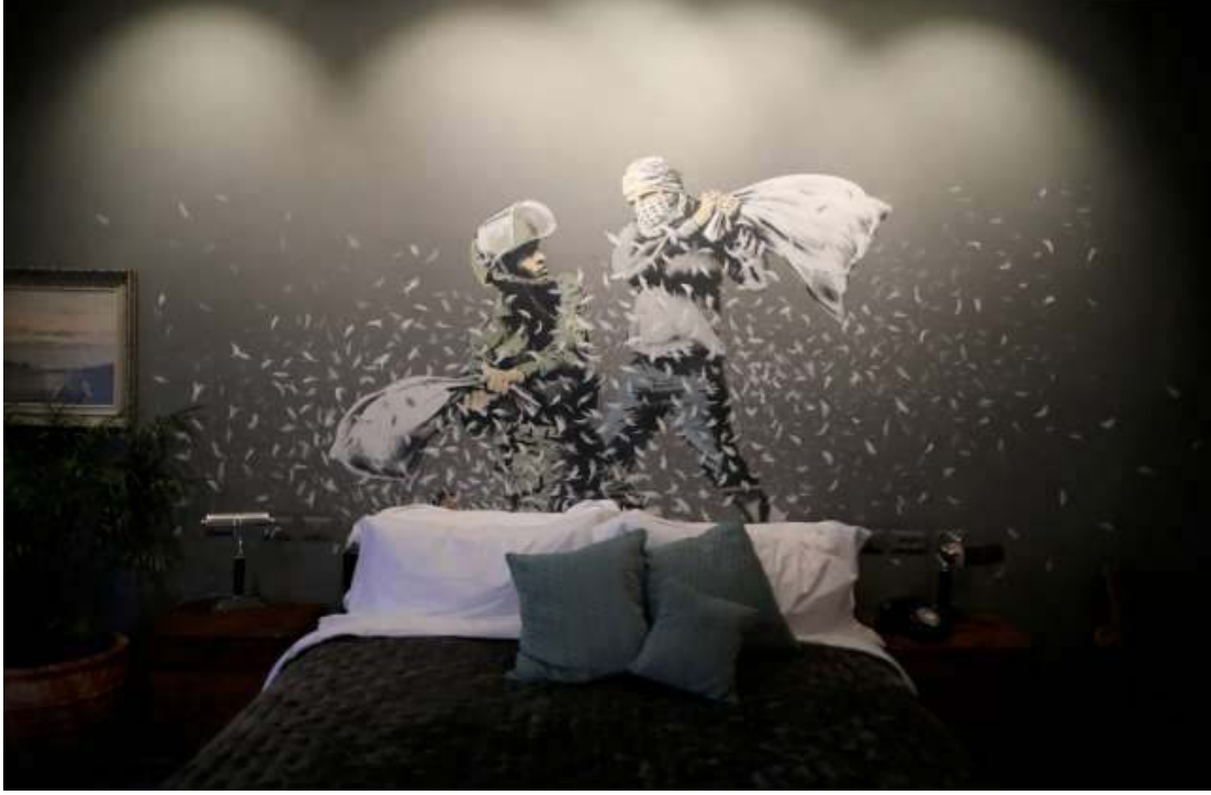
Resim 23: The Walled Off Hotel, 2017.

Otel bir yandan sanat galerisi, diğ er yandan da siyasi beyan işlevi görüyor.. Banksy yaptığı yazılı basın açıklamasında “Bundan 100 yıl önce Filistin topraklarının İngiltere’nin kontrolünde olduğunu” belirtti ve bölgenin 1948 yılına kadar manda yönetiminde olduğu için otelin dekorunda da İngiliz stiline kullanıldığını ifade etti.