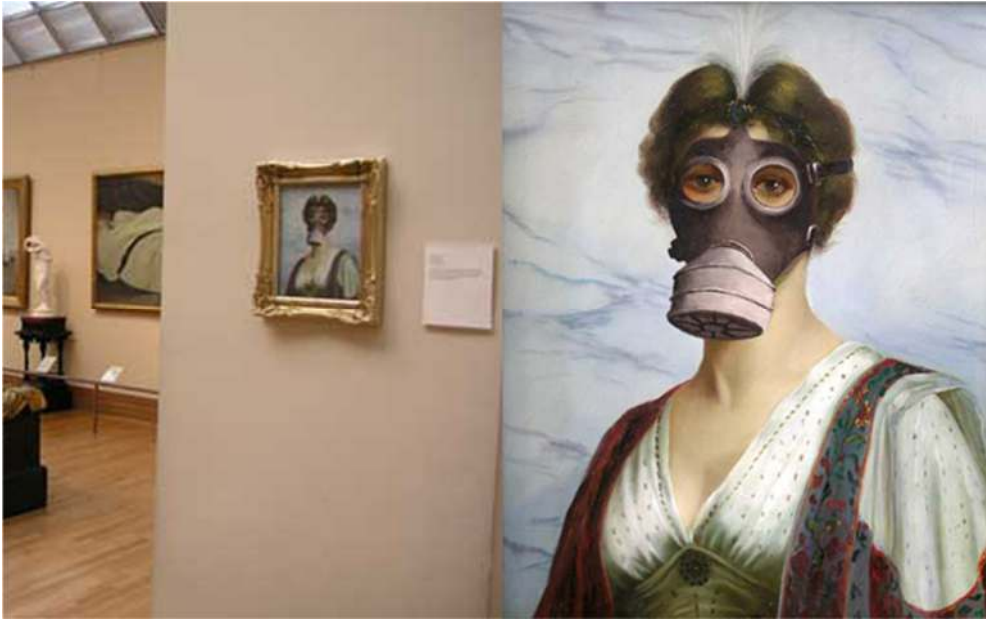
Resim 13: Metropolitan Müzesine bıraktığı işi, 2005.

Bir eleştirmenin de dediği gibi "Banksy olağanüstü bir yetenektir ve Tate'ten telefon beklememektedir çünkü Tate'i çoktan aşmıştır bile."