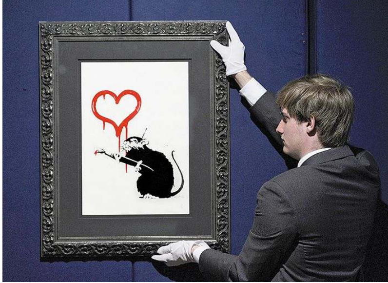
Resim 18: Rats Merit Unconditional Love, İngiltere, 2006.

Banksy'nin David adı verdiği neredeyse insan boyutunda olan bu eseri cam ilyaftan yapılmıştır. Michelangelo'nun ünlü heykelini onun anısına revize etmiştir, kişisel dokunuşunu vurgulamak içinse David'e bomba imha ceketi giydirmiştir. 2007 Ekim ayında Londra'da 416.742 dolara satılmıştır. 2009'da Banksy tekrar bu heykelden yapmış, bu kez yüzüne bir eşarp takıp, intihar ceketi giydirmiştir.