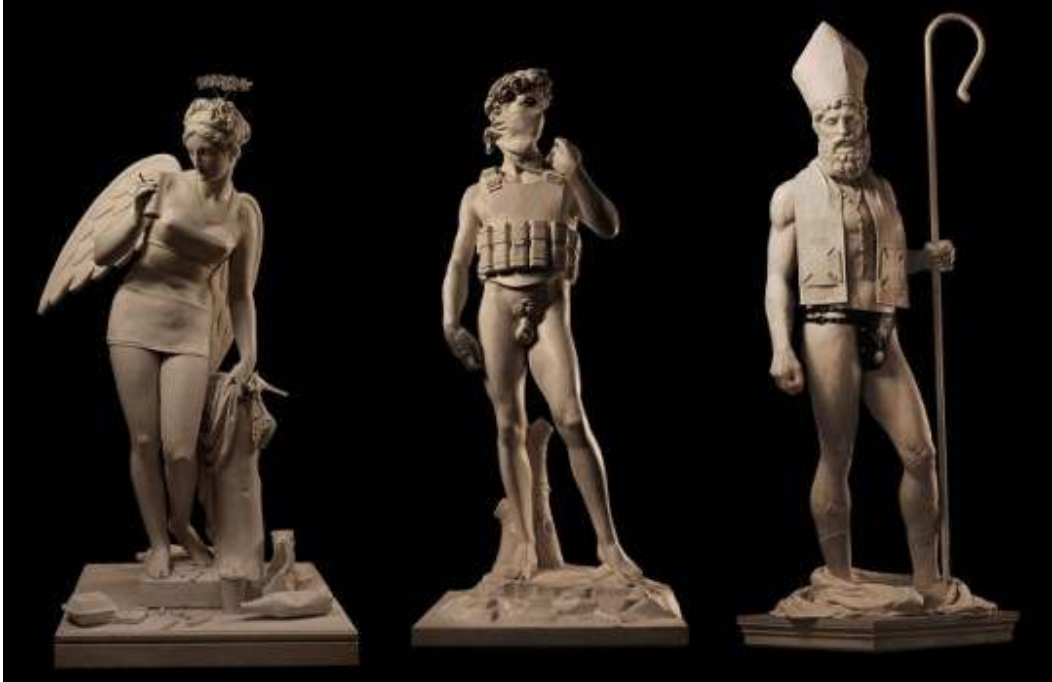
Resim 17: David, 2007.

Banksy'nin yapmış olduğu Harap Edilmiş Telefon Kulübesi heykeli, balta ile yaralanmış, kanlı bir görüntüye sahiptir. Farklı eyaletlerde de bu tarz acı çeken telefon kulübeleri heykelleri mevcuttur. Londra'da Soho Meydanı'nda sergilenen bu özel parça, Şubat 2008'de New York Sotheby's'de 605.000 dolara satılmıştır.