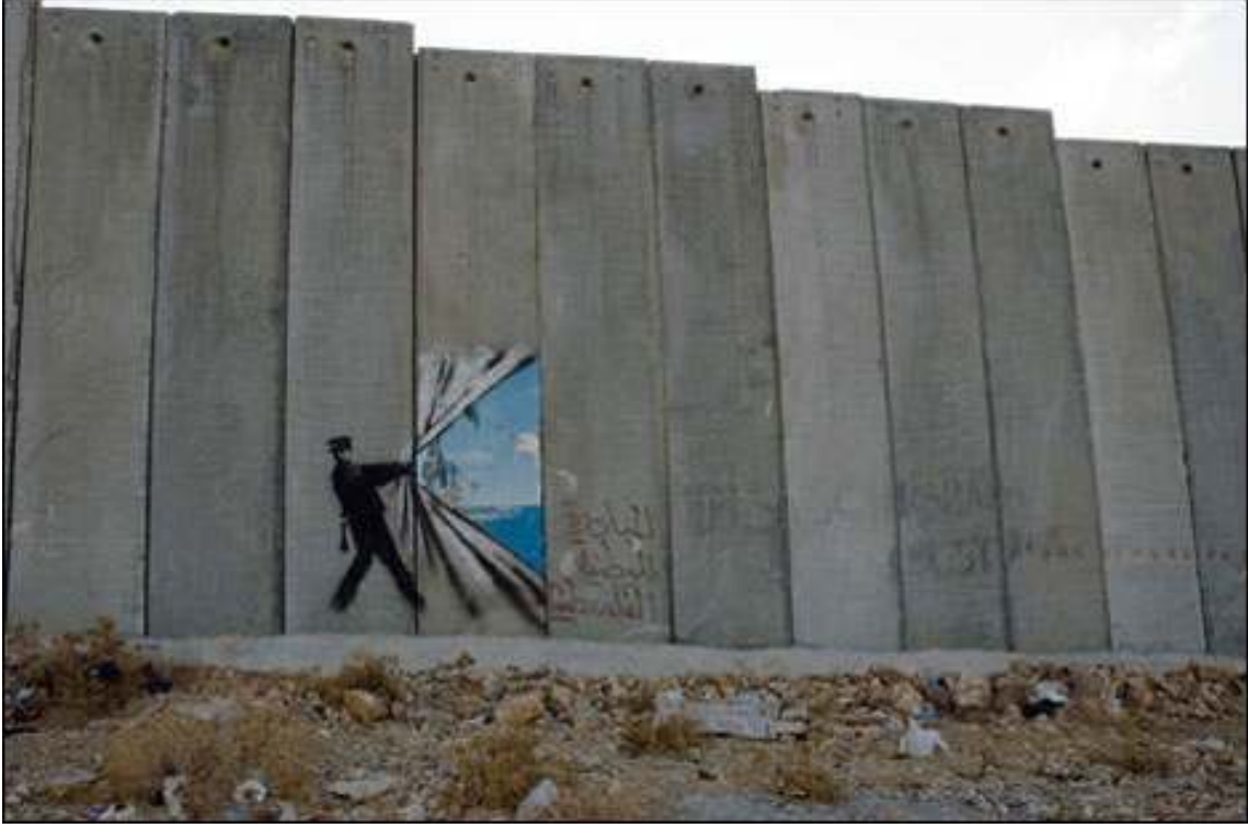
Resim 4: Tatil Enstantaneleri, Filistin, 2005

Yaşlı Adam: Biz duvarın güzel olmasını istemiyoruz, biz duvardan nefret ediyoruz, evine git.