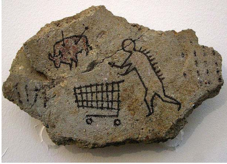
Resim 14: British Museum'a bıraktığı işi, 2005.

Banksy British Museum'a illegal yollarla bıraktığı bu eserin altına "Post Kaotik Döneme Aittir" şeklinde bir yazı bırakmıştır. Müze görevlileri ve ziyaretçiler uzun süre bu eseri farketmemiş ve 8 gün boyunca asıldığı yerde kalmıştır. Bugün müzeyi ziyaret edenler bu eseri müzede görebiliyorlar çünkü eser yönetimin kararıyla müzenin kalıcı koleksiyonuna dahil edilmiştir. Aslında mekânsal anlamda bir sokak sanatçısı eserlerini sokağa bırakır ve o eser artık sokağa aittir, Banksy'nin illegal yollarla müzelerin duvarına bıraktığı işler de bu çelişkiyi yansıtır çünkü o müzelerin hiçbirisinde bir sokak sanatçısının işi yoktur, müzeler bu sanatçıları kapılarından içeri almazlar, hatta sanat olarak bile kabul etmezler.