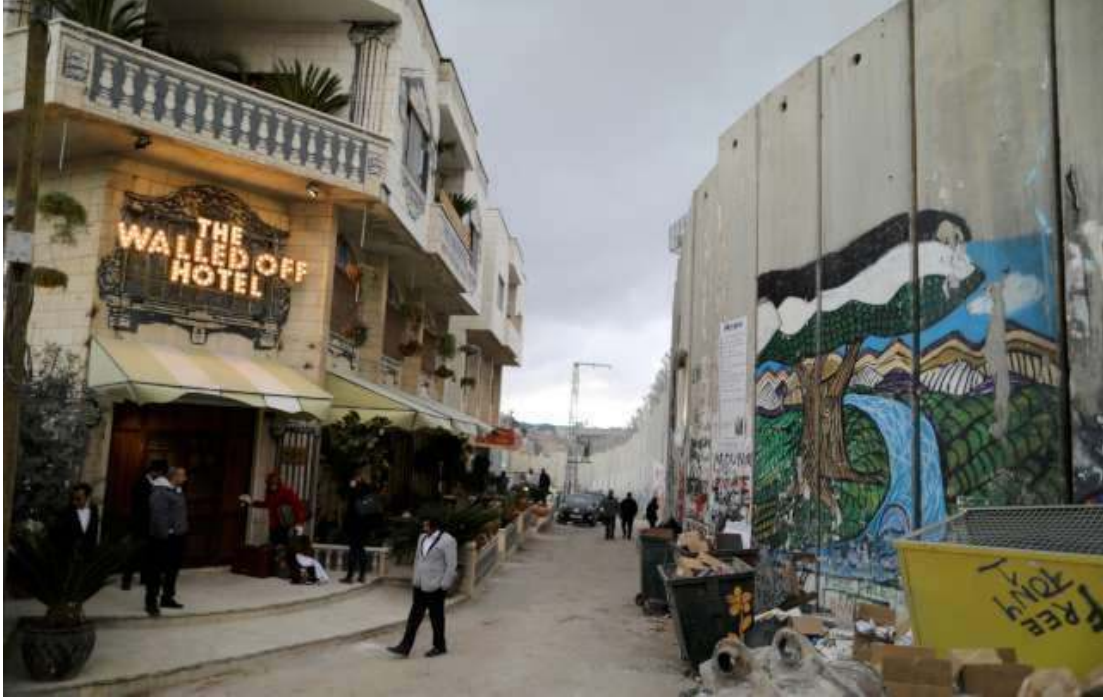
Resim 22: The Walled Off Hotel, 2017

Otelin odaları da Banksy'nin çoğunluğu çatışmayla ilgili olan çalışmalarıyla donatıldı.