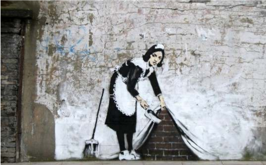
Resim 6: Hizmetçi, Londra, 2008.

Kız ve Asker adındaki bu eser İsrail duvarının Beytullahim bölgesine resmedilmiştir. Banksy, 'Santa's Ghetto' sergisinin tanıtımında bu resmi kullanmıştır. Sergi için Beytullahim bölgesini seçmiş olmasının nedenini, buranın İsa'nın doğum yeri olması ve aynı zamanda tüm insan hakları ihlalleri iddialarının da merkezi olması, şeklinde açıklamıştır.