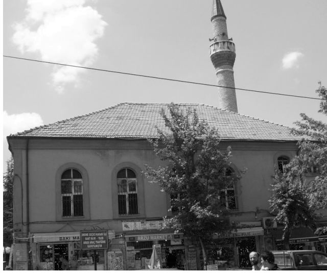
Figür 2: Anadolu Selçuklu Devleti döneminden kalan ve kentin en eski yerleşim alanlarından olan Odunpazarında yer alan Alaeddin Camii yıllar içinde yapılan çeşitli restorasyonlar sonucunda Selçuklu mimarisi özelliğini bir hayli kaybetmiştir. Cami 1944-1951 yılları arasında Eskişehir Arkeoloji Müzesi'nin temelini oluşturacak tarihi eserlerin depolandığı bir müze işlevi görmüştür.